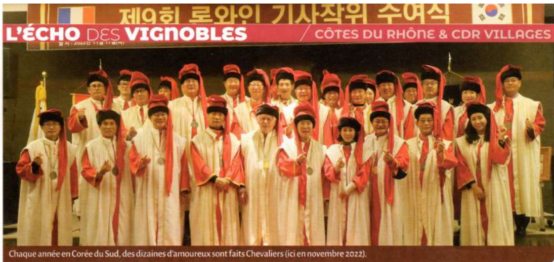
Chaque année en Corée du Sud, des dizaines d'amoureux sont faits Chevaliers (ici en novembre 2022).