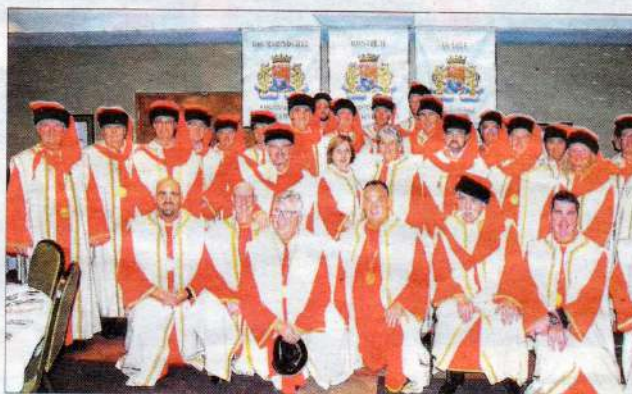
Lors des 35 ans des trois baronnies du Canada, en 2019.