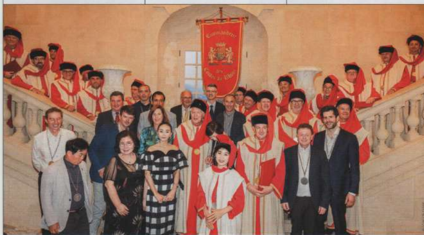
Commanderie des Costes du Rhône : les intronisés du 1 er juillet 2023.