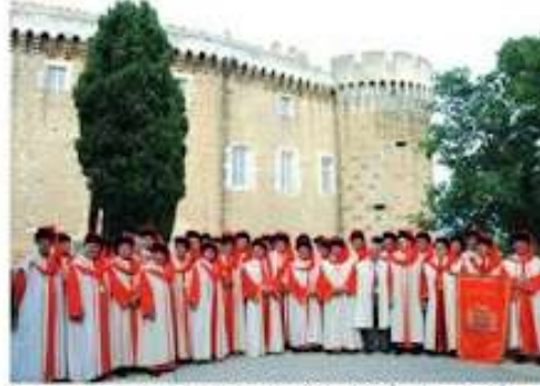
Les commandeurs de la commanderie des Costes du Rhône devant le château de Suzette-le-Floosse.

Traditionnellement, le Mondial des baronnies réunit, tous les cinq ans, les consuls et responsables des baronnies étrangères et les membres du bureau de la Commanderie des Costes du Rhône. Les objectifs de ces rencontres