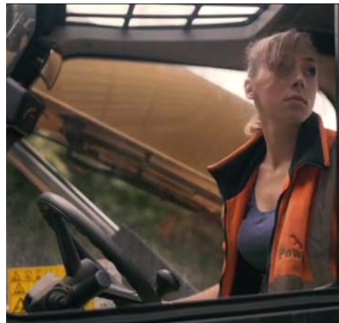
© CITB & BizEd Projects CIC 2023

Mae cynnal a chadw priffyrdd yn un o'r crefftau aur hynny...mae'r cymwysterau yr wyf wedi'u hennill yn cael eu cydnabod ac mae galw amdanynt ledled y byd,