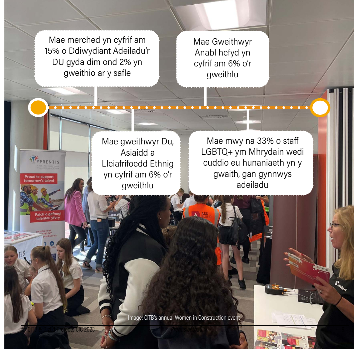
Image: CITB's annual Women in Construction event

Mae mwy na 33% o staff LGBTQ+ ym Mhrydain wedi cuddio eu hunaniaeth yn y gwaith, gan gynnwys adeiladu