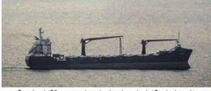
ஹோர்முஸ் நீரிணையைக் கடக்கும் சரக்கு கப்பல் (கோப்புப் படம்).

களான சவுதி அரேபியா, ஓமன், பஹ்ரைன், ஐக்கிய அரபு அமீரகம், ஜோர்டான் உள்ளிட்ட வளைகுடா நாடுகளில் அமைக்கப்பட்டிருந்த அமெரிக்க ராணுவ நிலைகளைக் குறிவைத்து ஈரான் தாக்குதல் மேற்கொண்டது. தற்போது ஈரான் துறைமுகங்களுக்கு ஆபத்து ஏற்பட்டால், மத்திய கிழக்கு பிராந்தியத்தில் உள்ள துறைமுகங்கள் பாதுகாப்பாக இருக்காது என்று அந்நாடு தெரிவித்துள்ளதன் மூலம், சவுதி அரேபியா, ஓமன், பஹ்ரைன், ஐக்கிய அரபு அமீரகம் உள்ளிட்ட நாடுகளின் துறைமுகங்கள் மீது தாக்கு