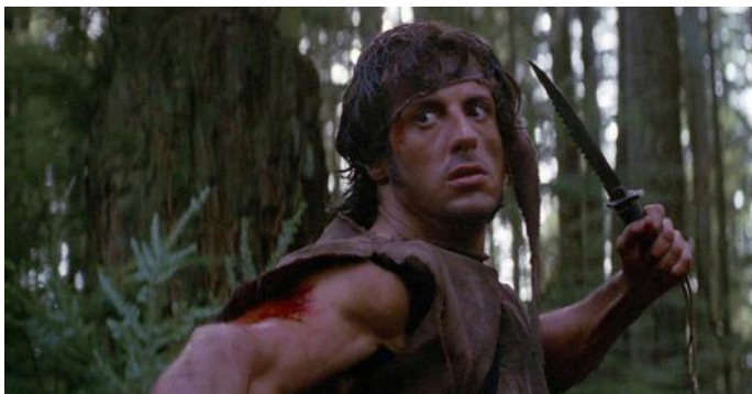
Rambo en acción.

Cuando entramos a los scouts, pensábamos que todo ahí dentro era una continuación de las películas de Rambo, con todo y pañoleta amarrada a la cabeza; hoy sospechamos que más bien se trata de una variante de las caricaturas de los Simpson, metáfora vigente por más de tres décadas y medio millar de episodios, lo que termina por convertir al desquiciante Homero en el portavoz de algunas verdades absolutas.