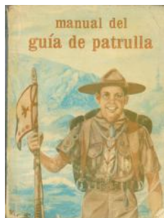
Manual del guía de patrulla.

Independientemente de los resultados obtenidos, aquellos libros son uno de los recuerdos más entrañable para quienes hemos pasado por el movimiento scout y hoy tenemos más de cuarenta años de edad; paradójicamente, la imagen que poseemos de su autor llegó a ser casi fantasmagórica: en ninguno de ellos se reproduce una foto suya y el estilo de los contenidos rehúye la anécdota autobiográfica que permita formarnos una idea medianamente clara sobre la personalidad de quien ejerció la mayor influencia sobre los scouts de México y buena parte de Latinoamérica, en la segunda mitad del siglo 20 (formo parte de la generación que vivió el accidentado tránsito hacia el plan de adelanto impuesto a principios de los ochenta, cuando me canjearon una valorada insignia de Segunda Clase por sendos parches de Explorador/ Kon-Tiki, en una de las peores transacciones realizadas en mi vida).