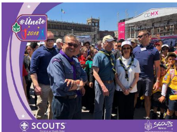
Carlos Gustavo de Suecia en el Zócalo capitalino, durante una posterior visita realizada a México, en 2018.

Hasta entonces pensaba que la realeza se limitaba a los mirreyes que frecuentan los antros de Lomas Verdes.