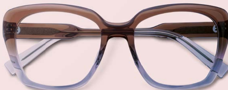
Marc O'Polo EYEWEAR