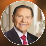
von Kenneth Copeland