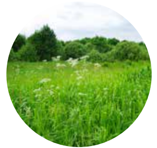
Holde matjorda i drift