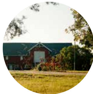
Landbrukets egen nedbygging