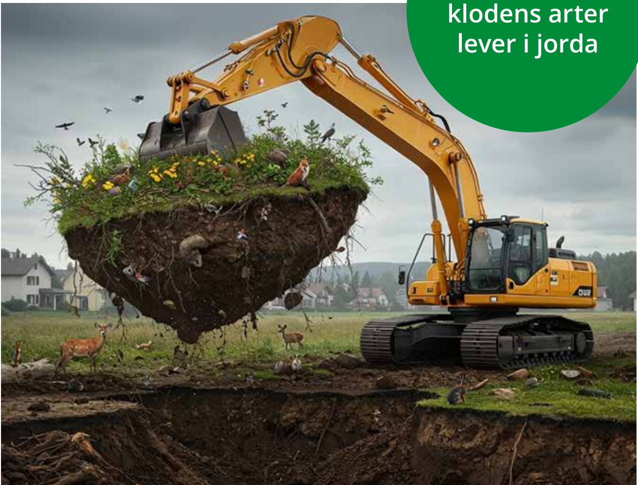
Bildet er laget ved hjelp av KI.

Over 50 % av klodens arter lever i jorda