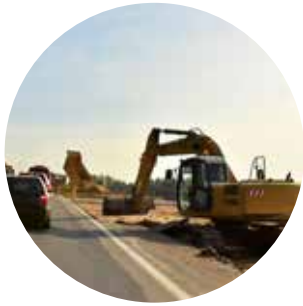
Utbygging til vei og bane