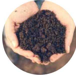
Lite kunnskap om viktigheten av matjord