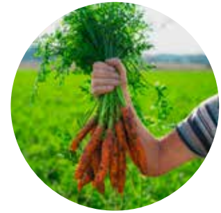
Lite kunnskap om landbruksnæringen