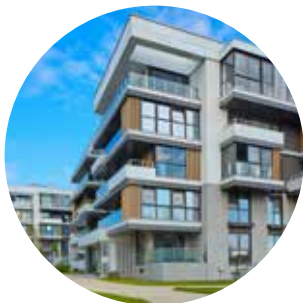
Utbygging til bolig og næring