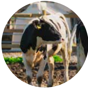
Dårlig økonomi i landbruket

Mangel på klare mål, tilstrekkelig innsats og støttespillere gjør det utfordrende å bevare matjord. Vi kan ikke forvente at Norges økonomiske styrke alene vil løse disse problemene.