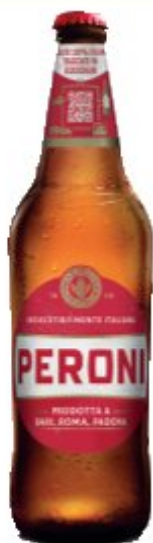
PERONI Birra 66 cl