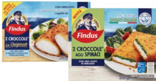
FINDUS Croccole 216/200 g