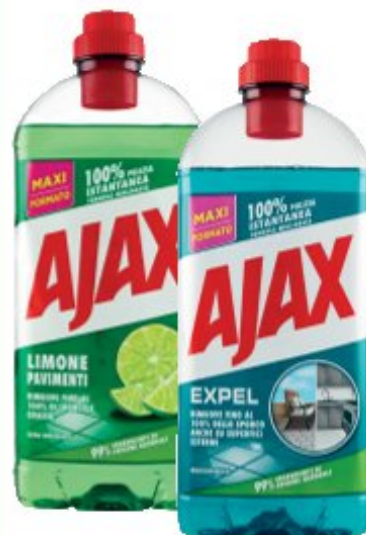
AJAX Detergente Pavimenti 1250 ml