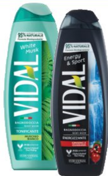
VIDAL Bagnodoccia 500 ml