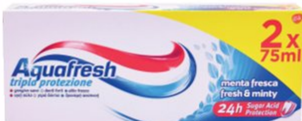
AQUAFRESH Tripla Protezione Dentifricio 75 ml x 2