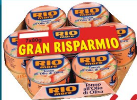
RIO MARE Tonnino All'olio Di Oliva 80 g x 7