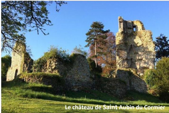
Le château de Saint Aubin du Cormier

Petite cité médiévale de plus de 4000 âmes qui surplombe la vallée du Coesnon, St Aubin du Cormier fête, cette année, ses 800 ans.