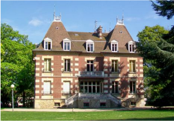
Mairie de Survilliers