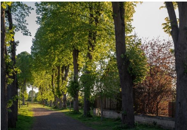
Parc Naturel Régional Oise – Pays de France

Survilliers est une charmante commune située dans le département du Val-d'Oise. Nichée au cœur de la région Île-de-France, Survilliers offre un cadre de vie paisible et agréable, à proximité de la dynamique métropole de Paris.