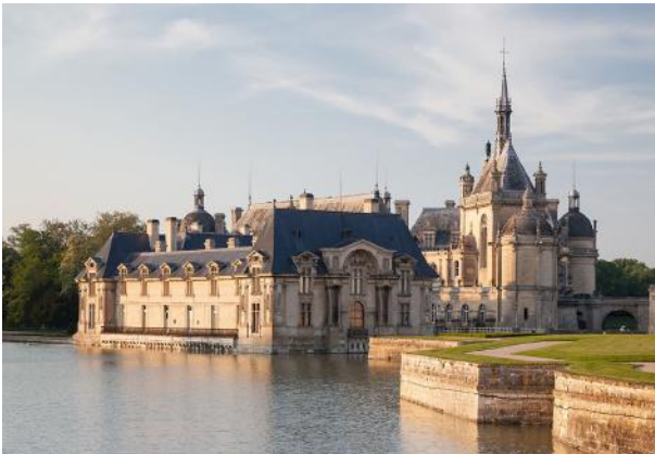
Château de Chantilly