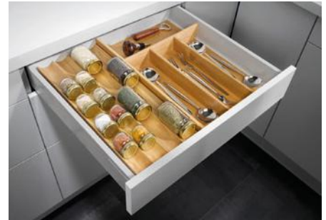
Ladenausstattung in Eiche