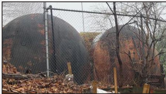
די ראסטיגע טענק וואו עס ווערט געהאלטן די "וואסער" צום באנוץ

די אַבסורדקייט שרייט פון זיך אַליין! פארוואס אויף דער וועלט זאלן מיר שטייערצאָלער דאַרפן זיין אויסגשטעלט צו דראסטיש געהעכערטע קאָסטן, אלץ ווייל אין ווילעדזש האָל הערשט אזא שלאבערישע ווירטשאַפט און אומבאַקלעפּשעטער צוגאַנג צו יעדער זאך, מיט אור-אַלטע ביוראָקראַטישע מעטאָדן וואָס ברענגען נאָר שאַדן.