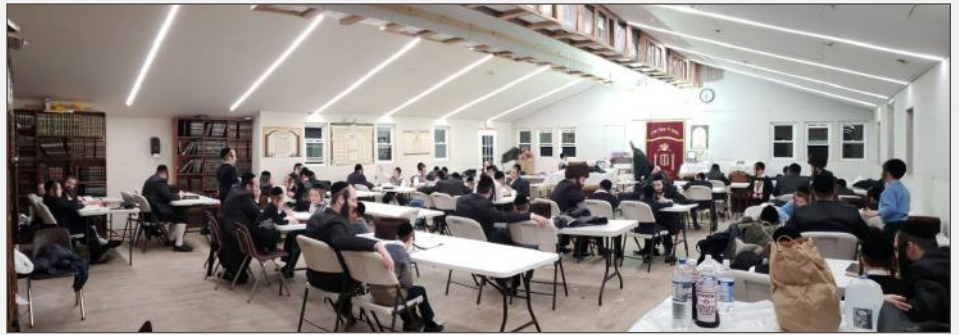
א מחזה הוד וועכנטליך יעדן מוצ"ש ביי די אבות ובנים

הערנדיג אזעלכע פאזיטיווע און פריידיגע פלענער בלייבט בלויז איבער צו ווינטשן און בענטשן, בשם אלע איינוואוינער, ויהי נועם ה' אלקינו עלינו ומעשי דינו כוננה עלינו! מען זאל טאקע גאר בקרוב קענען מאכן די אזוי - ערווארטעטע בוי - פארשריט לשמחת לב כל תושבי העיר אמנ'!