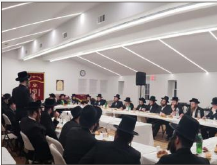
א מסיבת סיום מסכת החינוך ללימוד התורה בהיכל ביהמ"ד פארלאפענע זומער

טהרה, וואס איז טאקע אויפגענומען געווארן דורך תושבי העיר מיט אן ערווארטונג צו קענען מיטהאלטן די וויכטיגע שיעורים וואס פאדערט כסדר'דיגע חזרה.