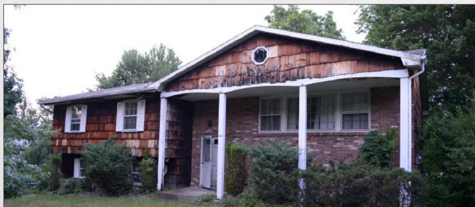
דאס הויז ביים אפקויפן פון די באנק תשע"ז - וועלכע איז רענאווירט און פארברייטערט געווארן אלס דער יעצטיגער בנין הביהמ"ד