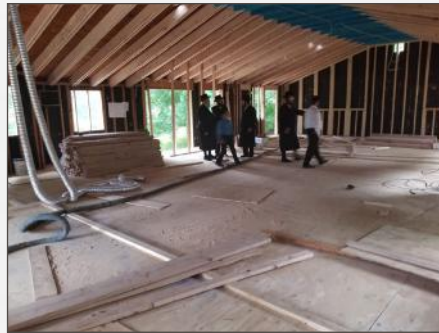
אינמיטן די העפטיגע בוי ארבעט אהערצושטעלן דעם ביהמ"ד בעפאר ימים נוראים תשע"ח

באלד אינאיינעם מיט'ן התייסדות פון דאס בית המדרש האט מען ארויסגעקוקט צו אויפנעמען א פאסיגן רב וואס זאל זיין געאייגנט צו פירן די קהלה, אשר יצא לפנייהם ואשר יבא לפנייהם, און מען האט דאן תיכף ממנה געווען דעם רב שליט"א, וואס זאל אונז