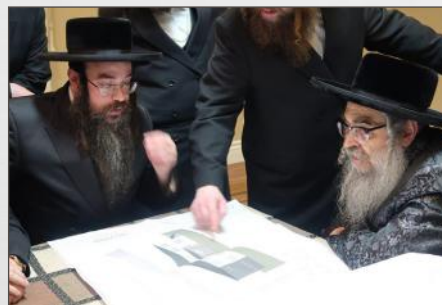
דער רב שליט"א ביים איבערגיין די פלענער פון הרהבת גבולי הקדושה אינאיינעם מיט ב"ק מרן אדמו"ר מסאטמאר שליט"א ווינטער תשע"ט

ווען מען האט פלאנירט צו אנהויבן ארויסבויען די מקוה, ווי נאר מען האט אנגעהויבן גראבן האבן זיי אפגעשטעלט די ארבעט. דאס זעלבע ווען מען האט געוואלט אויספלאסטערן א באקוועמע 'פארקינג לאט' איז דאס אפגעשטעלט געווארן. און