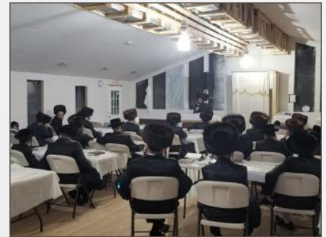
די ערשטע שיעור דורכ'ר רב שליט"א, חוה"מ סוכות תשע"ח

אנומלט איז נתפרסם געווארן אז די קומענדיגע צוויי דינסטאג'ס, אין די לעצטע צוויי וואכן פון די ימי השובבי"ם, וועט דער רב שליט"א פארלערנען שיעורים כללים בהלכות