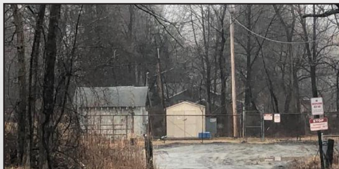
נאך א טייל פונעם וואסער סיסטעם אויף די 208 (קעגנאיבער מענגין רד.)

דא איז פאַרהאַן גענוג און נאך גוטע וואסער וואָס מ'קען אַריינברענגען. די 'סליפ אין' האטעל האט שפרודלדיגע קוועלער מיט ריינע וואסער וואס קענען שפייזן די גאנצע געגענט.