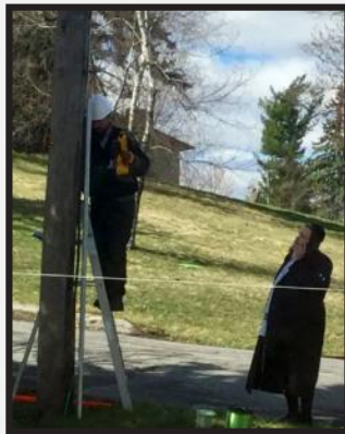
עוסק בתיקון עירובין...