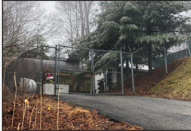
די וואסער אינפראסטרוקטור... הארט נעבן די שארטקאט אויף מענגין מערקט אויף די רעכטע זייט דעם כאטקע, וואו מ'קאנטראלירט די סיסטעם...