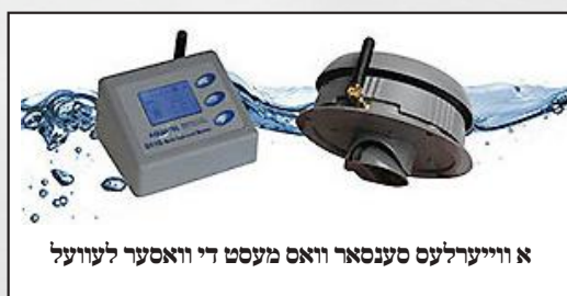
אַ ווייערלעס סענסאר וואָס מעסט די וואַסער לעוועל

זיי קריגן פעיראַל פאַר'ן "זשאַב" פון באַאַבאַכטן די וואַסער-לעוועל. דאָס טייטש: זיי קריכן ארויף אויפ'ן טאַנק און קוקן די וואַסער-