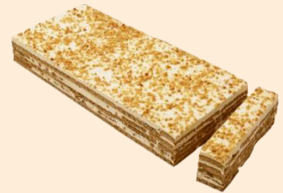
TRANCHE DE BOLACHA CROCANTE | 1,000Kg COD: D128