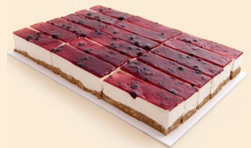
PLACA CHEESECAKE FRUT. SILV. 2,300Kg / 25 Fatias / 2 uni COD: No4644F