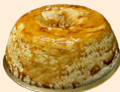
MOLOTOF DE CARAMELO 900g / 2 uni COD: BS008