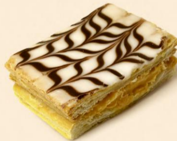
MIL FOLHAS 100g / 18 uni COD: D5513