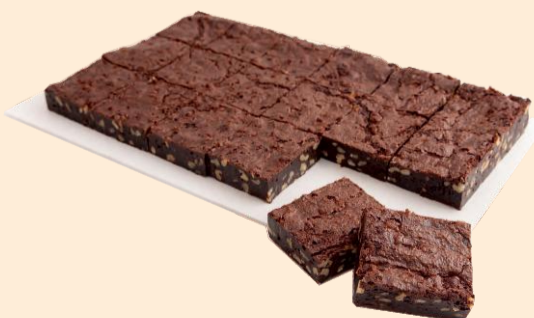
PLACA DE BROWNIE 1,350Kg / 18 Fatias / 2 uni COD: No4660