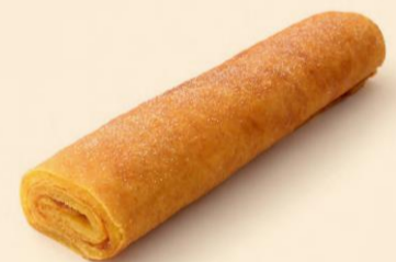
TORTA DE LARANJA 1300g COD: D04353