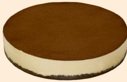
SEMI FRIO TIRAMISÚ 1,500Kg COD: 1304303