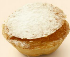
PASTEL DE FEIJÃO 70g / 60 uni | 70g / 25 uni COD: D6381 | D638