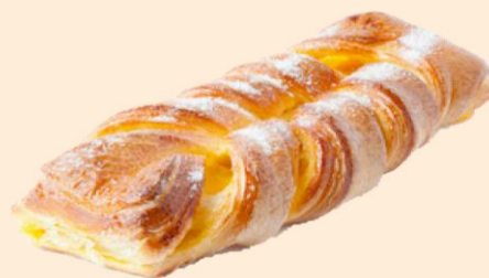
TRANÇA 200g / 20 uni COD: CV5531