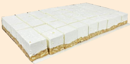
PLACA SEM COBERTURA 2,300Kg / 45 Fatias / 2 uni COD: No4644