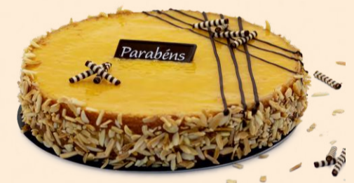
BOLO DE ANIVERSÁRIO de Doce de Ovo | 1,000Kg COD: 1302323