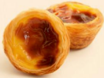
PASTEL DE NATA 80g / 90 uni JO COD: D5070