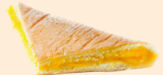
GUARDANAPO C/ CREME DE OVO 150g / 20 uni. COD: D93021