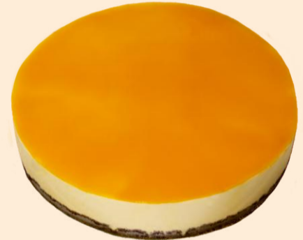
SEMI FRIO MANGA 1,950Kg COD: 1304323