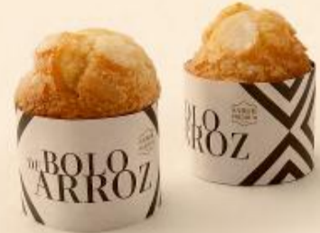
BOLO DE ARROZ 65g / 40 uni. COD: 557002