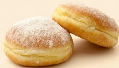
BOLA DE BERLIM S/ CREME 60g / 30 uni. COD: D1093