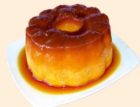
PUDIM DE OVOS 1000g / 8 uni COD: BS012