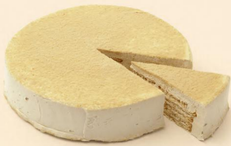
BOLO DE BOLACHA 800g | 1,200Kg COD: D4011 | D4010