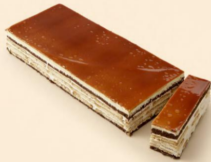
BOMBOM DE CARAMELO 1,300Kg COD: D4003