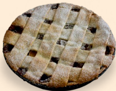
TARTE DE MAÇÃ ENTRANÇADA 1,300Kg COD: 1301335