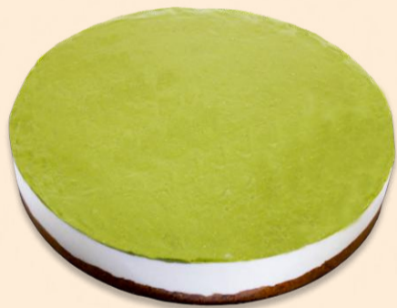
CHEESECAKE PISTÁCIO 1,500 Kg COD: 1304314