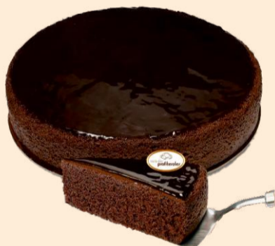
CACAU SUBLIME 1,500Kg | 6 uni COD: C63034