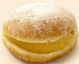
BOLA DE BERLIM 100g / 30 uni COD: D1065