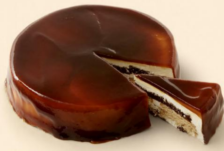
BOLO DE BOLACHA E CARAMELO 1,500Kg COD: N4001