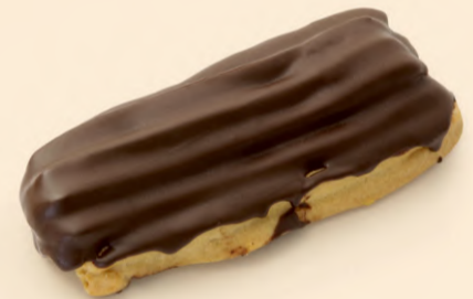
ECLAIR DE CHOCOLATE 70g / 20 uni. COD: Do1020