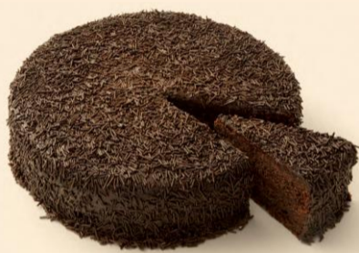
BOLO BRIGADEIRO 1,500 Kg | 800g COD: D238 | D347