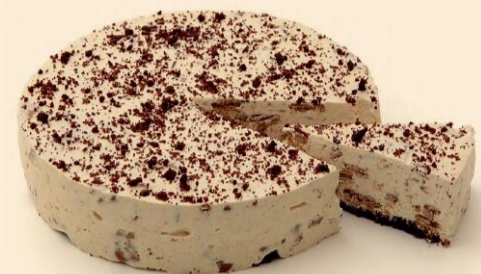
BOLO DE COOKIES 700 g COD: D238