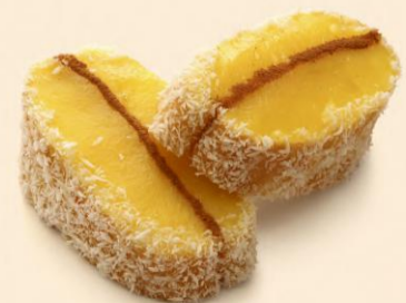
PATA DE VEADO 90g / 20 uni COD: Do1066 PRT