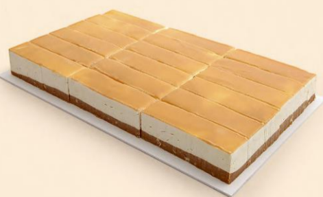
PLACA CHESECAKE CARAM SALG 2,300Kg / 25 Fatias / 2 uni COD: No4652F