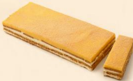
BOLACHA E LEITE COND / TRANCHE BOLACHA CREME 1,200Kg | 1,300Kg COD: D160 | REFCD D4341