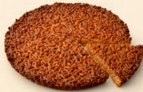
TARTE DE AMÊNDOA 900g / 3 uni COD: D04353