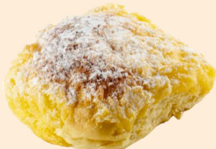
PÃO DE DEUS 130g / 20 uni COD: CV5522