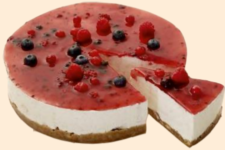
SEMI FRIO FRUTOS SILVESTRES 1,500 Kg | 1 Kg COD: D309 | D4015