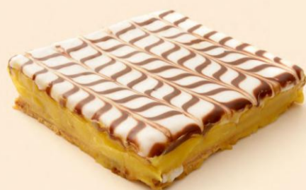
BOLO MIL FOLHAS 650g / 3 uni COD: N04320