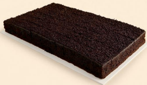
PLACA BRIGADEIRO FATIADA 2,300Kg / 25 Fatias / 2 uni COD: No4641F