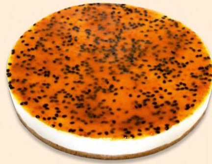
SEMI FRIO DE MARACUJÁ 1,450 Kg COD: 1304312