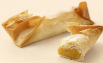
PASTEL DE TENTÚGAL 80g / 6 uni COD: No1701