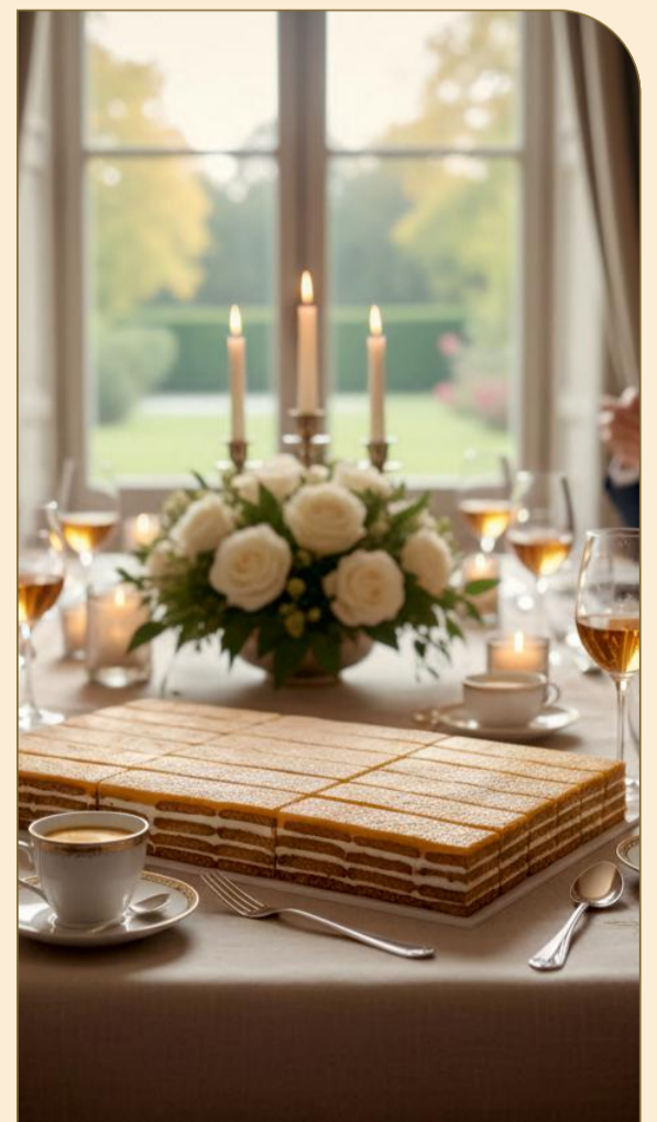
PLACA BOLACHA LEITE FATIADA 2,300Kg / 25 Fatias / Cx. 2 uni COD: No4645F