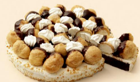
BOLO DE PROFITEROLES 800g COD: D176