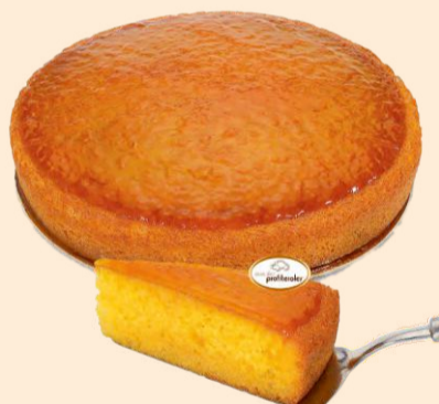
SUBLIME DE LARANJA 1,500Kg | 6 uni COD: C63036