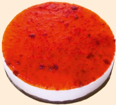
SEMI FRIO DE MORANGO 1,800 Kg COD: 420191