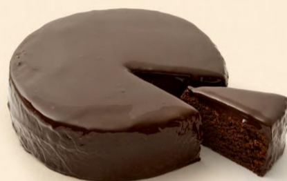
ENSOPADO DE CHOCOLATE 1,500Kg COD: D4030