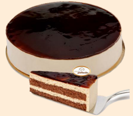
SEMI FRIO DE CAFÉ 1,500 Kg / 6 uni COD: D308