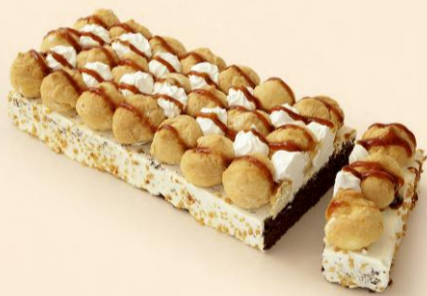
TRANCHE DE PROFITEROLES 1,300Kg COD: D167