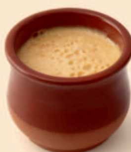
TAÇA BARRO BABA DE CAMELO 90g / 18 uni COD: D4022