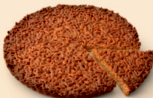
TARTE DE AMÊNDOA 900g / 3 uni COD: D04353