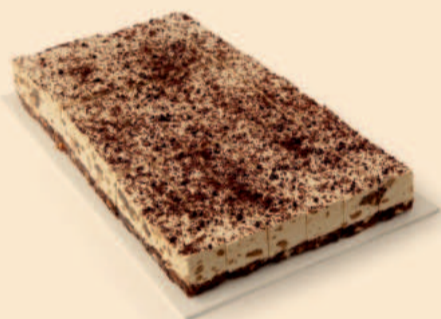
PLACA DE COOKIES 2,300Kg / 25 Fatias / 2 uni COD: D167