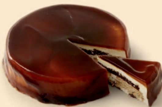
BOLO DE BOLACHA E CARAMELO 1,500Kg COD: N4001