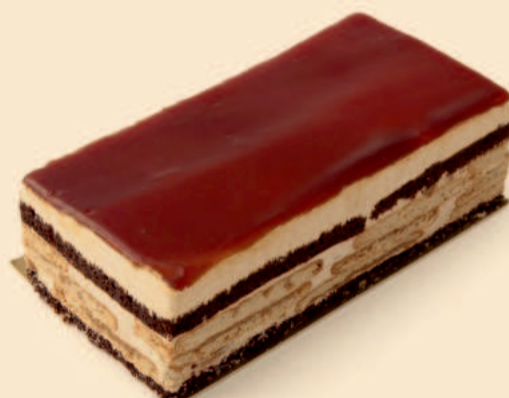
BEM BOM CARAMELO 280g / 8 uni. COD: S/ COD