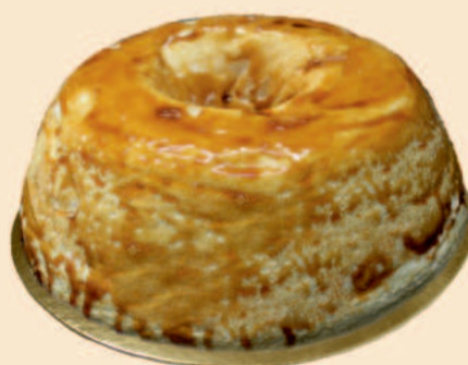
MOLOTOF DE CARAMELO 900g / 2 uni COD: BS008