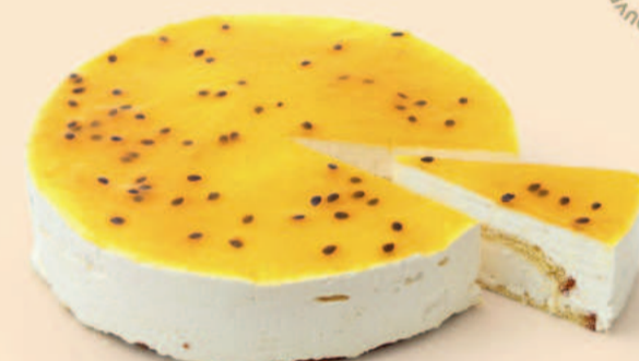
SEMI FRIO DE MARACUJÁ 1,200Kg / 1 uni COD: D352