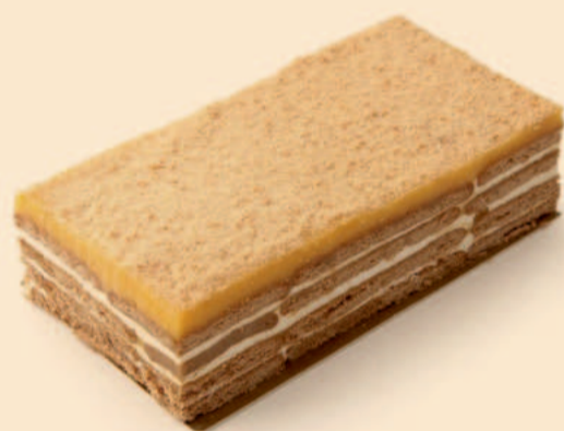
BEM BOM DE BOLACHA 280g / 8 uni. COD: S/ COD