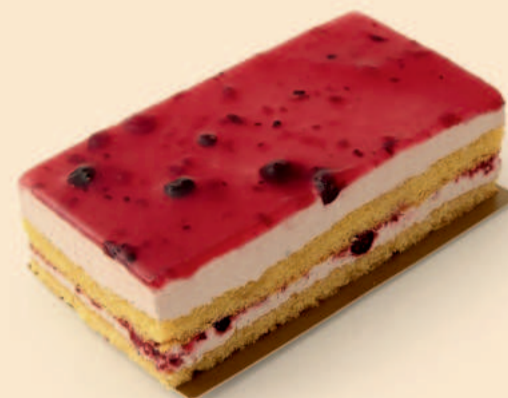
BEM BOM FRUTOS SILVESTRES 280g / 8 uni. COD: S/ COD