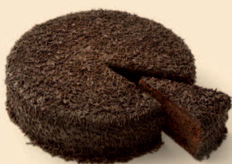
BOLO BRIGADEIRO 1,500 Kg / 1 uni | 800g / 2 uni COD: D238 | D347