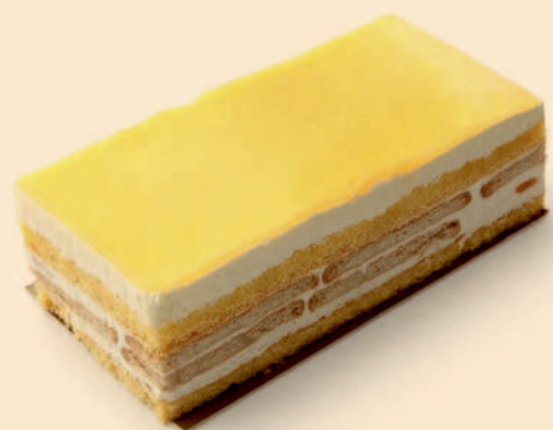
BEM BOM LIMÃO 280g / 8 uni. COD: S/ COD