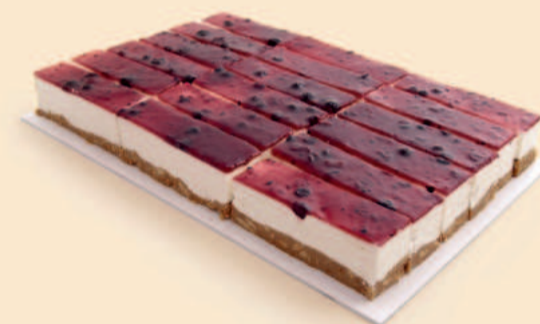
PLACA CHEESECAKE FRUT. SILV. 2,300Kg / 18 Fatias / 2 uni COD: N04644F