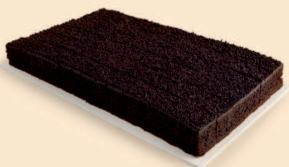
PLACA BRIGADEIRO FATIADA 2,300Kg / 18 Fatias / 2 uni COD: N04641F