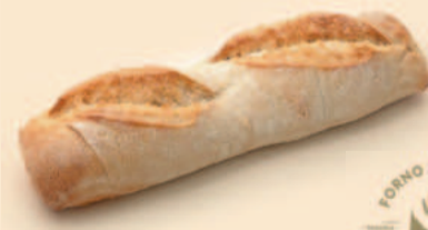
CACETINHO DE SÃO MIGUEL 270g / 25 uni | 140g / 60 uni COD: N01341 | N01340