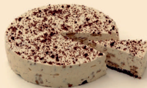
BOLO DE COOKIES 700 g / 1 uni COD: D238