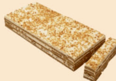
TRANCHE DE BOLACHA CROCANTE 1 Kg COD: D128