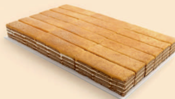
PLACA BOLACHA LEITE FATIADA 2,300Kg / 18 Fatias / Cx. 2 uni COD: N04645F