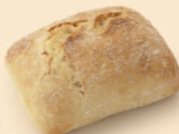
MINI CHAPATA RÚSTICA 95g / 65 uni COD: N02026