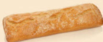
CHAPATA 400g / 20 uni COD: B211280