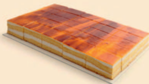
PLACA SÃO MARCOS 2,300Kg / 25 Fatias / 2 uni COD: N04641F