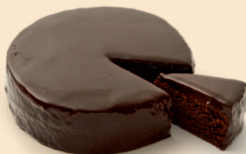
ENSOPADO DE CHOCOLATE 1,500Kg COD: D4030