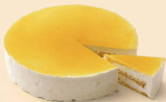
SEMI FRIO DE LARANJA 1,000 Kg / 1 uni COD: D313