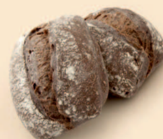
PÃO DE ALFARROBA 80g / 35 uni COD: N01288