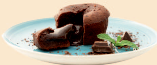
PETIT GATEAU DE CHOCOLATE 80g / 18 uni. COD: D1132