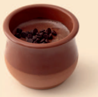
TAÇA BARRO MOUSSE DE CHOCOLATE 90g / 18 uni COD: D4024