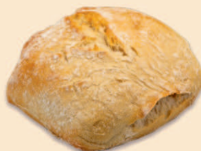
PÃO DE SÃO LOURENÇO 90g / 90 uni COD: 568200