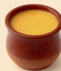
TAÇA NATAS DO CÉU 90g / 18 uni COD: D4020