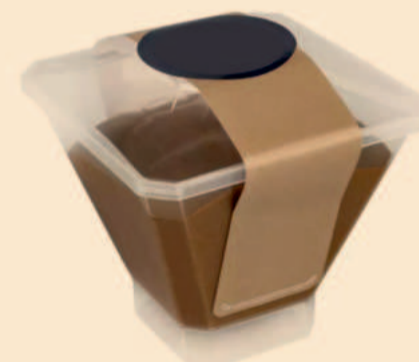
TAÇA MOUSSE DE CHOCOLATE 125ml / 21 uni COD: A403121