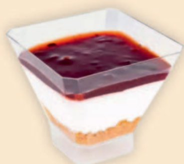
TAÇA CHEESECAKE 125ml / 21 uni COD: A436121