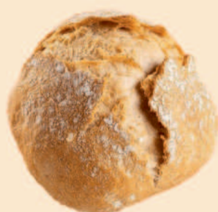
BOLA RÚSTICA 90g / 60 uni COD: P60324