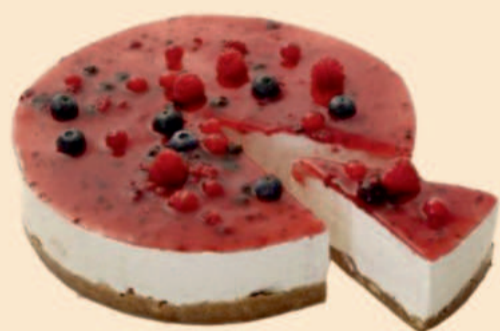
SEMI FRIO FRUTOS SILVESTRES 1,500 Kg / 4 uni | 1 Kg / 2 COD: D309 | D4015