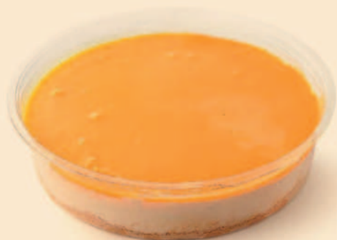
NATAS DO CÉU FAMILIAR 750g / 6 uni. COD: S/ COD