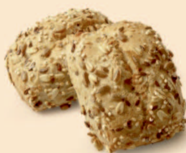
PÃO DE CEREAIS 35g / 75 uni COD: N01222