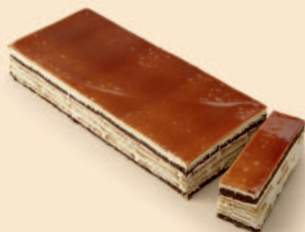
BOMBOM DE CARAMELO 1,300Kg COD: D4003