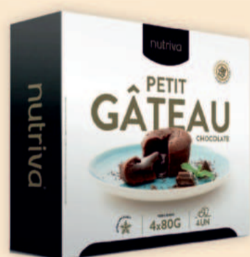
PETIT GÂTEAU DE CHOCOLATE 80g / 4 uni. COD: D1132