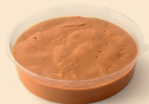
BABA DE CAMELO FAMILIAR 1,000 Kg / 6 uni. COD: S/ COD