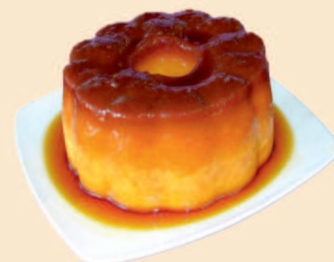
PUDIM DE OVOS 1000g / 8 uni COD: BS012