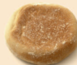
BOLO DO CACO 80g / 18 uni COD: N01131N