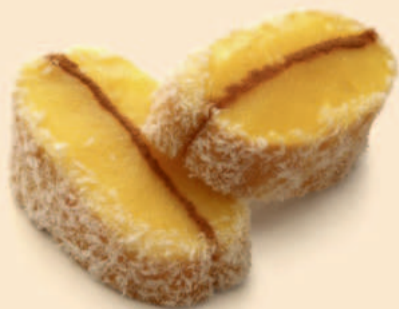
PATA DE VEADO 90g / 20 uni COD: D01066 PRT