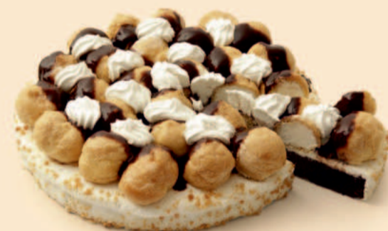
BOLO DE PROFITEROLES 800g / 2 uni COD: D176