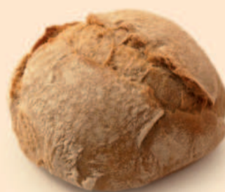
PÃO DE TRIGO E CENTEIO 80g / 80 uni. | 35g / 75 uni. COD: N01278N | N01277N