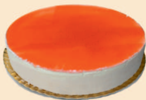
SEMI FRIO DE MORANGO 1,200Kg / 2 uni COD: SS007