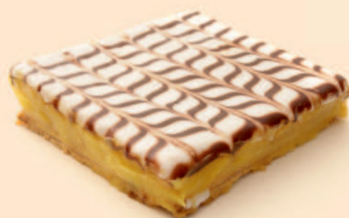
BOLO MIL FOLHAS 650g / 3 uni COD: N04320