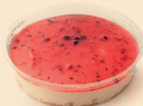
CHEESECAKE FAMILIAR 730g / 6 uni. COD: S/ COD