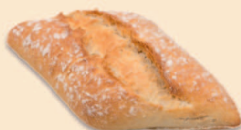
CARÇAÇA DE LENHA 75g / 100 uni COD: N01331