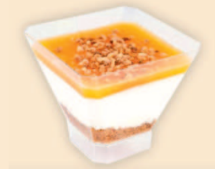
TAÇA NATAS DO CÉU 125ml / 21 uni COD: A406121