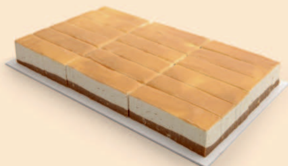
PLACA CHESSECAKE CARAM SALG 2,300Kg / 18 Fatias / 2 uni COD: N04652F