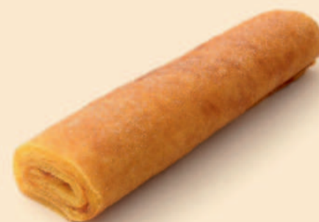
TORTA DE LARANJA 1300g / 3 uni COD: D04353