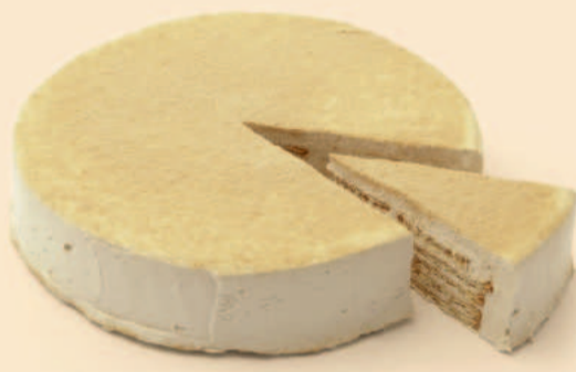
BOLO DE BOLACHA 800g / 2 uni | 1,200Kg / 1 COD: D4011 | D4010