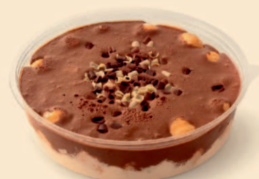
PROFITEROLES C/ CHOCOLATE 750g / 6 uni. COD: S/ COD