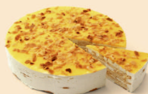
SEMI FRIO DE BOLACHA 1,500 Kg / 1 uni COD: N04037