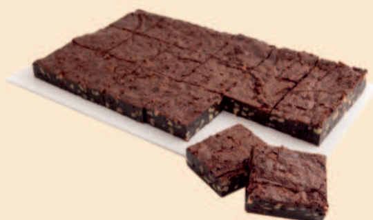
PLACA DE BROWNIE 1,350Kg / 18 Fatias / 2 uni COD: N04660