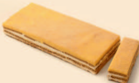
BOLACHA OVO E LEITE COND / TRANCHE BOLACHA CREME CD 1,200Kg | 1,300g COD: D160 | REFCD D4341