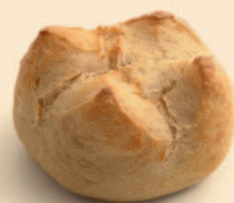
PÃO DA BAIRRADA 100g / 50 uni COD: N01276N