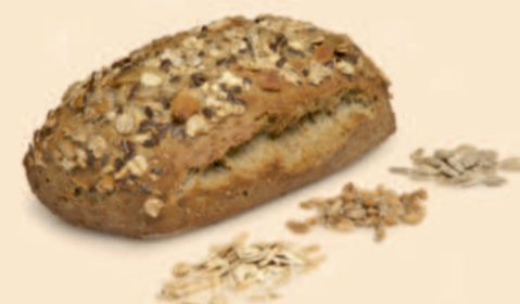
MINI CHAPATA DE CEREAIS 95g / 65 uni COD: N02020