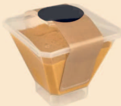
TAÇA BABA DE CAMELO 125ml / 21 uni COD: A402121