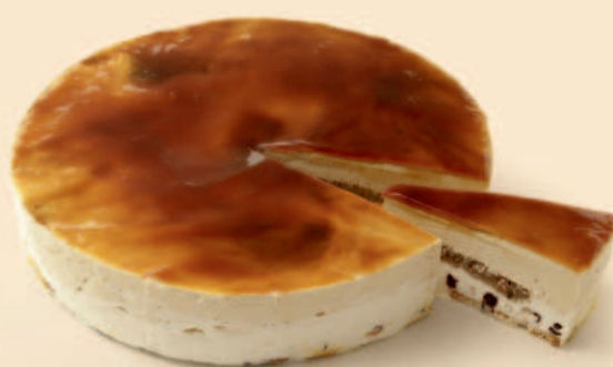
SEMI FRIO DE WHISKY 1,500Kg / 1 uni COD: N04042