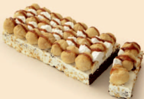
TRANCHE DE PROFITEROLES 1,300Kg COD: D167