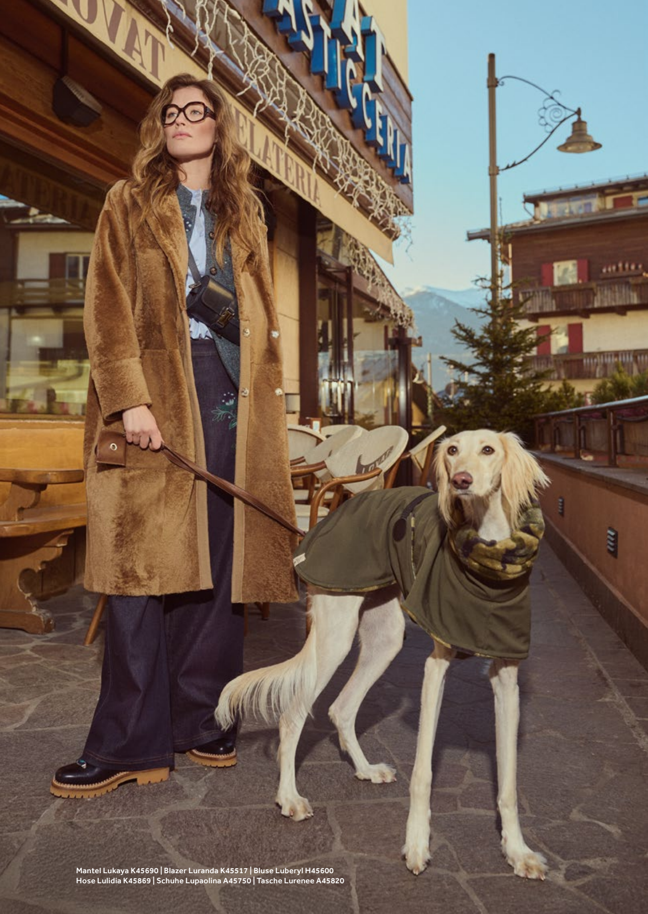
Mantel Lukaya K45690 | Blazer Luranda K45517 | Bluse Luberyl H45600 Hose Lulidia K45869 | Schuhe Lupaolina A45750 | Tasche Lurenee A45820