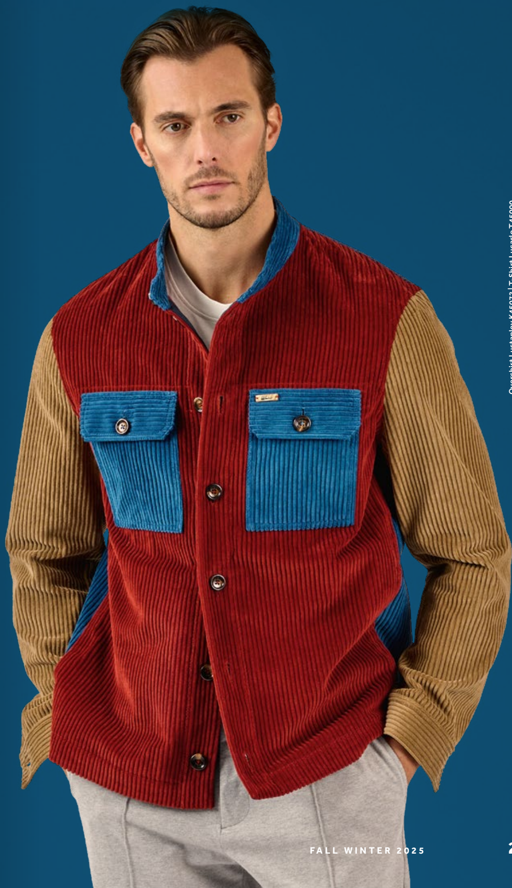
Overshirt Lustanley K45072 | T-Shirt Lucario T45000 Hose Lubrizzo K45350