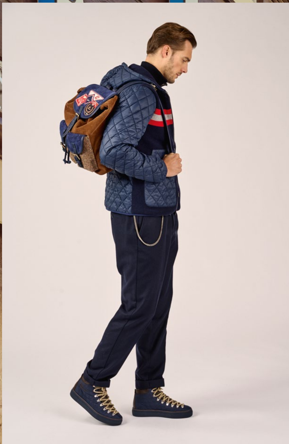
Jacke Lutluc K45130 | Pullover Luwilhelm P45111 | Hose Lubruneu K45310 Schuhe Lupaul A45515 | Rucksack Lumarcel A45965