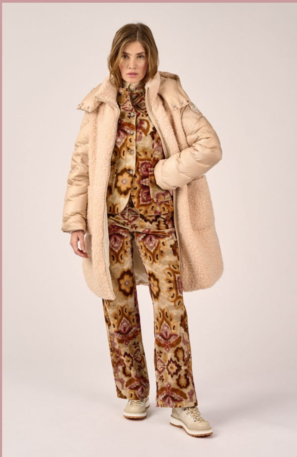
Jacke Luplacida K45685 | Blazer Luranda K45512 | Pullover Luwila P45510 Hose Lularetta K45820 | Schuhe Lugerna A45760