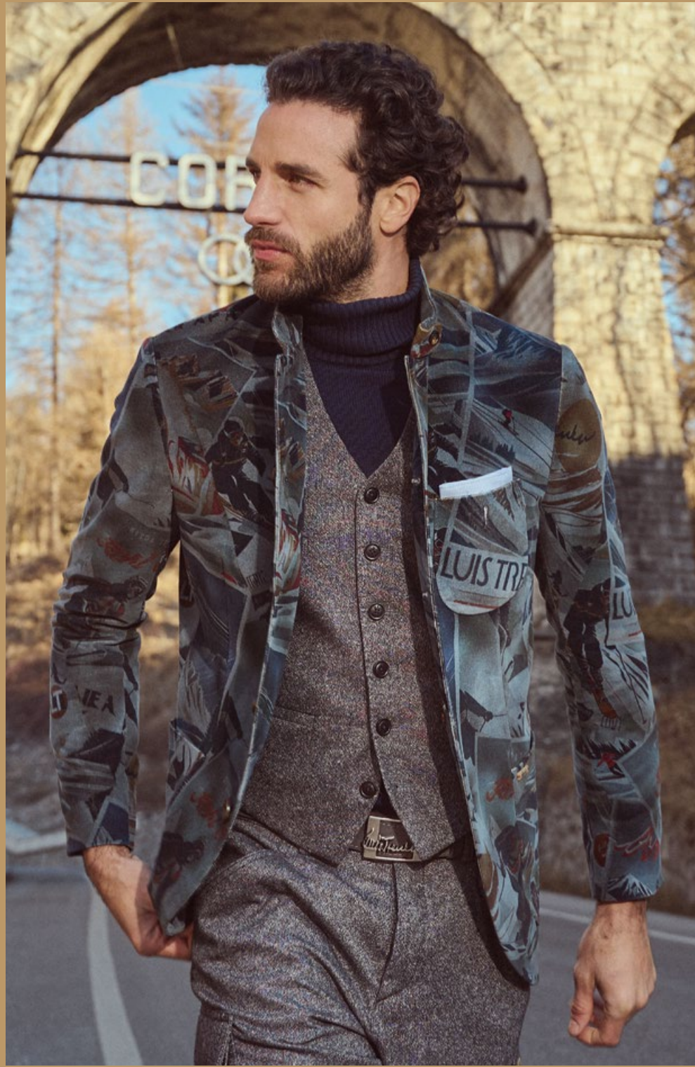
Blazer Lusandro K45005 | Gilet Lusebastian K45203 | Rollkragenpullover Luwalbert P45120 Hose Luberno K45361 | Gürtel Luf Franco A45105