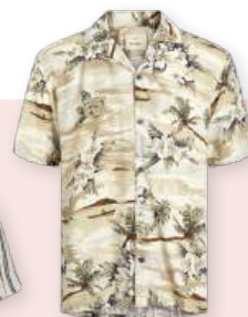
Shirt 39.99 €