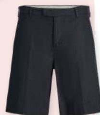
Short 49.99 €