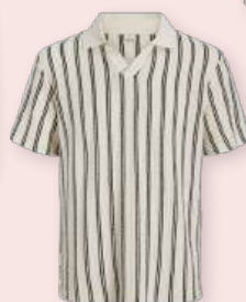
Polo 39.99 €