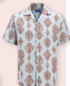
Shirt 39.99 €