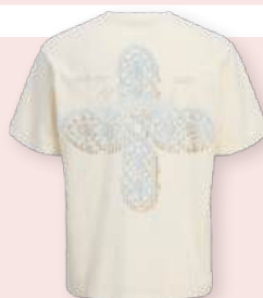
T-shirt 19.99 €