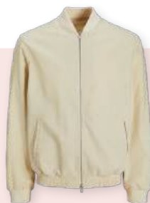
Bumper 69.99 €