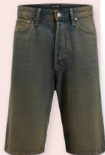
Short 34.99 €