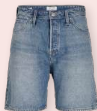
Short 39.99 €