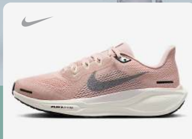
Nike Air Zoom Pegasus