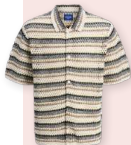
Polo 49.99 €

♦ Profitez de l'été avec des pièces iconiques et saisonnières de chez JACK & JONES . Chemises aux imprimés tropicaux pour une journée à la plage, polos en crochet pour déambuler dans les festivals ou ensembles ton sur ton pour un barbecue entre amis... tout y est !