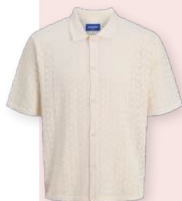
Polo 49.99 €