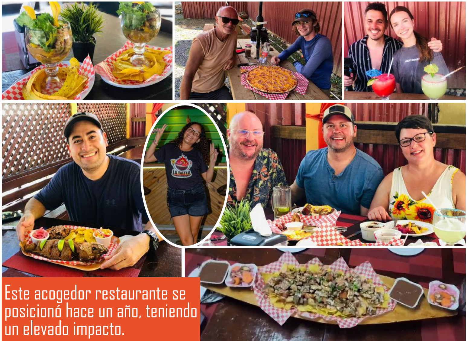
Este acogedor restaurante se posicionó hace un año, teniendo un elevado impacto.

fracaso, ya que tienen como visión y misión es darle el mejor servicio y nuevas experiencias aportando así al desarrollo turístico de La Isla de Roatán, ya que gracias a ellos ha sido su crecimiento en agradecimiento dan siempre todo por el todo en su lucha constante. Asimismo, el restaurante cuenta con sucursal en Coxen Hole, teniendo la visión de expandirse a lugares estratégicos dentro de la isla para llevar el sazón caribeño a cada rincón de Roatán. “El nombre de la batea es el nombre típico de la bandeja elaborada con madera en forma de barco donde en ella se sirven los platos familiares más grandes y exquisitos a su preferencia ya sean mariscos, o carnes a la parrilla todo fresco y de alta calidad”. Resaltó uno de los socios. Si quedaste encantado con este lugar, puedes hacer tu reservación al aire libre y bajo techo realizar tus reservaciones es tan fácil que con una simple llamada puedes reservar el día y el menú de tu preferencia, donde encontrarás distintas promociones. Comunicándote al +504 8848-918.