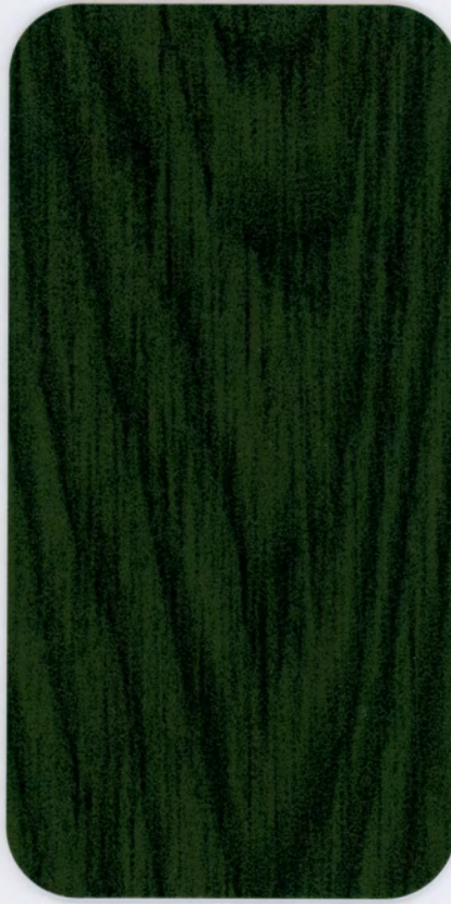
▶ GH 30 GREEN