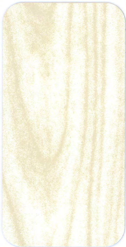
▶ PK RL18 A LACCATO BIANCO A