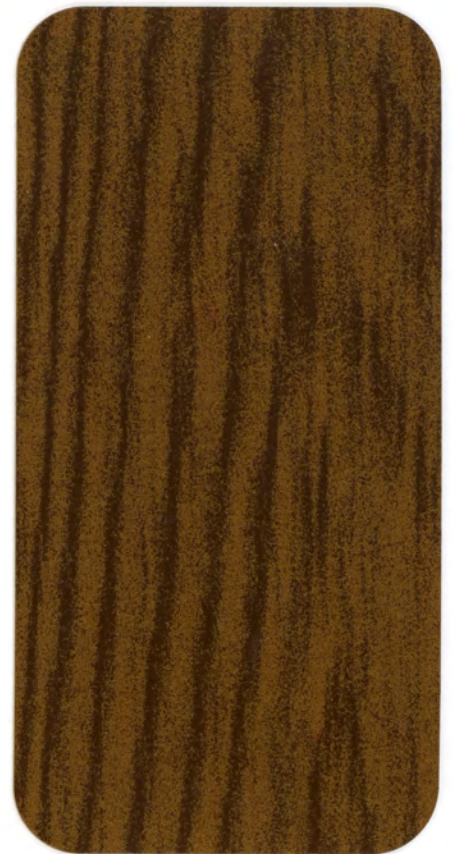
▶ NH 31 NOCE CHIARO EFFECTA