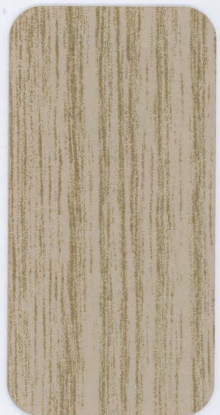
▶ HD 320 SAND ASH