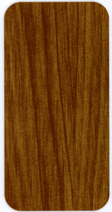
▶ R 500 ROVERE