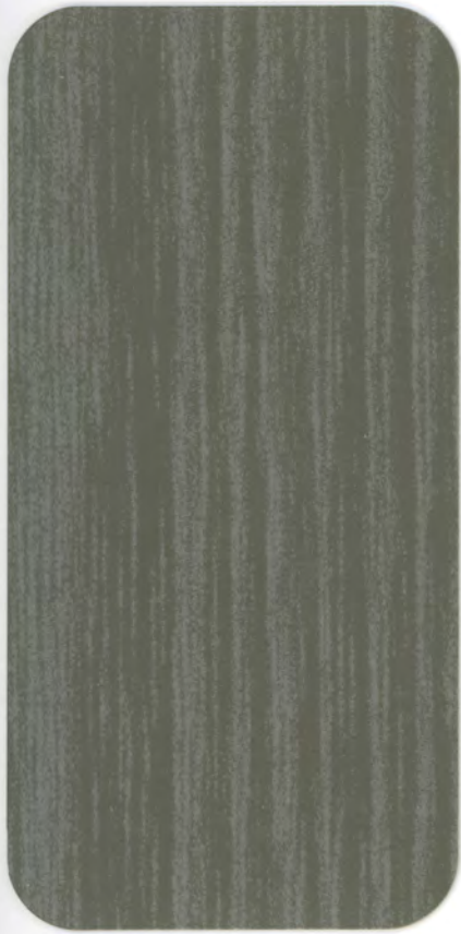
▶ HD 360 SILVER ASH