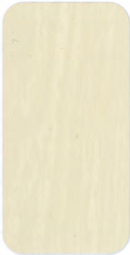
▶ PK RL12 IVORY