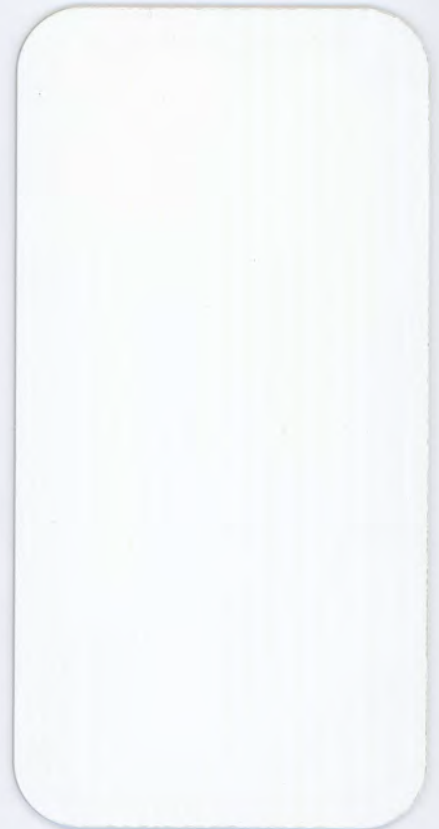
▶ HD 302 INFINITY ASH