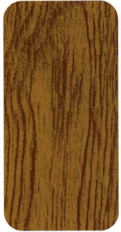
▶ R 809 RENOLIT ORO