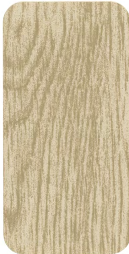
▶ HD 820 GREY OAK