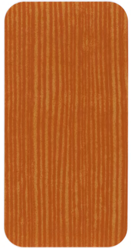
▶ DOUGLAS NATURAL