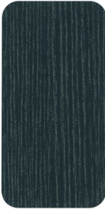
▶ HD 366 DARK ASH