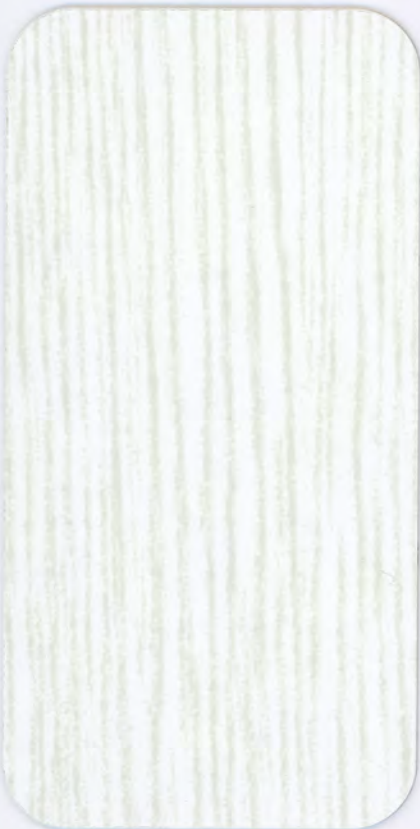
▶ HD 303 POLAR ASH