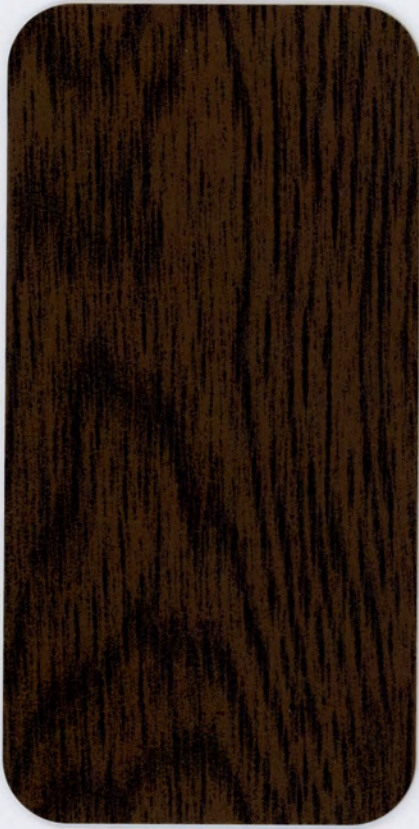
▶ HD 818 VULCANO OAK