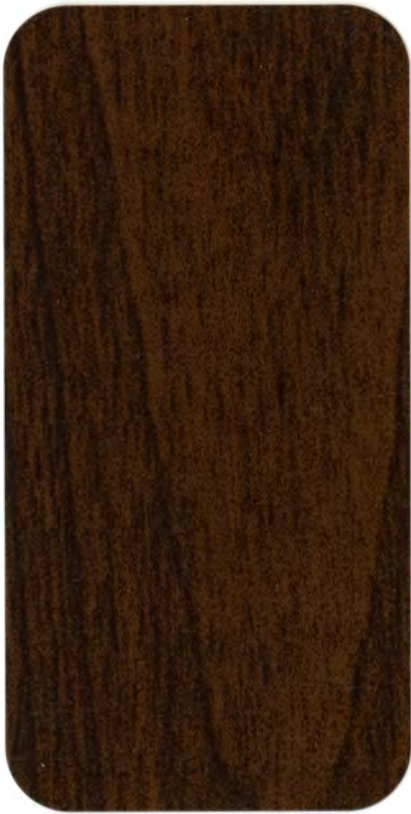
▶ N 530 CILIEGIO ANTICO