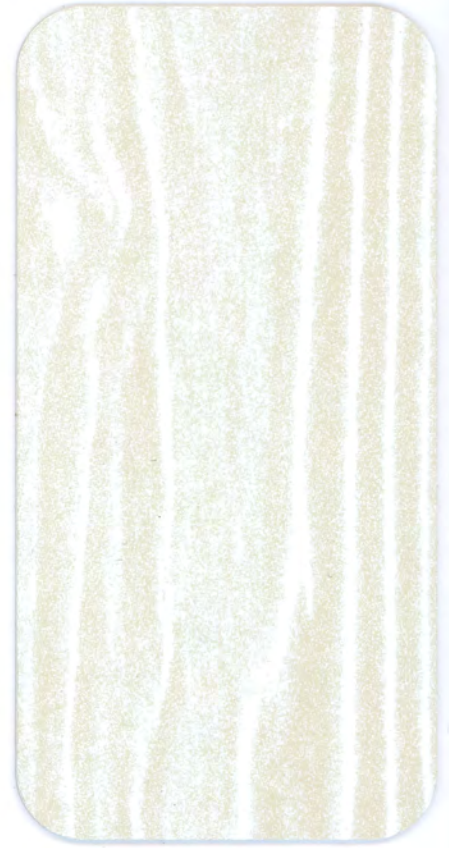
▶ PK RL18 LACCATO BIANCO