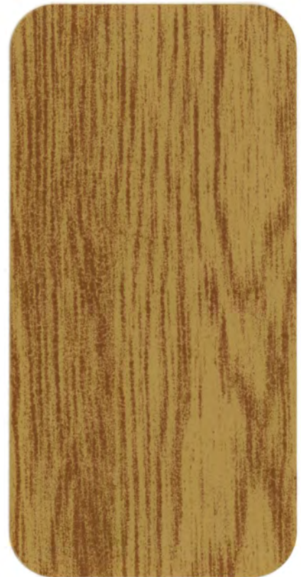
▶ HD 870 AMERICAN OAK