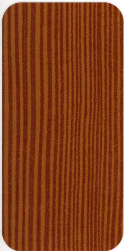
▶ DOUGLAS ANTICATO