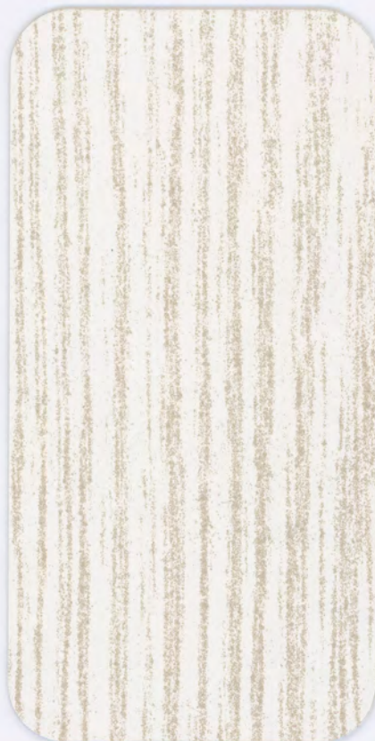
▶ HD 306 IVORY ASH