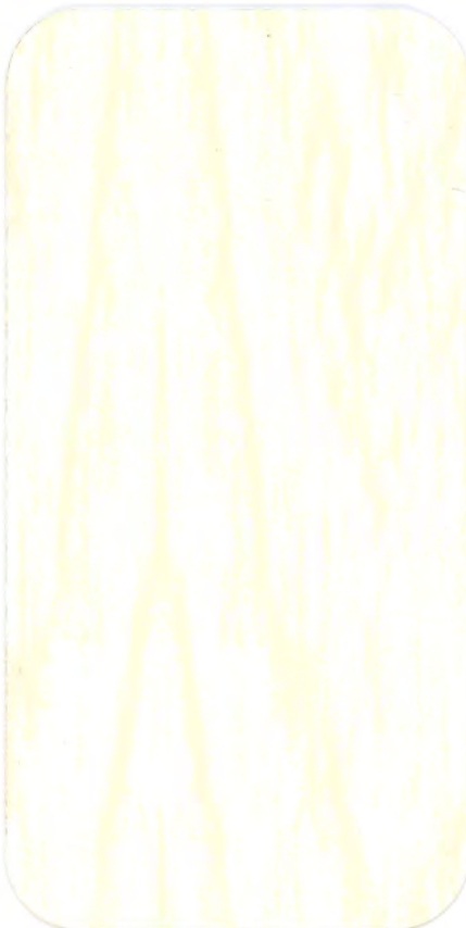
▶ WH 30 BIANCO EFFECTA