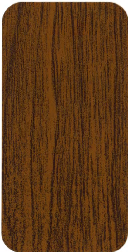
▶ N 632 NOCE REALE