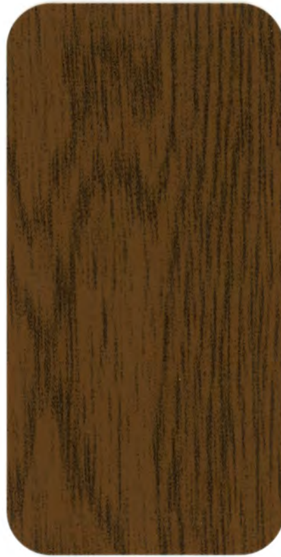
▶ R 811 RENOLIT SCURO