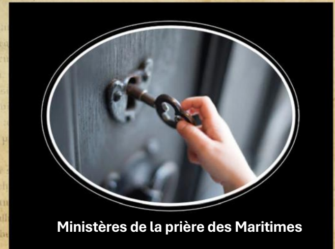
Ministères de la prière des Maritimes

Louez-le aujourd’hui pour Ses promesses!