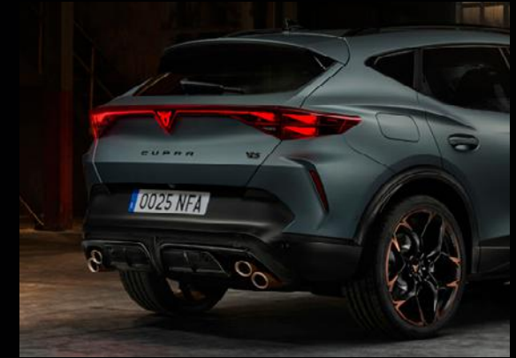
↑ CARBON HECKSPOILER MIT 4-ROHRIGER AUSPUFFANLAGE IN COPPER