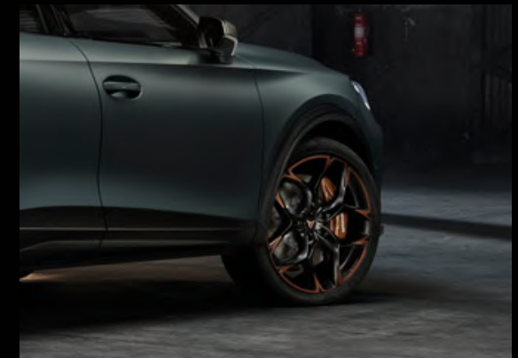
↑ 6-KOLBEN-BREMSSÄTTEL VON AKEBONO UND EXKLUSIVE 20-ZOLL LEICHTMETALLFELGEN IN COPPER