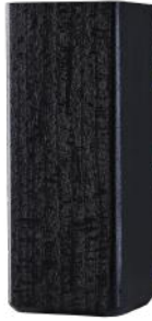
EG (SORT) 60X60 MM