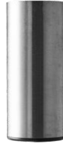
BØRSTET STÅL Ø60 MM