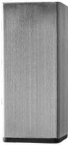
BØRSTET STÅL 60X60 MM

Alle træben fås i bøg, eg og valnød. Benene kan både placeres i arm eller indtrukket. Overflade efter ønske. Specialhøjde kan tilbydes mod tillæg.