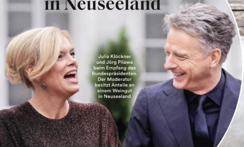
Julia Klöckner und Jörg Pilawa beim Empfang des Bundespräsidenten. Der Moderator besitzt Anteile an einem Weingut in Neuseeland

JÖRG PILAWA Exklusiv! Traumhaftes Anwesen in Neuseeland