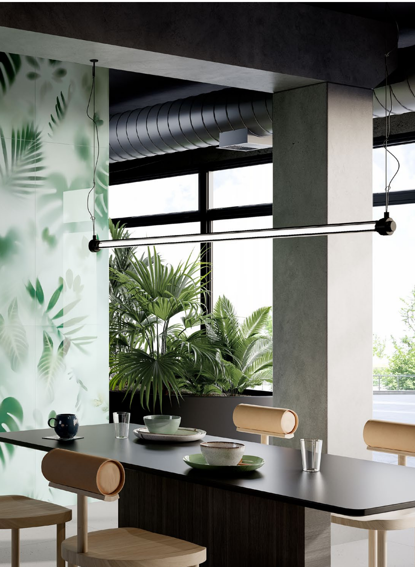
FIG. RAINFOREST 2023