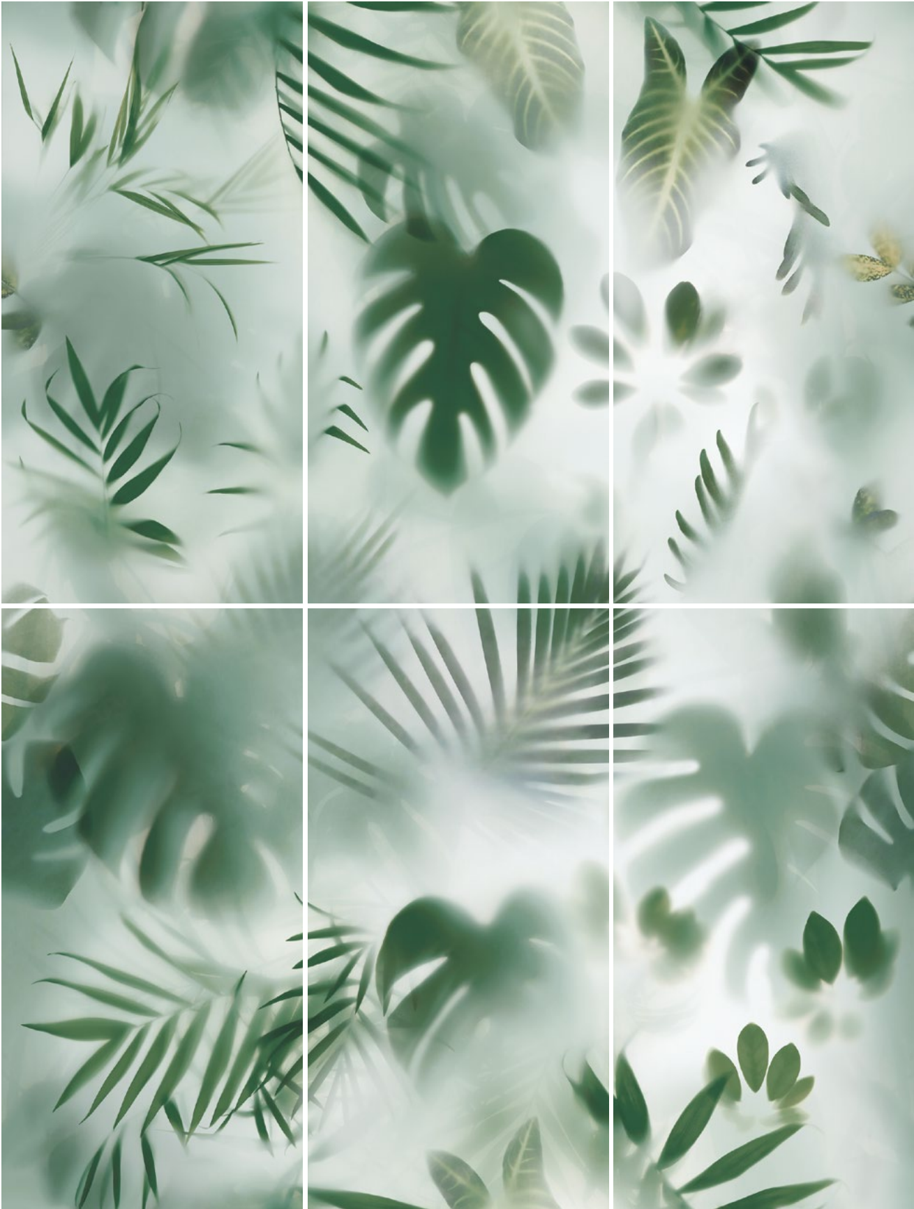
FIG. RAINFOREST 2023