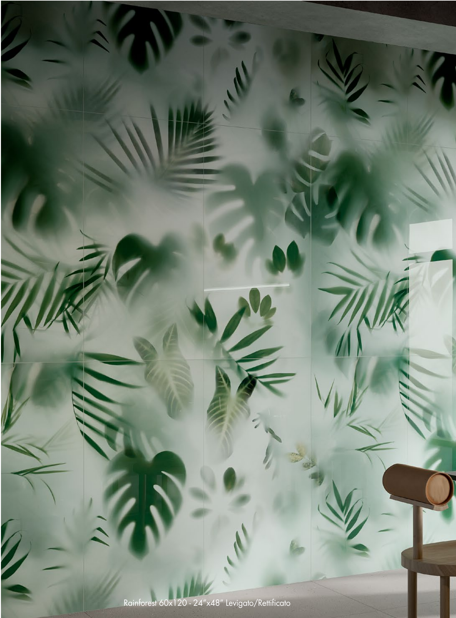
Rainforest 60x120 - 24"x48" Levigato/Rettificato