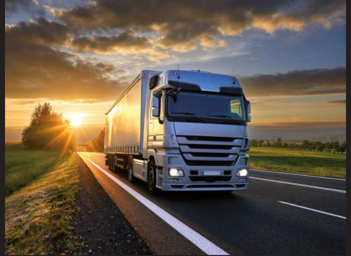
VAJ MOTORI CARGO