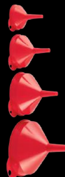
Art. N° 0891400/1/2/3 Art. N° 0891400/100/200 Gota dozuese për vaj