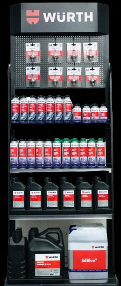
Art. N° 1961897 RAFT VAJI