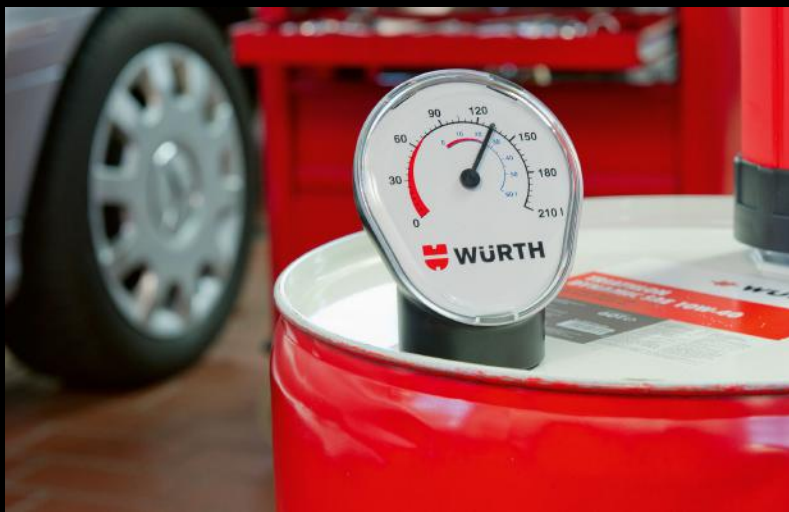
Art. N° 0891 620 001 Tregues i nivelit të mbushjes

Përveç vajrave cilësore, Würth ofron edhe gamë të gjerë të aksesorëve për punë më të lehtë në servis.