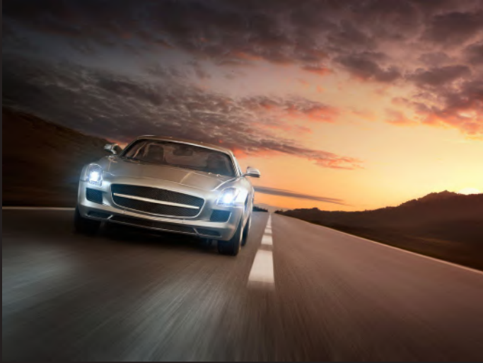
VAJ MOTORI PËR MAKINA