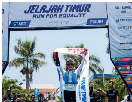
Pelari yang menuntaskan misi berlari sejauh 108 Km demi membantu pengadaan akses air bersih di NTT.

setidaknya 7 kota juga turut berlari secara serentak di kotanya masing-masing untuk mendukung lari amal ini. Semua pelari dan komunitas yang berpartisipasi melakukan kegiatan fundraising melalui crowdfunding platform, dan berhasil mengumpulkan dana sebesar Rp 2.015.123.708. Capaian ini melebihi target yang ingin dicapai, sehingga dari rencana membangun sarana air bersih dan edukasi tentang sanitasi di tiga desa, sekarang menjadi empat desa yang akan mendapatkan manfaatnya.