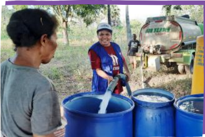
Lebih dari satu juta liter air bersih disalurkan ke 570 keluarga untuk mengatasi dampak kekeringan ekstrim di Kabupaten Lembata, Nusa Tenggara Timur.