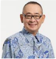
Ritsuo Fukadai CEO J Trust Bank

“ Kami mengapresiasi program-program yang dilakukan oleh Plan Indonesia sebagai program-program pemberdayaan masyarakat yang berkelanjutan. Terlebih lagi, Plan Indonesia kerap melakukan kolaborasi dengan berbagai pihak baik pemerintah maupun swasta dalam menjalankan program-programnya.