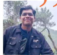
Aditya Putrama Dearman Garingging F2F Fundraiser Plan Indonesia

Harapan saya Plan Indonesia bisa jauh lebih baik kedepannya, berkembang kearah positif dan lebih berdampak secara luas untuk Indonesia dan global.