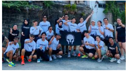
Pelari dari komunitas RIOT Banjarmasin melakukan aksi lari serentak untuk mendukung lari amal Jelajah Timur.

Berbagai inisiatif publik untuk mendukung penggalangan dana juga bermunculan, seperti charity yoga, penjualan jersey edisi spesial terbatas, dan kelas koreografi. Hal ini menunjukkan tingginya dukungan masyarakat untuk menyukseskan program ini. Kegiatan lari virtual juga dilakukan