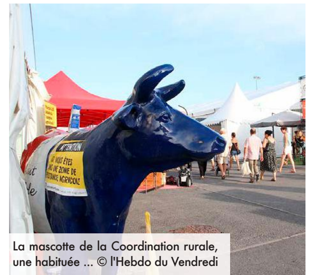
La mascotte de la Coordination rurale, une habituée ...