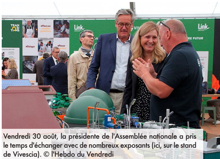
Vendredi 30 août, la présidente de l'Assemblée nationale a pris le temps d'échanger avec de nombreux exposants (ici, sur le stand de Vivescia).