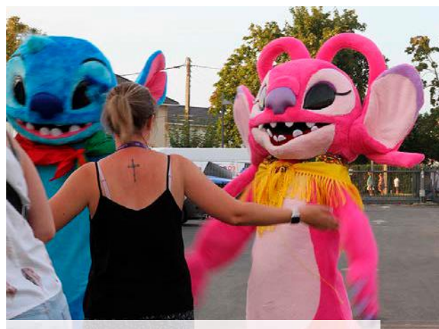
Les mascottes arpentent les allées de l'événement.