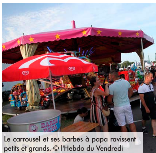
Le carrousel et ses barbes à papa ravissent petits et grands.