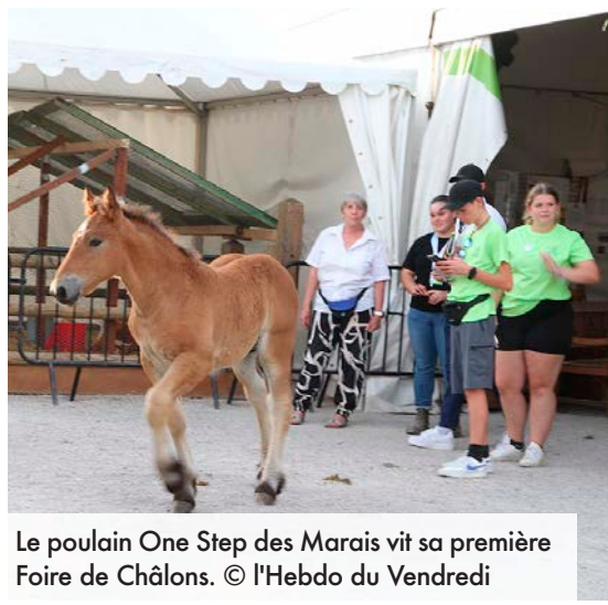
Le poulain One Step des Marais vit sa première Foire de Châlons.