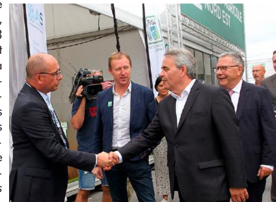
Un temps d'échange avec les acteurs agricoles et viticoles était au programme.

Xavier Bertrand se rend chaque année sur la Foire de Châlons, sa ville natale. Mais ce mardi 3 septembre, sa visite a suscité un intérêt tout particulier des médias quant à sa possible nomination au poste de Premier ministre. Au même moment, Emmanuel Macron rencontrait les responsables LR et d'autres groupes politiques pour leur soumettre cette hypothèse. La veille déjà, le président de la République s'était entretenu avec Xavier Bertrand à ce sujet. « Ce n'est pas à moi d'en parler, je ne ferai aucun commentaire là-dessus, a répondu le président LR des Hauts-de-France, interrogé sur cet échange à l'Élysée. Je viens ici comme président de région tous les ans, il n'y a rien de changé. »