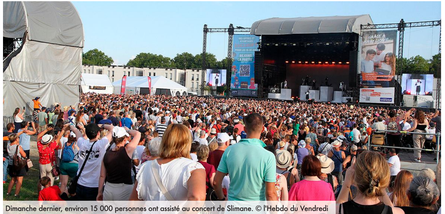
Dimanche dernier, environ 15 000 personnes ont assisté au concert de Slimane.

Le dimanche 8 septembre, à 17 h, c'est un autre habitué de ville-préfecture qui fera le show : Patrick Bruel . En tournée partout en France avec son dixième album studio, « Encore une fois », sorti fin 2022, mais