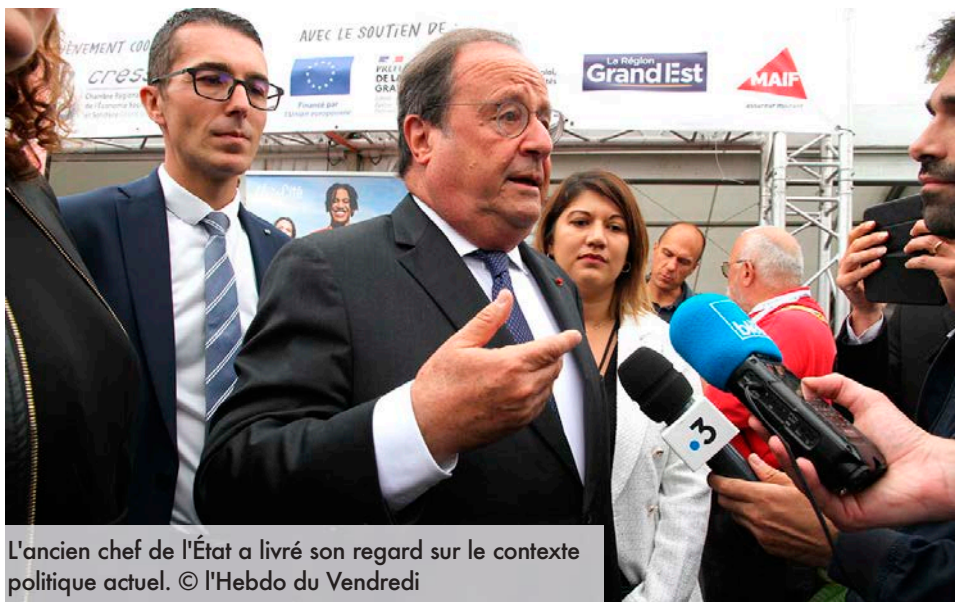
L'ancien chef de l'État a livré son regard sur le contexte politique actuel.

Habitué de l'événement, l'ancien président de la République François Hollande, réélu député socialiste de Corrèze, n'a pas coupé le ruban de la Foire, mais celui du village de l'économie sociale et solidaire. L'occasion d'échanger avec l'ensemble des acteurs marnais, lui qui n'écarte pas une nouvelle candidature à l'élection présidentielle.