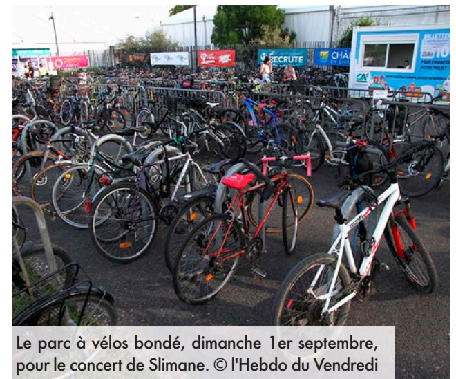
Le parc à vélos bondé, dimanche 1er septembre, pour le concert de Slimane.