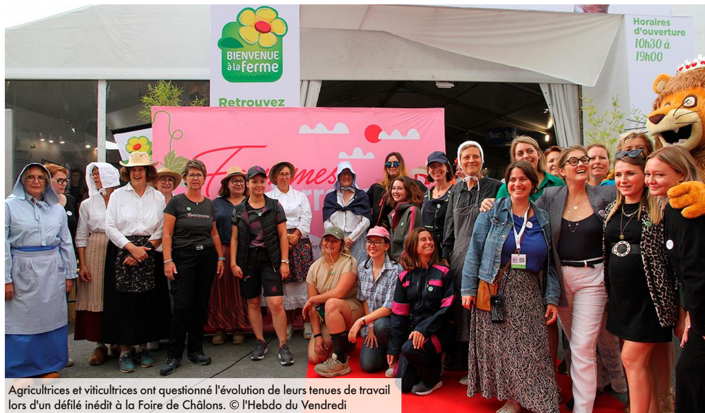
Agricultrices et viticultrices ont questionné l'évolution de leurs tenues de travail lors d'un défilé inédit à la Foire de Châlons.