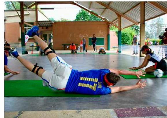
Les participants ont notamment pu découvrir et tester le torball.

Alors que les Jeux paralympiques battent leur plein à Paris, l'institut Michel-Fandre, qui accompagne 2 000 enfants et adultes en situation de handicap ou de vulnérabilité dans la Marne, organisait, mercredi, ses propres olympiades sur son site rémois. Les participants, enfants et adultes, atteints de handicap ou non, ont pu tester plusieurs activités en situation de cécité, tels le parcours d'obstacles, le lancer de vortex, la pétanque, le cécifoot ou encore le torball.