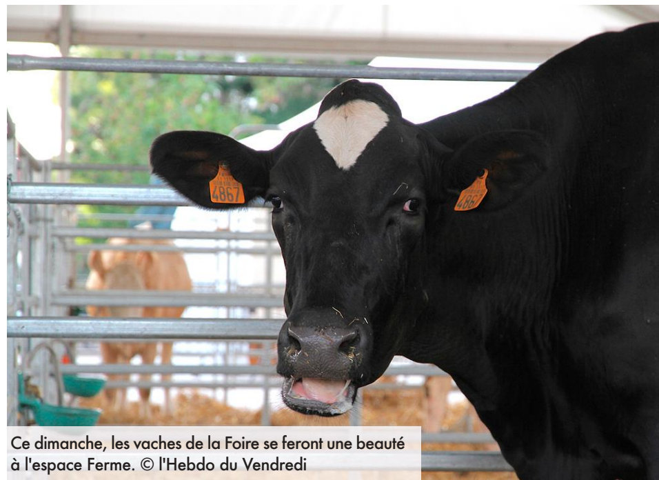
Ce dimanche, les vaches de la Foire se feront une beauté à l'espace Ferme.