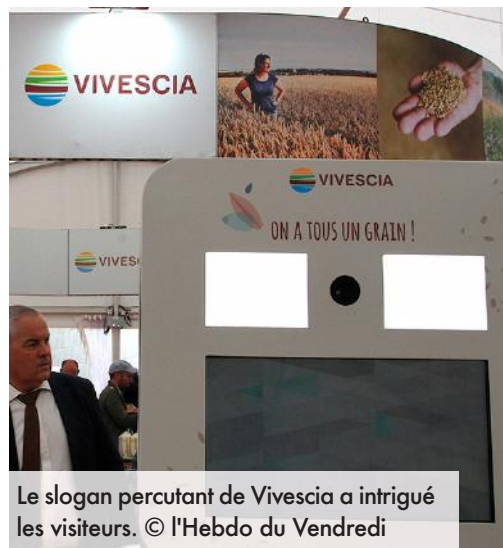
Le slogan percutant de Vivescia a intrigué les visiteurs.