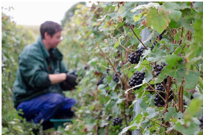
La qualité de la récolte pourrait être disparate, selon les secteurs.

Le moment tant attendu se rapproche pour les vignerons champenois. Les réunions se succèdent du côté du Comité Champagne et de l'Association viticole champenoise (AVC) afin d'affiner les premières tendances, qui fixaient le début de la récolte autour des 10 et 15 septembre. Les délégués régionaux de l'AVC se réunissent ce mardi pour faire remonter leurs relevés dans les 319 crus et préparer le ban de vendange, soit le