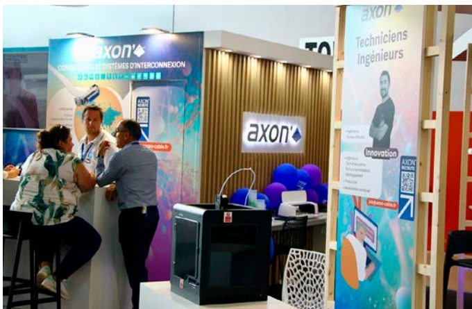
L'entreprise emploie 800 personnes sur son site de Montmirail.

C'est l'un des poids lourds mondiaux en son domaine qui expose depuis bien longtemps à la Foire de Châlons. Le fabricant de composants électroniques Axon'Cable, géant qui emploie plus de 2 500 personnes dans le monde, dont 800 sur son site de Montmirail, est présent en bonne place dans les allées du Capitole (hall 2) et ce pendant toute la durée de l'événement.