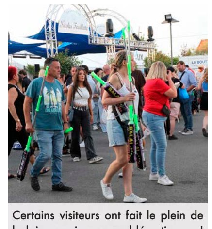
Certains visiteurs ont fait le plein de balais magiques, emblématiques !