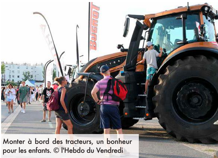
Monter à bord des tracteurs, un bonheur pour les enfants.