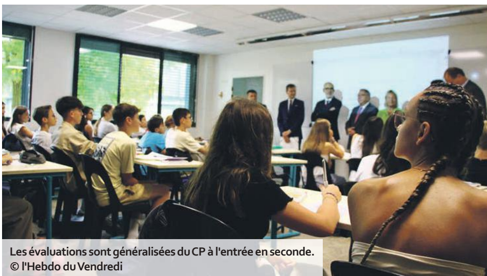
Les évaluations sont généralisées du CP à l'entrée en seconde.

L'académie de Reims, qui compte 17 143 enseignants, affiche des tailles de classes plutôt raisonnables. Ainsi, le nombre moyen d'élèves par classe est de 20,4 en maternelle, 20,8 en primaire, 25,3 au collège, 18,8 en lycée professionnel et 31,3 en