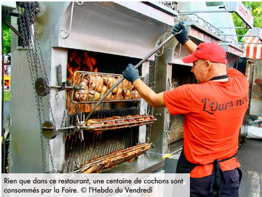
Rien que dans ce restaurant, une centaine de cochons sont consommés par la Foire.

Et le travail ne manque pas sous les barnums rouge et blanc de la brasserie itinérante, passée par les foires de Rouen (mars) et de Nancy (avril) ou encore la Fête des loges de Saint-Germain-en-Laye durant tout l'été. « À partir de 8 h 30, on allume les rôtissoires, on épluche les patates, on dresse les tables, énumère la gérante. Tous les matins, on est livré en cochons provenant d'une ferme de Troyes, en fruits et légumes d'un primeur de Saint-Memmie et de pommes de terre d'un pro-