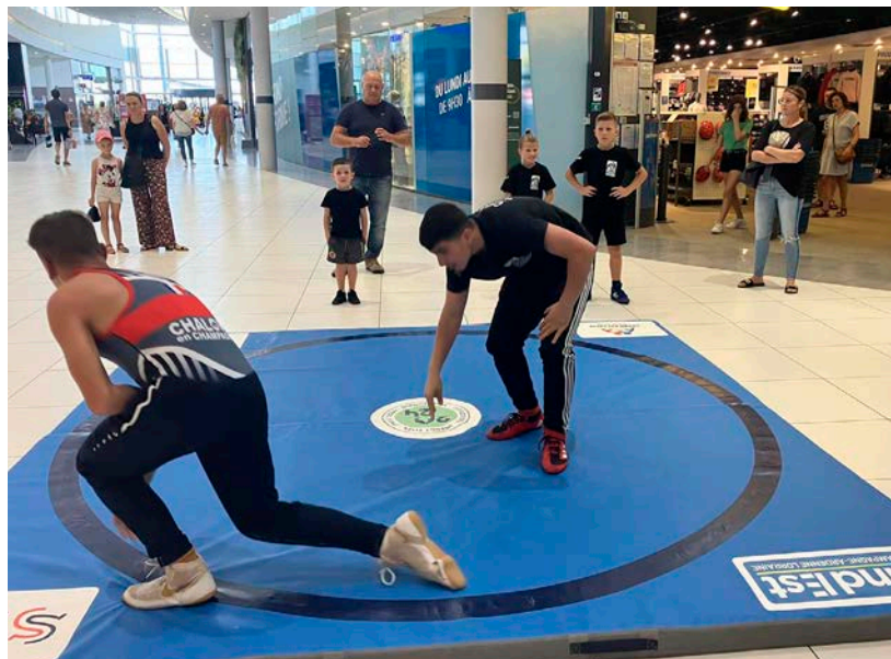
Comme chaque année, les démonstrations des bénévoles rythmeront le forum.

Les bénévoles de plus d'une trentaine de structures animeront leurs stands respectifs dans des domaines aussi variés que la culture, le sport, les loisirs, la prévention, l'environnement, etc. La journée de samedi sera ponctuée de nombreuses démonstrations et initiations, autour de la danse par exemple, des gestes qui sauvent, du roller, de la gymnastique rythmique, du BMX ou encore du body karaté. À ne pas manquer également : le départ d'un running « pour tous » (à 10 h samedi, côté extérieur près de la cafétéria), les maquettes de trains et de réseaux ferroviaires des Modélistes châlonnais (sur deux jours) et la bouquinerie solidaire de Lire et délire en stock (samedi). L'occasion rêvée, pour le grand public, de se renseigner et se laisser tenter par une nouvelle activité cette année : basket féminin, escrime, jeux de société, yoga, radio, zumba, lutte, etc. Liste non exhaustive !