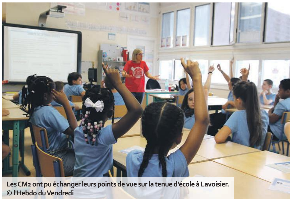
Les CM2 ont pu échanger leurs points de vue sur la tenue d'école à Lavoisier.

Beaucoup ont pris la pose pour immortaliser le moment et les cartables flambant neufs avant de rejoindre leurs classes, guidés par les instituteurs eux-mêmes vêtus d'un tee-shirt aux couleurs de Lavoisier. De quoi marquer la nouveauté de cette année : les tenues d'école, expérimentées jusqu'en juin 2026. Les élèves portent donc désor-