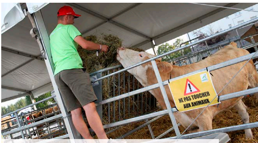
Repas bien mérité pour les vaches de l'espace Ferme après une grosse journée au contact des visiteurs.