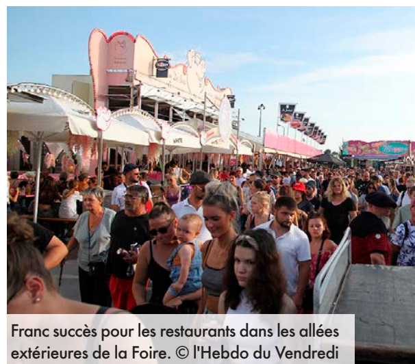
Franc succès pour les restaurants dans les allées extérieures de la Foire.