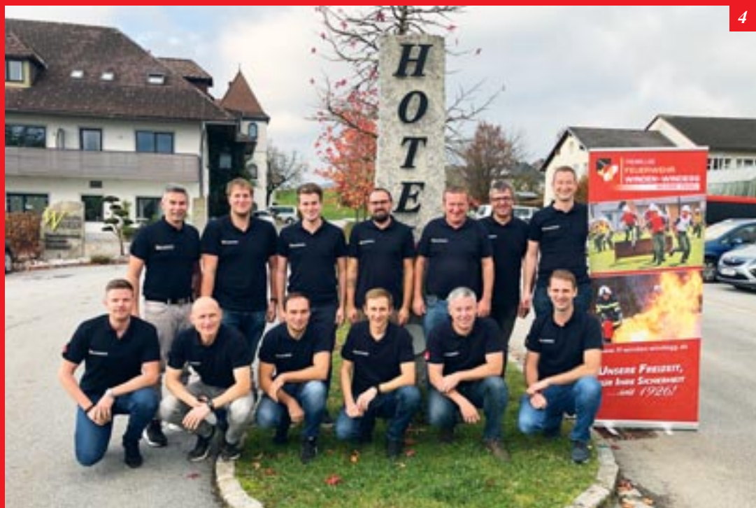
4) Kommandoklausur in Neustift im Mühlkreis