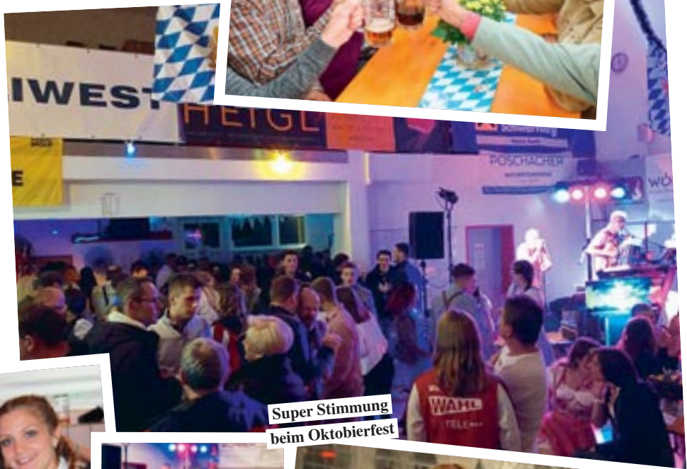
Super Stimmung beim Oktoberfest