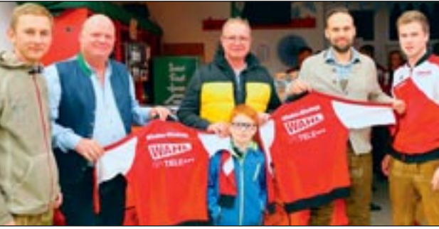
Unsere großzügigen Unterstützer der Wettkampfgruppen