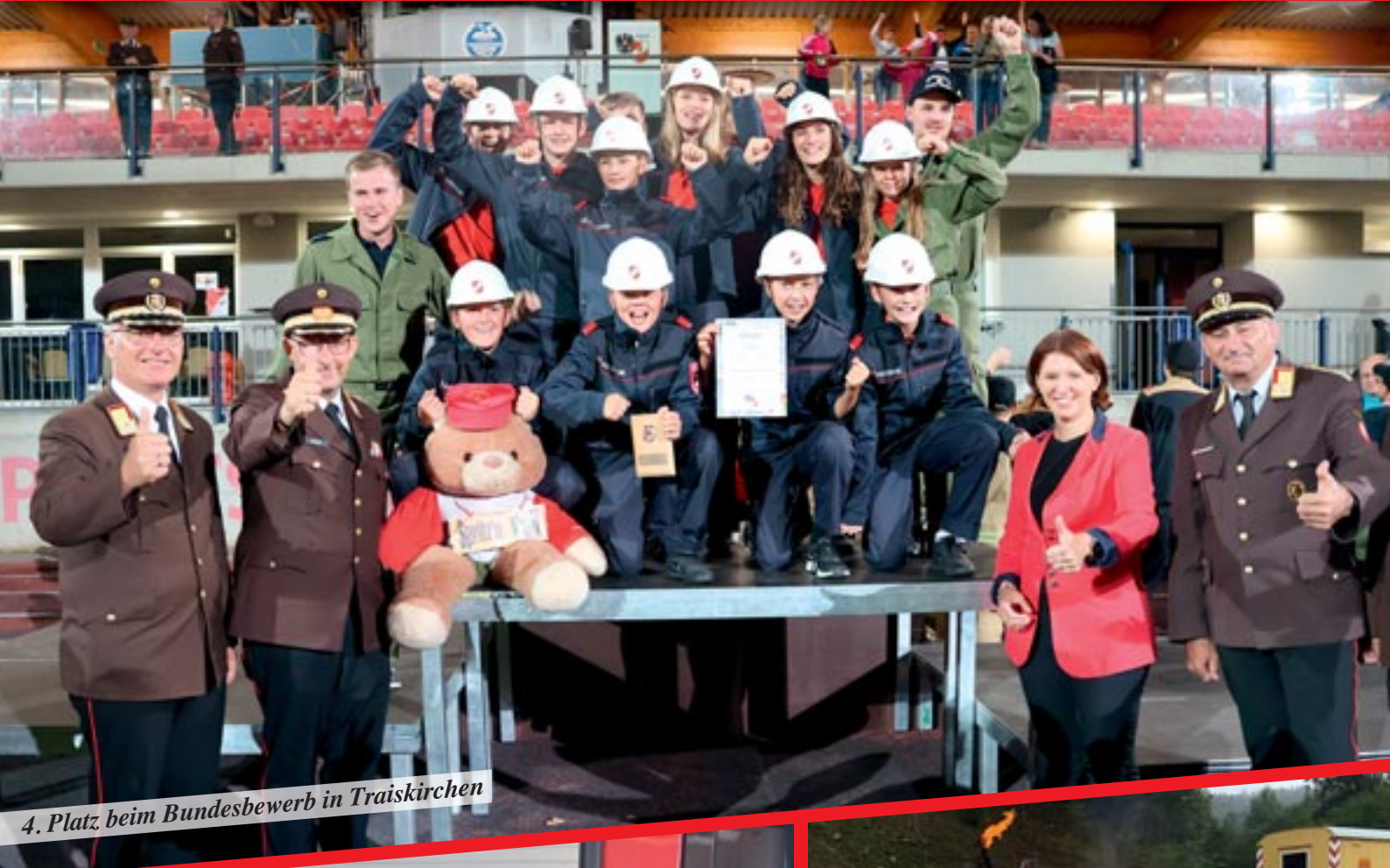
4. Platz beim Bundesbewerb in Traiskirchen