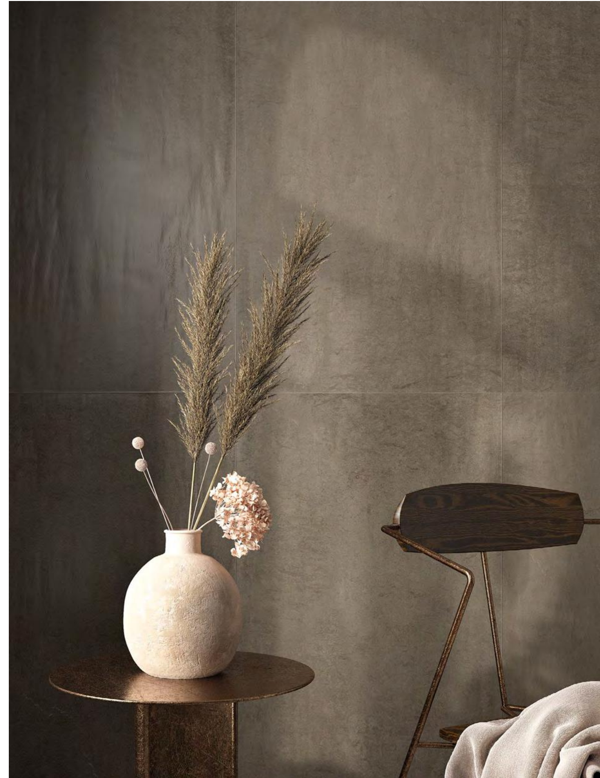
Foussana Gray Satin 60x120 / 23,6"x47,2" > Foussana Sand Satin 60x120 / 23,6"x47,2" - Sand Satin 7,5x30 / 2,9"x11,8"