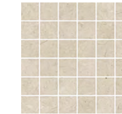
30x30 - 11,8"x11,8" 6000068 THALA satin 13 ▲