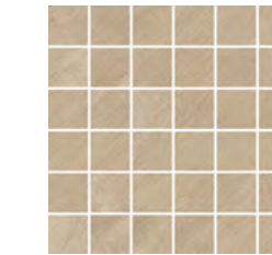
30x30 - 11,8"x11,8" G204190 SAND satin 13 ▲