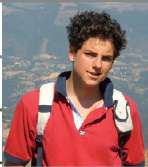
Beato Carlo Acutis

"Ya llega el Señor, el rey de la gloria". Mt 1, 18-24