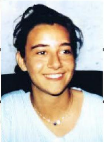
Beata Chiara Luce Badano

"...los ciegos ven, los cojos andan, los leprosos quedan limpios de la lepra, los sordos oyen, los muertos resucitan y a los pobres se les anuncia el Evangelio. Mt 11, 2-11