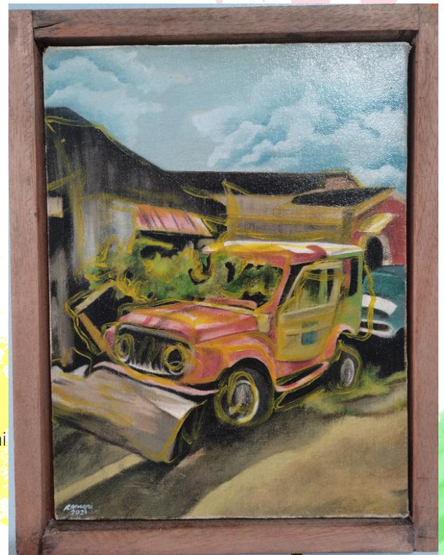
Oil in Canvas by Roxan Musni