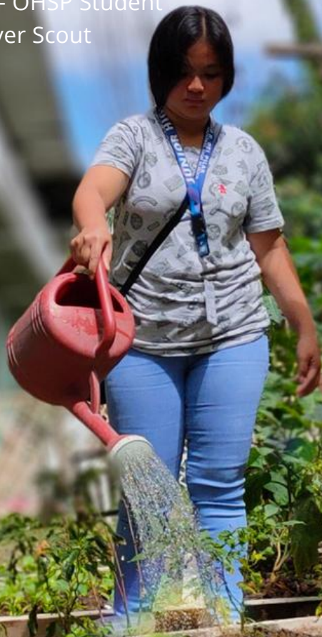
OHSP Community Garden