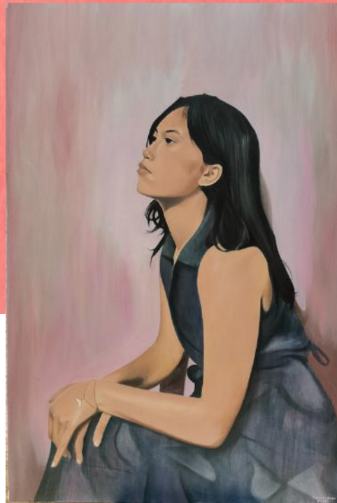
Oil in Canvas by Roxan Musni

Hindi palaging payapa ang buhay Minsan ibinibigay sa atin ang mga butas ng buhay para pagpakuan ng ating mga kulang sa pundasyon sa pag harap sa tunay na buhay.