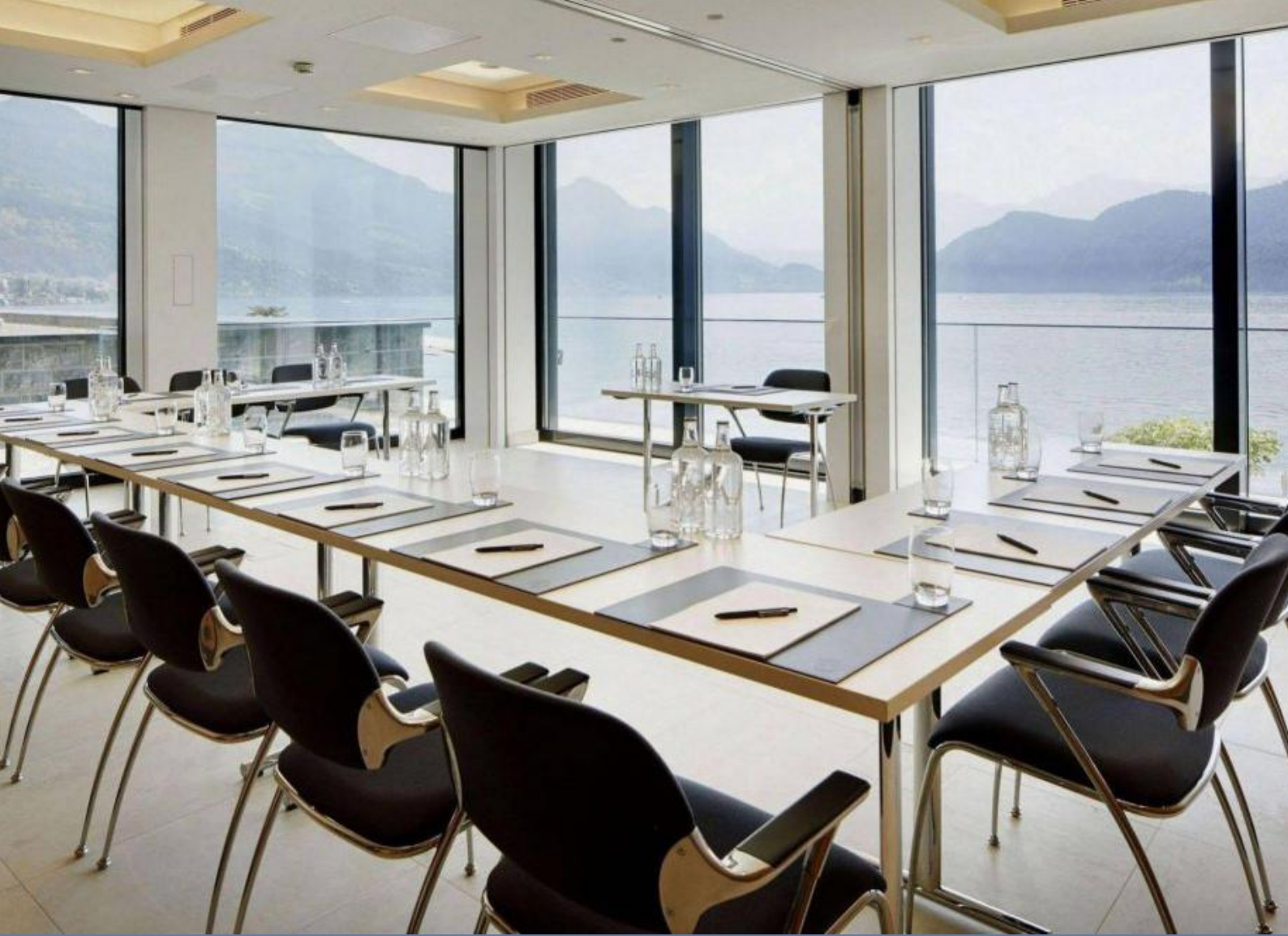
Campus Hotel Hertenstein, Weggis