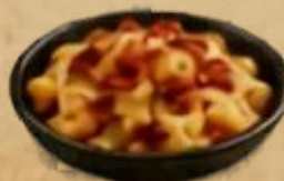
Ranchero (queso y tocineña)