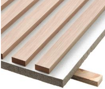
» Lys eg på hvid mineraluldsplade