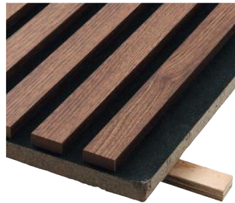
» Røget eg på sort mineraluldsplade