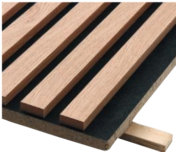
» Mat eg på sort mineraluldsplade