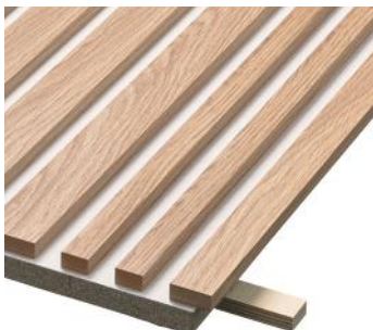
» Eg på hvid mineraluldsplade