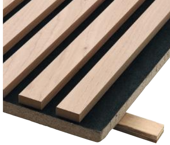
» Lys eg på sort mineraluldsplade