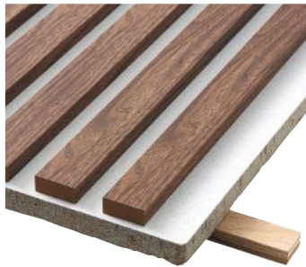
» Røget eg på hvid mineraluldsplade