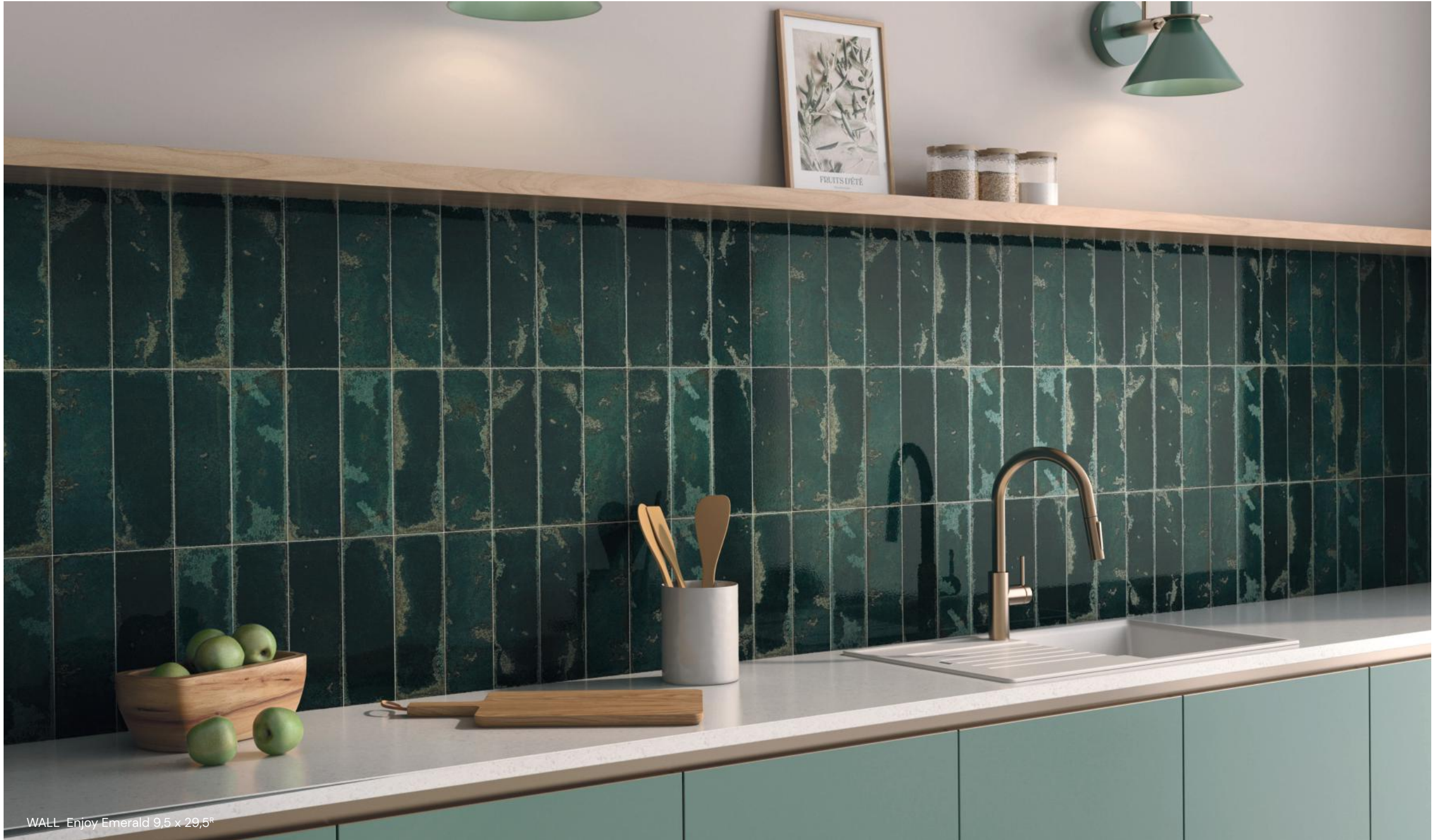
WALL Enjoy Emerald 9,5 x 29,5 ®