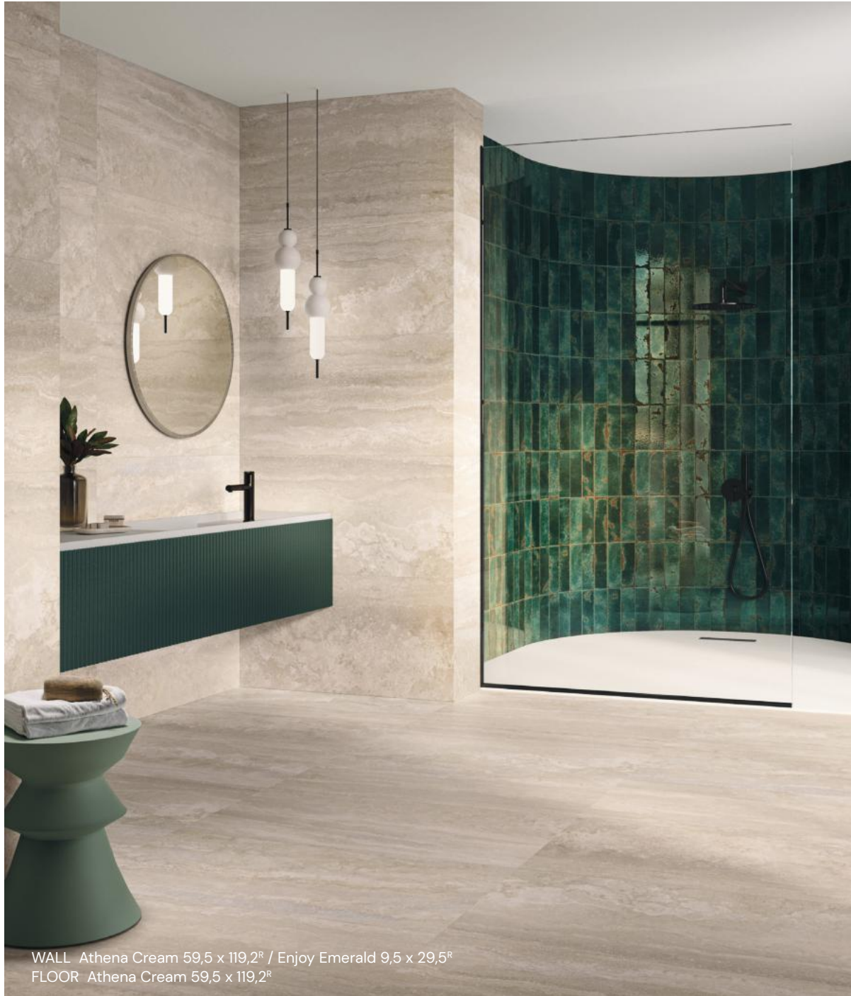
WALL Athena Cream 59,5 x 119,2 R / Enjoy Emerald 9,5 x 29,5 R FLOOR Athena Cream 59,5 x 119,2 R