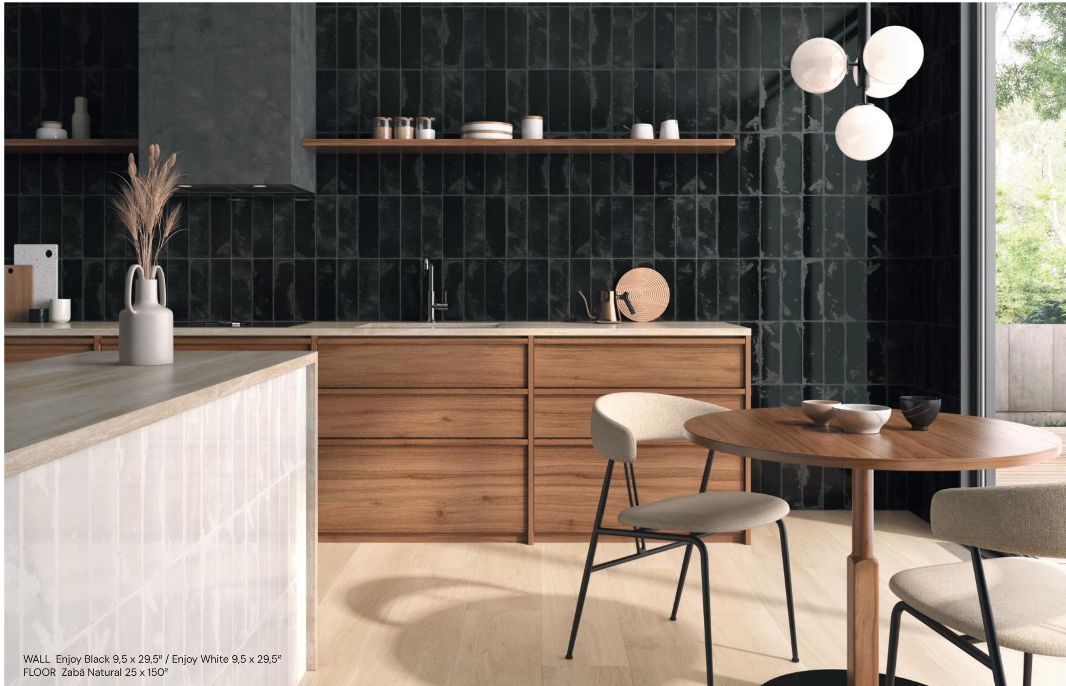
WALL Enjoy Black 9,5 x 29,5 R / Enjoy White 9,5 x 29,5 R FLOOR Zabà Natural 25 x 150 R