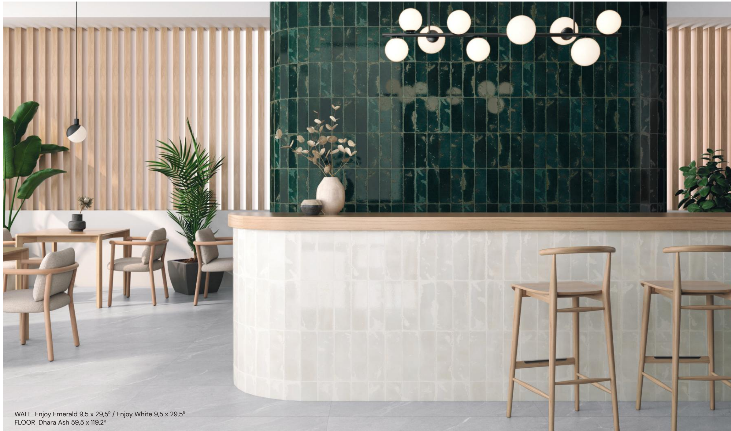
WALL Enjoy Emerald 9,5 x 29,5 R / Enjoy White 9,5 x 29,5 R FLOOR Dhara Ash 59,5 x 119,2 R