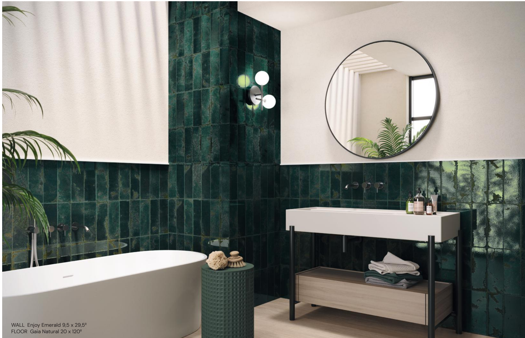
WALL Enjoy Emerald 9,5 x 29,5 R FLOOR Gaia Natural 20 x 120 R