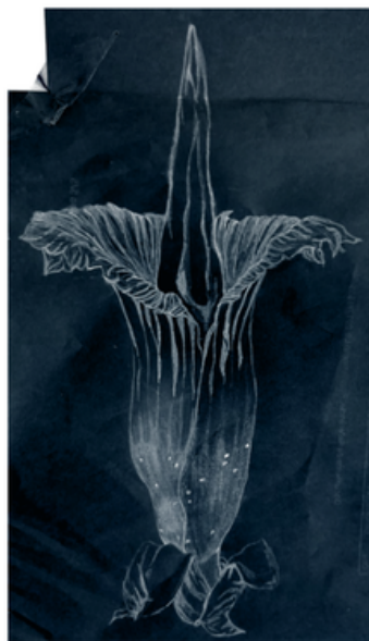
Amorphophallus titanum, conhecida pelo nome 'flor-cadáver'!

Aquando da floração, exala um forte odor nauseabundo de carne podre que atrai insetos polinizadores, como moscas e besouros, que normalmente buscam alimento em ambientes putrefatos.