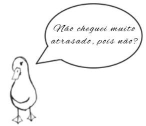
“O Oitavo Pato”