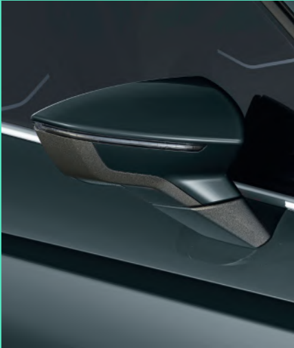
FIORD BLUE ohne Aufpreis