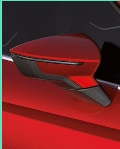
DESIRE RED metallic Fr. 1'200.–