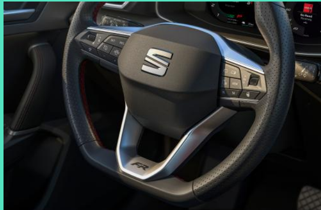
Ledermultifunktionslenkrad mit Schaltwippen