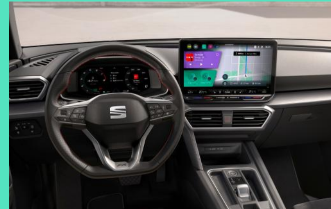
Interieur mit Dinamica Sitzen und 10.4" Display inkl. SEAT FullLink