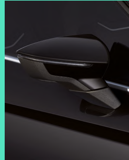
MIDNIGHT BLACK metallic Fr. 800.–