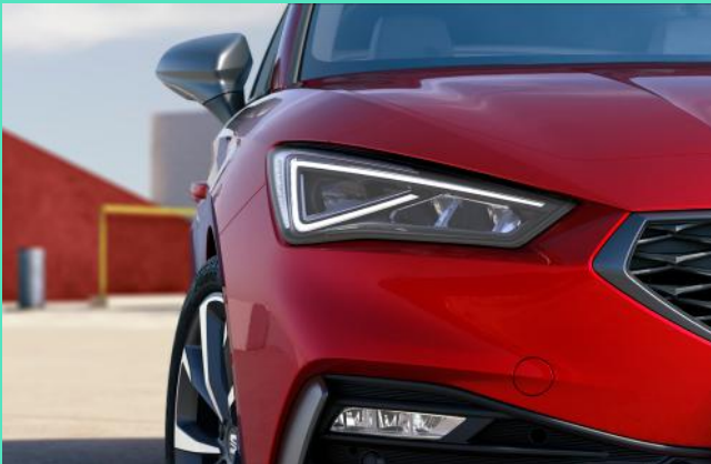
LED Tagfahrlicht und Matrix-LED Scheinwerfer