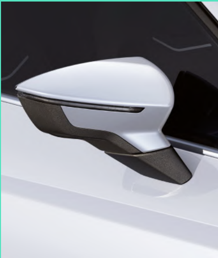
GLACIAL WHITE metallic Fr. 800.–