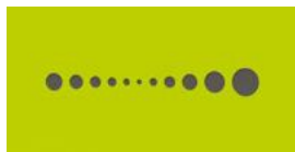
F - Les formes géométriques gravées