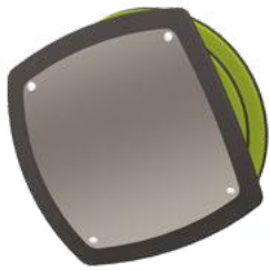
A - Le miroir convexe pivotant

(Elles sont aussi disponibles sur les modules de jeux de la série J3. Enrichissez votre futur bloc psychomoteur de ces éléments ludiques uniques.)