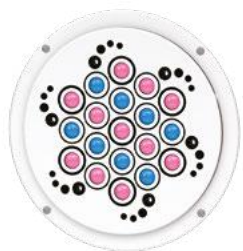
I - Les billes multitextures