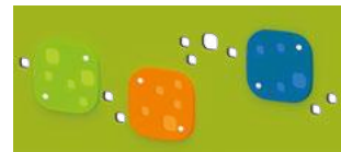
D - Les judas colorés