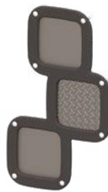
G - Les miroirs multitextures