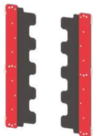
J - Les murets flexibles