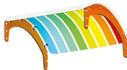
K - La voûte arc-en-ciel