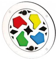
B - Le kaléidoscope