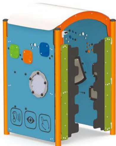
Tunnel court (L-22000-A et L-22000-B)