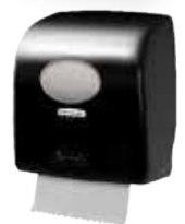
AQUARIUS* Rolhanddoek Dispenser SLIMROLL* Wit (7955), Zwart (7956)