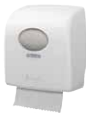
AQUARIUS* Rolhanddoek Dispenser Wit (7375), Zwart (7376)

De compacte dispenser die in één handeling te reinigen is