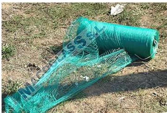
Presentación rollo de malla antihierbas ancho 4 m