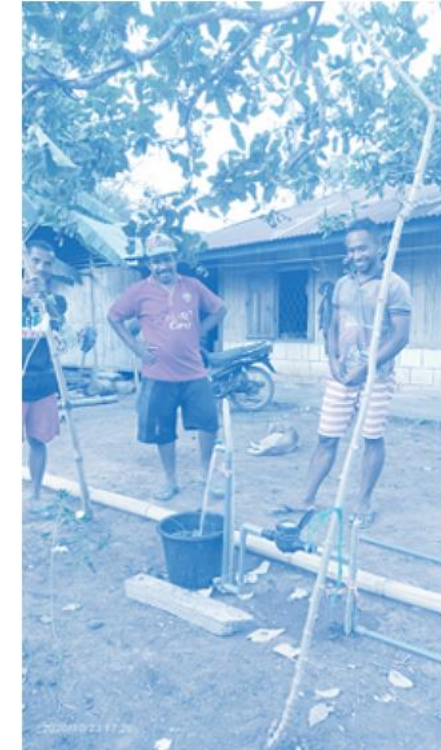
Air telah sampai ke rumah warga