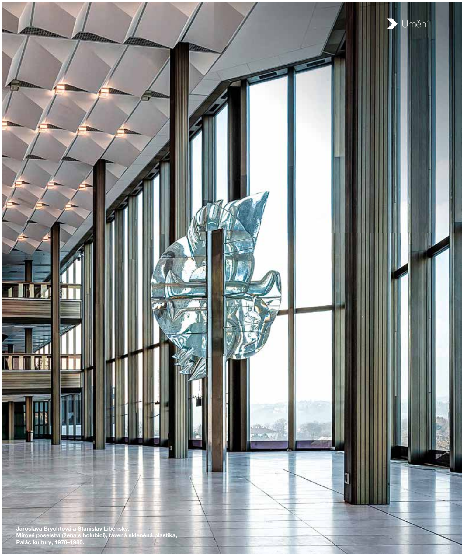
Jaroslava Brychtová a Stanislav Libenský, Mírové poselství (žena s holubicí), tavená skleněná plastika, Palác kultury, 1978–1980.