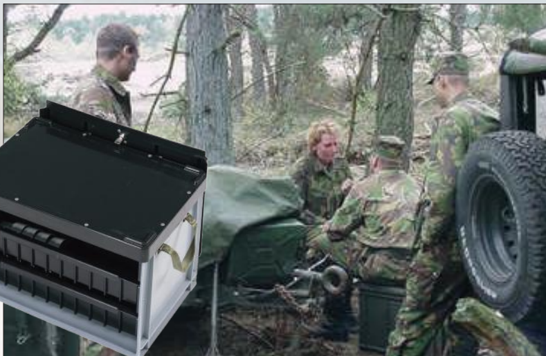
EHBO-koffer voor eerstelijnsgebruik.

Interieur met inschuifbare verdelers en een deksel met neopreen afdichting. Ontworpen voor administratieve taken in het veld.