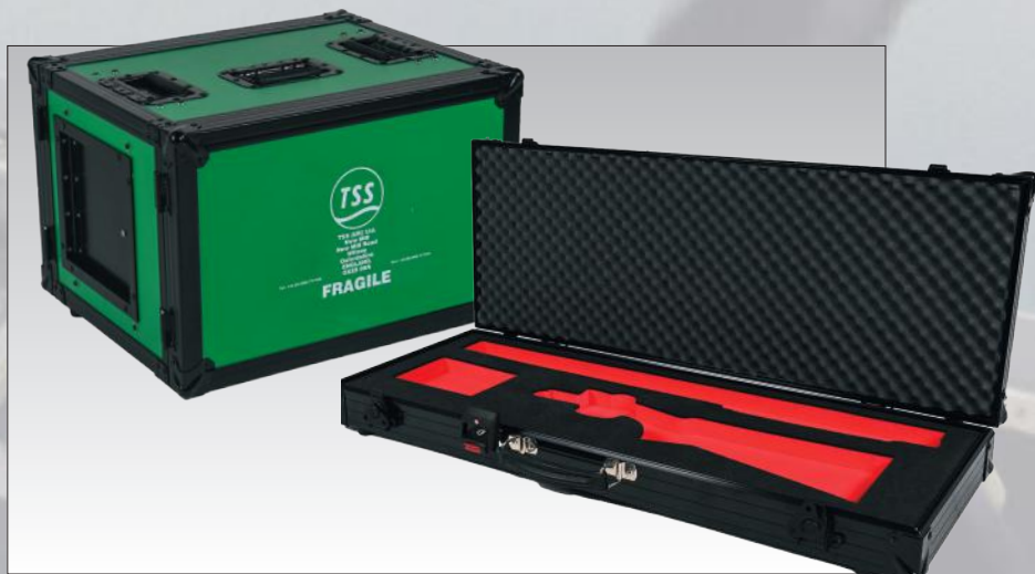
Klassieke flightcases, met een extra dimensie: meerkleurig schuim en zwarte accessoires.

De ATA (Air Transport Association) specificatie 300 wordt in de VS vaak als standaard voor koffers gebruikt. In Europa en de VS gelden verschillende DEF STAN- en MIL-SPEC-normen voor het transport van goederen voor militaire toepassingen. Ons ontwerpteam is goed op de hoogte van deze normen en zorgt ervoor dat onze koffers hieraan voldoen waar nodig.