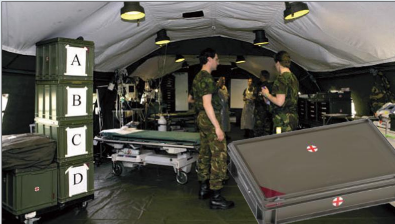
Normbox™ euronorm bak in een veldhospitaal. Niet alleen voor verbanden, maar ook voor flessen met lachgas.

Veldhospitaal en medische ondersteuning vereisen eveneens een aanzienlijke hoeveelheid verpakkingen. In vredetijd bouwen we onze voorraad op. Wanneer nodig, moeten verbanden, medicijnen en verdovingsmiddelen in grote hoeveelheden ter plaatse beschikbaar zijn, in goede staat en gemakkelijk toegankelijk. Engels Group kan opnieuw terugvallen op een schat aan ervaring. Op deze pagina vindt u een selectie van projecten uit ons portfolio.