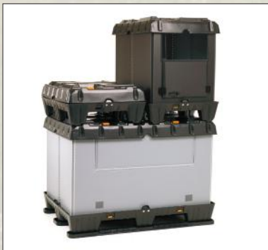
Wij leveren Lightpack™ Pro opzetranden ook op maat.