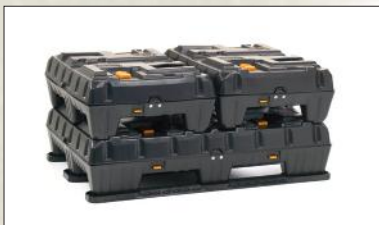
Lightpack™ pro modular, afmetingen 1200x800 mm en 800x600 mm.

Wij bieden twee varianten opvouwbare palletboxen aan. Voor bulkgebruik adviseren wij onze klassieke Lightpack™, waarbij lege pallets en deksels apart gestapeld worden voor transport. Voor herbruikbare transportverpakkingen (RTP) bieden wij de Lightpack™ Pro aan, waarbij pallet, wanden en deksel als één geheel blijven wanneer de container leeg is.