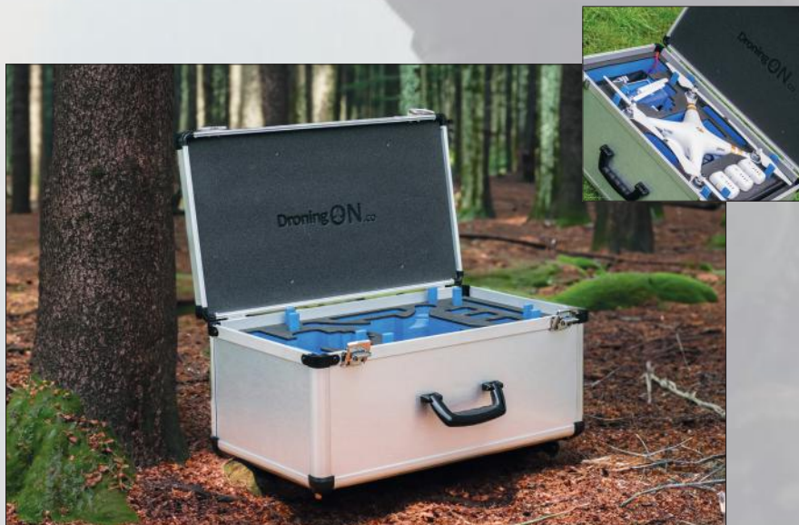
Protechnic Smartcase™ met een lichte drone erin.

Onze Protechnic Smartcases™ zijn in feite „lichte flightcases“. Ze bieden dezelfde flexibiliteit in ontwerp, maar met een slanker profiel en zijn eenvoudiger te dragen. Voor grotere producten waarbij stapelen noodzakelijk is voor opslag of transport, ontwerpen en produceren wij ook standaard flightcases. Naast opties zoals gekleurde of bedrukte panelen van stevig honingraatkunststof, leveren wij optioneel zwarte profielen en RVS handgrepen.