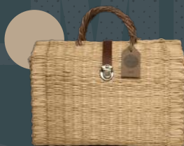
Cesta de Junco