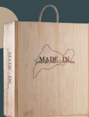
Caixa de Madeira