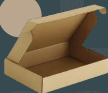
Caixa de Cartão