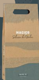
Caixa de Cartão

Exclusivas para Vinhos da Seleção MACIÇO