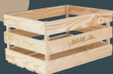
Caixa de Madeira