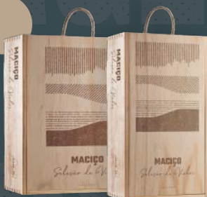
Caixa de Madeira