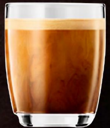
Café con Leche