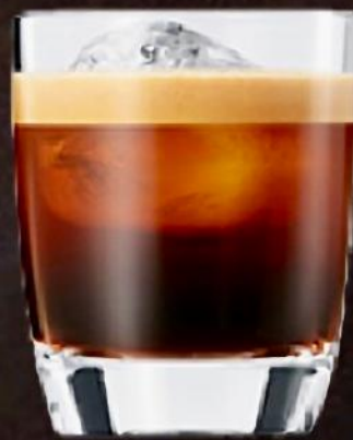
solo con Hielo