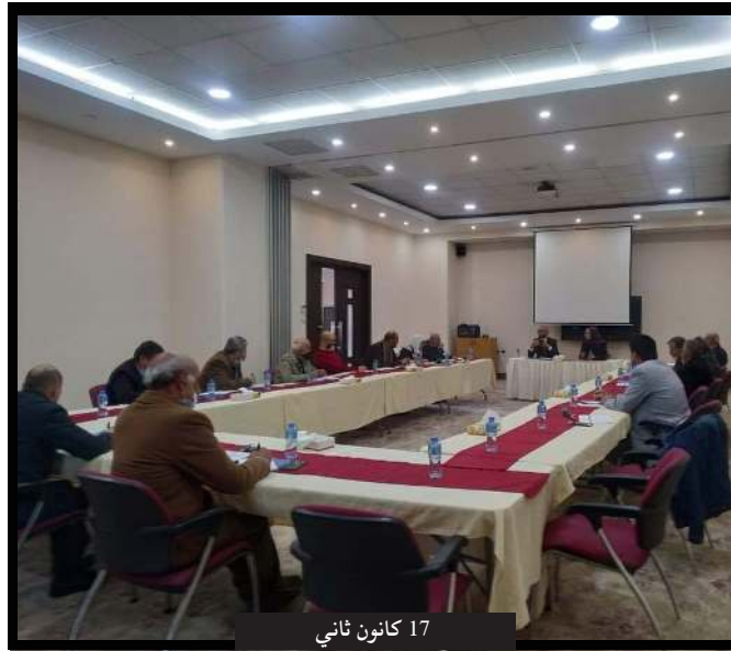
17 كانون ثاني

رئيس لجنة الانتخابات يلتقي مع ممثلي الأحزاب والفصائل الوطنية واطلعمهم على مواعيد وترتيبات العملية الانتخابية .