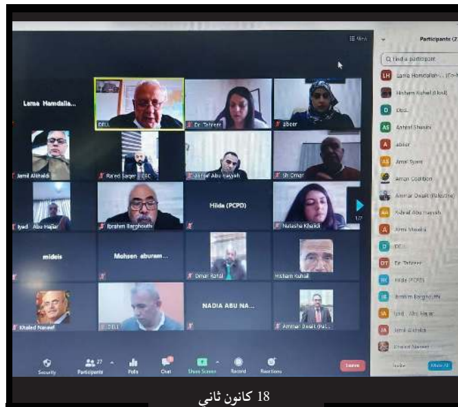
18 كانون ثاني

رئيس لجنة الانتخابات يلتقي مع ممثلي الأحزاب والفصائل الوطنية واطلعمهم على مواعيد وترتيبات العملية الانتخابية .