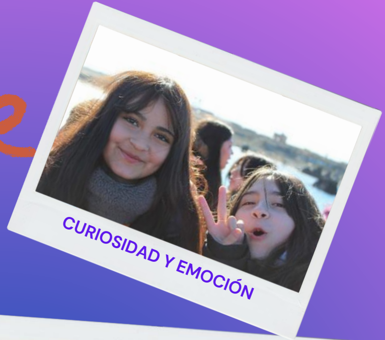
CURIOSIDAD Y EMOCIÓN