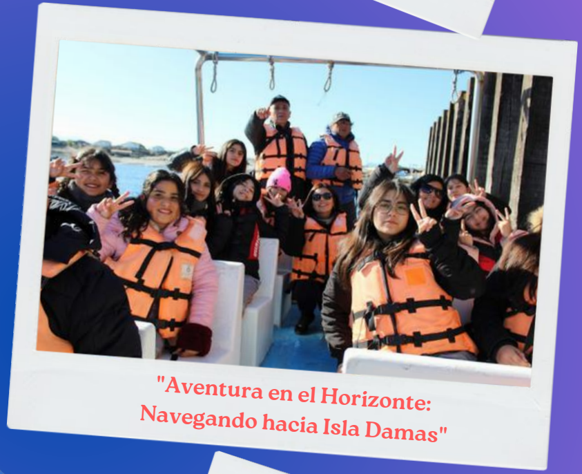
"Aventura en el Horizonte: Navegando hacia Isla Damas"

Con sonrisas en sus rostros, los estudiantes exploran el entorno, hacen preguntas curiosas y se involucran en las actividades que complementan lo aprendido en el aula.