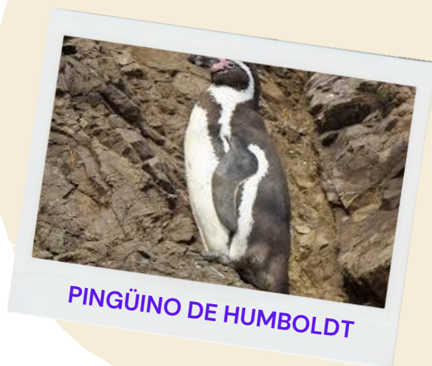
PINGÜINO DE HUMBOLDT