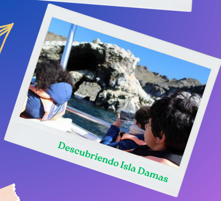
Descubriendo Isla Damas