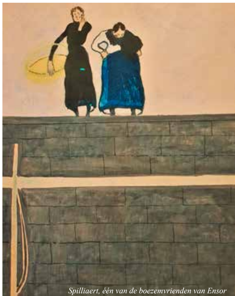
Spilliaert, één van de boezemvrienden van Ensor