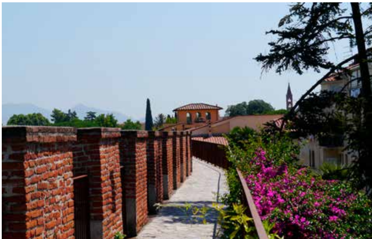
△ Les remparts de Pise