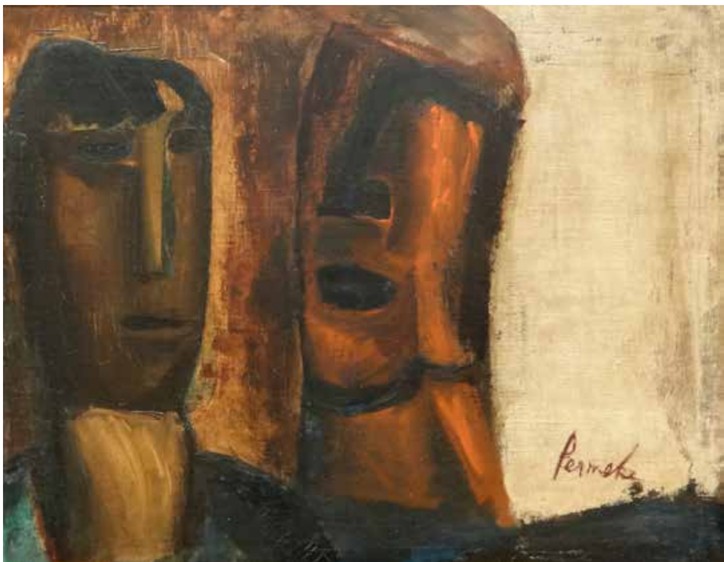
Peermacke ten voete uit

Ensor: zeer waarschijnlijk zijn bekendste werk