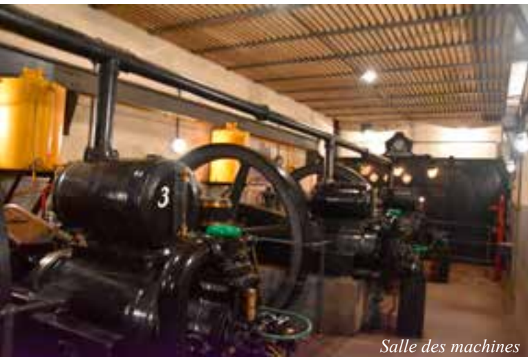
Salle des machines