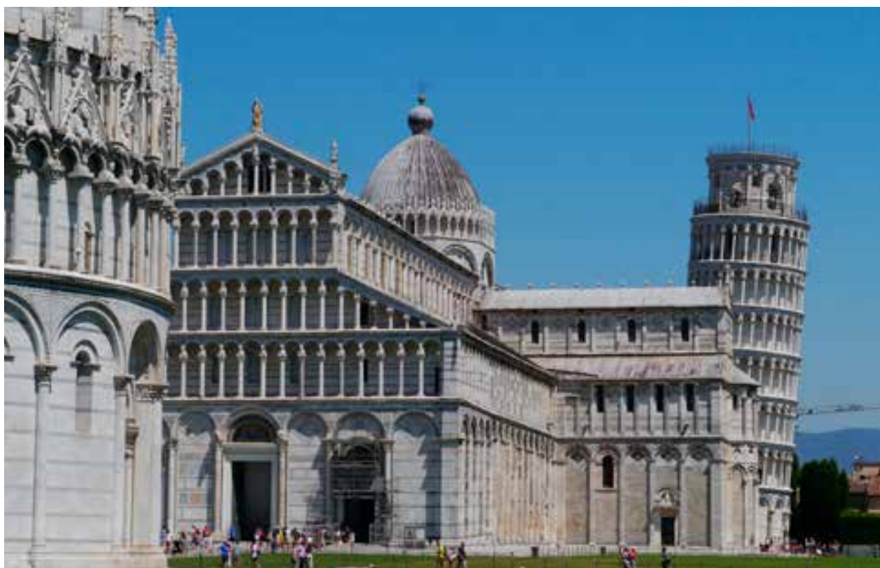
▽ La Place des Miracles à Pise