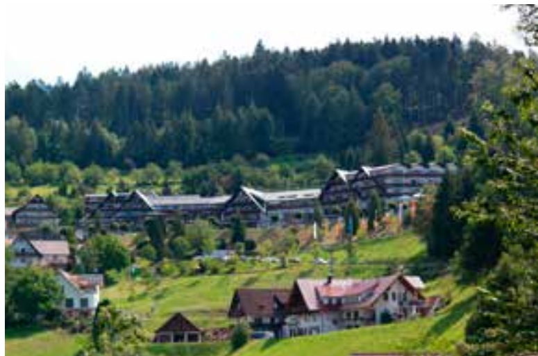
Het prachtig gelegen Dollenberg Resort in Bad Peterstal-Griesbach

Elke dag hebben wij genoten van het happy hour ... met alle drankjes aan de helft van de prijs! Kortom: dit hotel is een oase van rust in het Zwarte Woud, en het benadert in alle opzichten de perfectie.