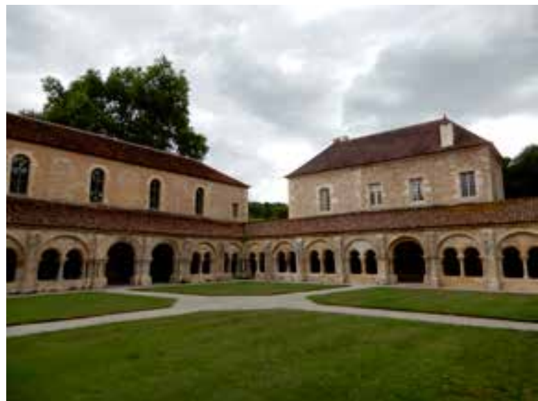
▽ Vue partielle du cloître