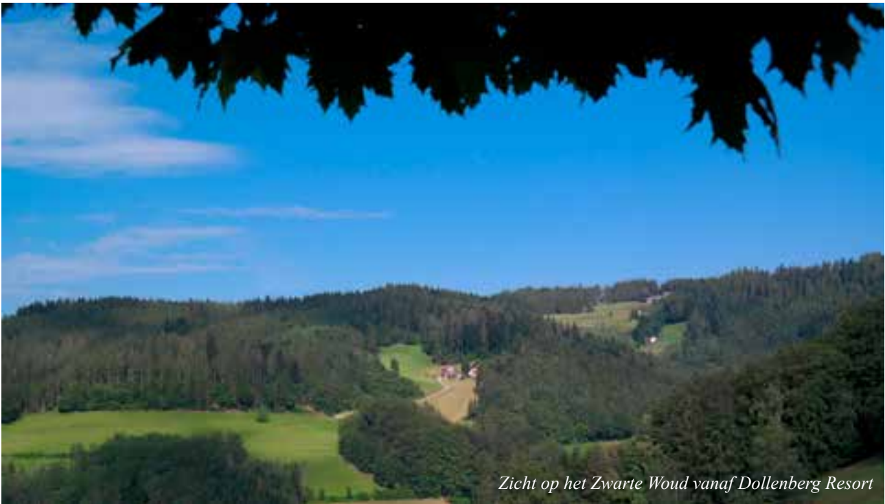
Zicht op het Zwarte Woud vanaf Dollenberg Resort