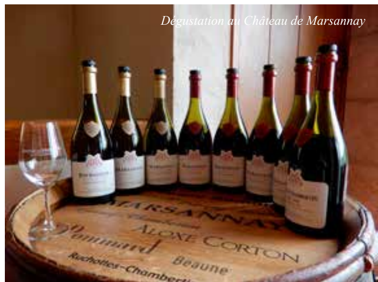
Dégustation au Château de Marsannay