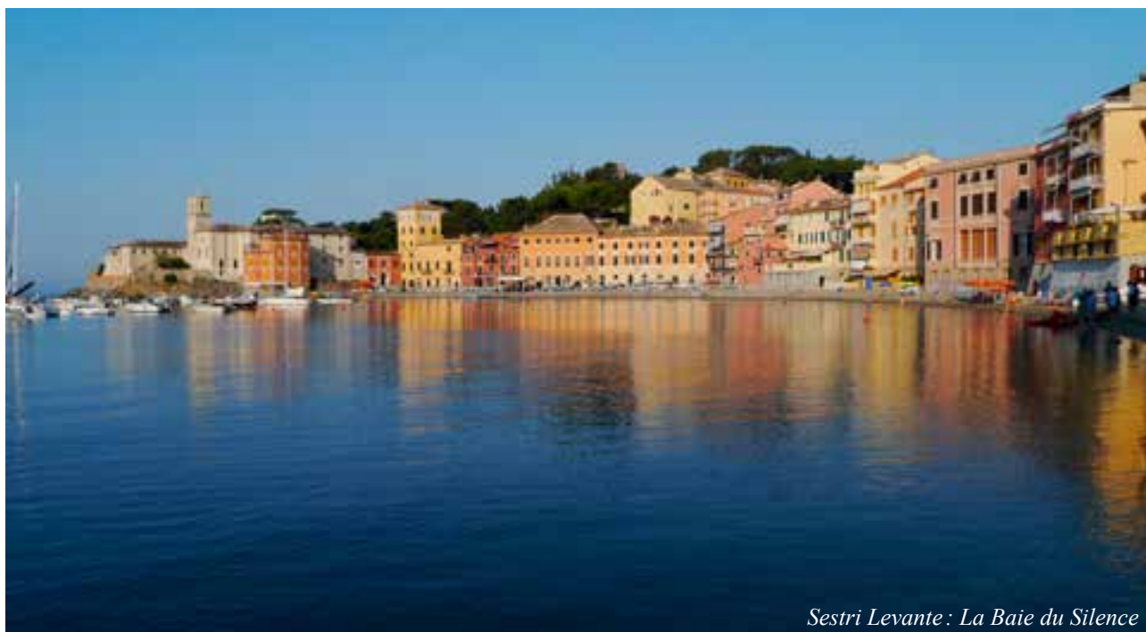
Sestri Levante : La Baie du Silence