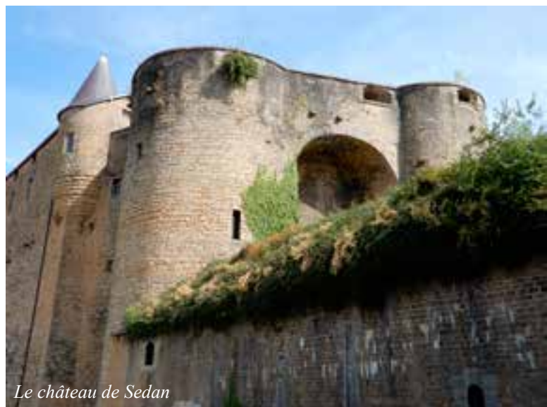
Le château de Sedan