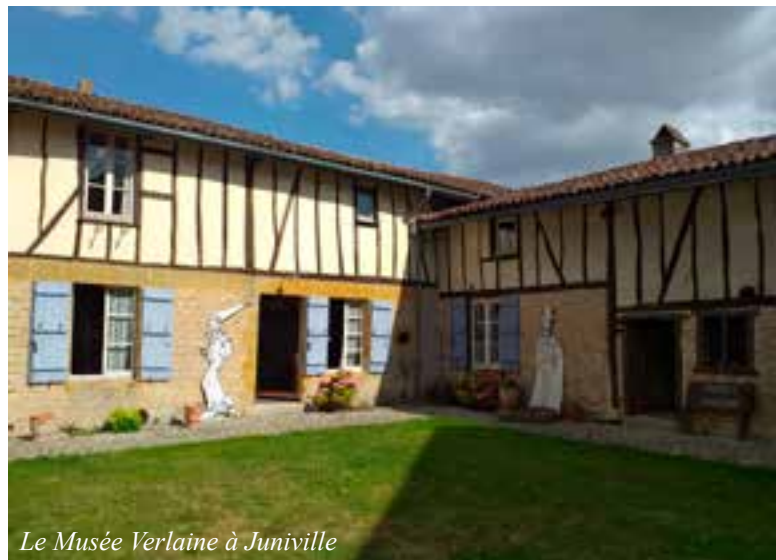
Le Musée Verlaine à Juniville