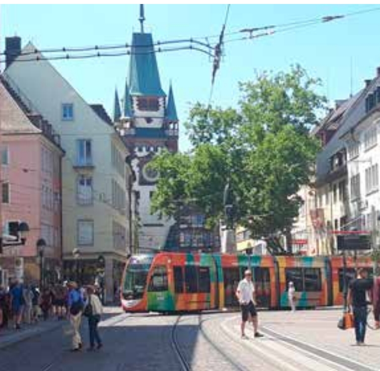
In de hoofdstraat van de verkeersvrije Altstadt van Freiburg

De slogan van Freiburg is Green City , nogal logisch want het is de meest ecologische Duitse stad met veel alternatieve energie (zoals zonne-energie), met het grootste aantal biowinkels van Duitsland, met een verkeersvrije binnenstad (of Altstadt ) en een zeer efficiënt openbaar vervoer. De meest bekende attractie is de gotische Münster met de 116 m hoge toren, gelegen op de Münsterplatz. Het oude en nieuwe stadhuis liggen aan het geanimeerde Rathausplatz. Geniet in Freiburg van de vele speciale winkeltjes in het shoppinghart. Heel bijzonder zijn de historische gootjes ( Freiburger Bächle ) waarin helder water overal in de straten en steegjes stroomt. Het Europa Park in Rust is het grootste attractiepark van Duitsland en sinds jaren verkozen tot het beste van Europa. Dit park en resort is beroemd om zijn 13 achtbanen (waaronder de hoogste van Europa) en de reis om de wereld met 13 toeristische landen (met o.m. Nederland... maar van ons land is geen spoor!). Tenslotte gaan we helemaal in het zuidoosten van Duitsland (en het Zwarte Woud) naar Weil am Rhein , wereldbekend om de onderneming Vitra (°1950) en gespecialiseerd in design meubelproductie. Bezoek er het Vitra Design Museum (uit 1989, het eerste werk van de beroemde architect Frank Gehry in Europa), en de Vita Campus.