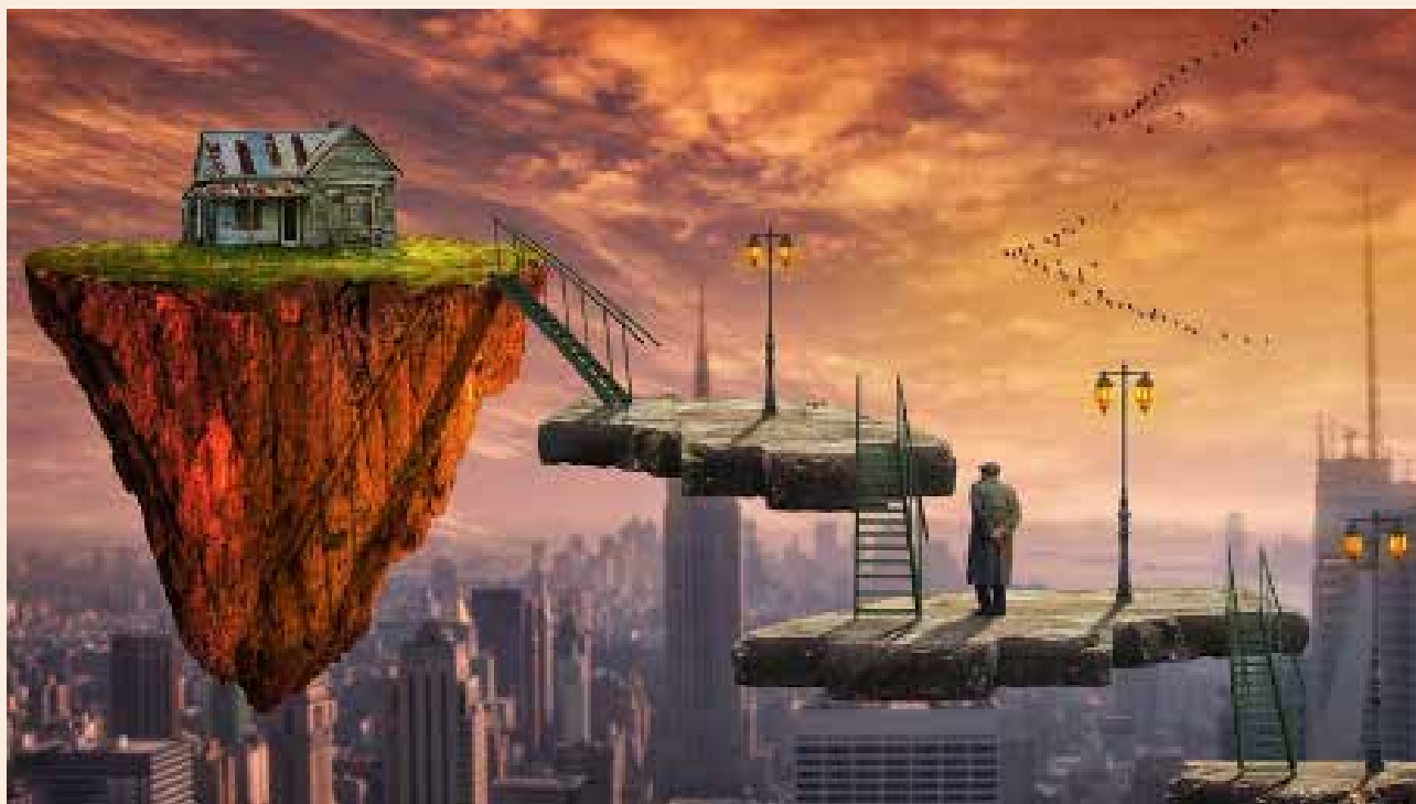
'Eindelijk uit ons kot'