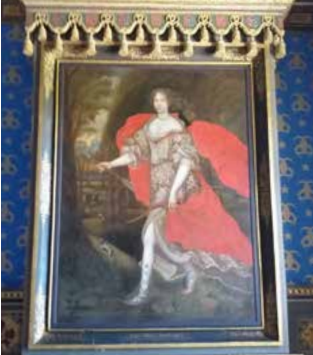
Ancy-le-Franc: Diane dans la Chambre des Fleurs