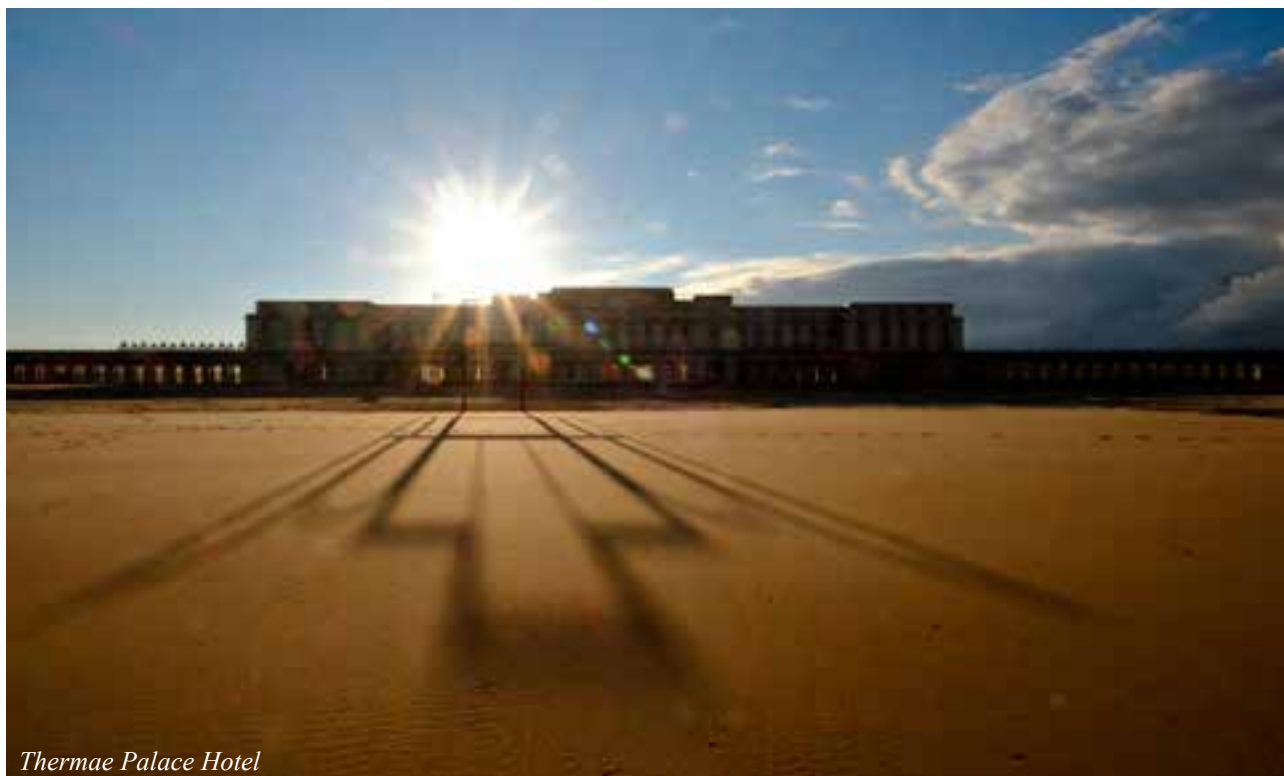
Thermae Palace Hotel