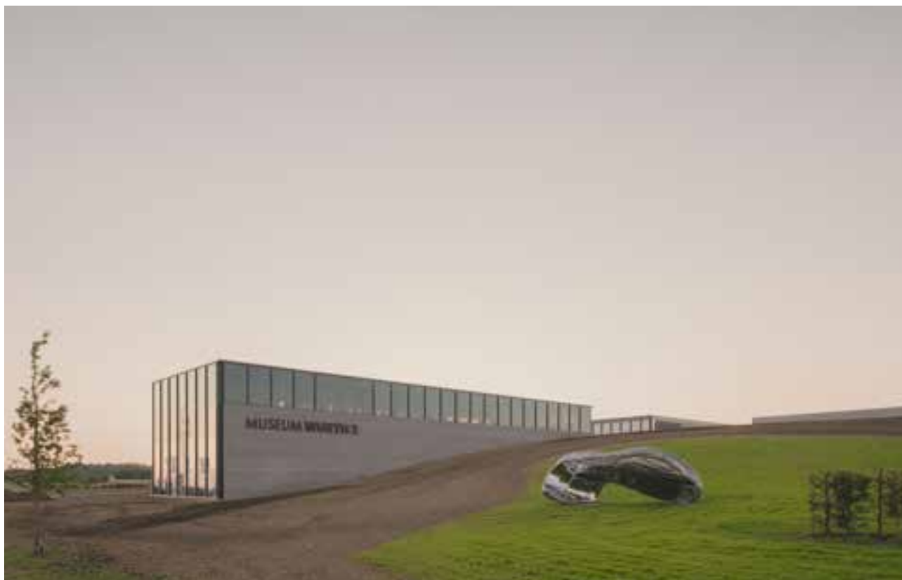
△ Carmen Würth Forum Außenansicht Museum © Simon Menges ▽ Carmen Würth Forum Vorplatz © Simon Menges