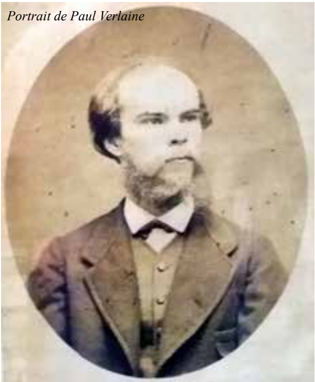
Portrait de Paul Verlaine

En 1424, Evrard de la Marck-Arenberg II bâtit sur un éperon rocheux au-dessus de Sedan un château-fort avec une première fortification. Ses neuf successeurs renforcèrent constamment les défenses en suivant les progrès des techniques de siège et le développement de l'artillerie. Sedan devint progressivement une formidable forteresse dont les murs étaient épais de 7 à 27 m. Située à la frontière de la France et du Saint-Empire germanique, à une position-clé, la ville devint une principauté pratiquement indépendante durant un siècle sous la protection de la France. Mais en 1642, le prince Frédéric-Maurice de la Tour d'Auvergne fut compromis dans la conjuration de Cinq-Mars contre Richelieu. Ce fut la fin de la principauté, car pour