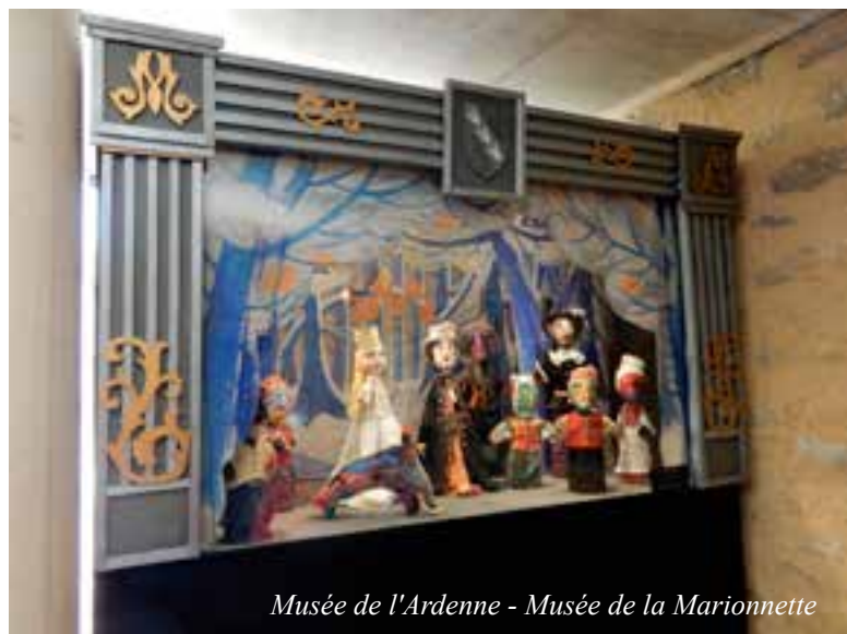
Musée de l'Ardenne - Musée de la Marionnette