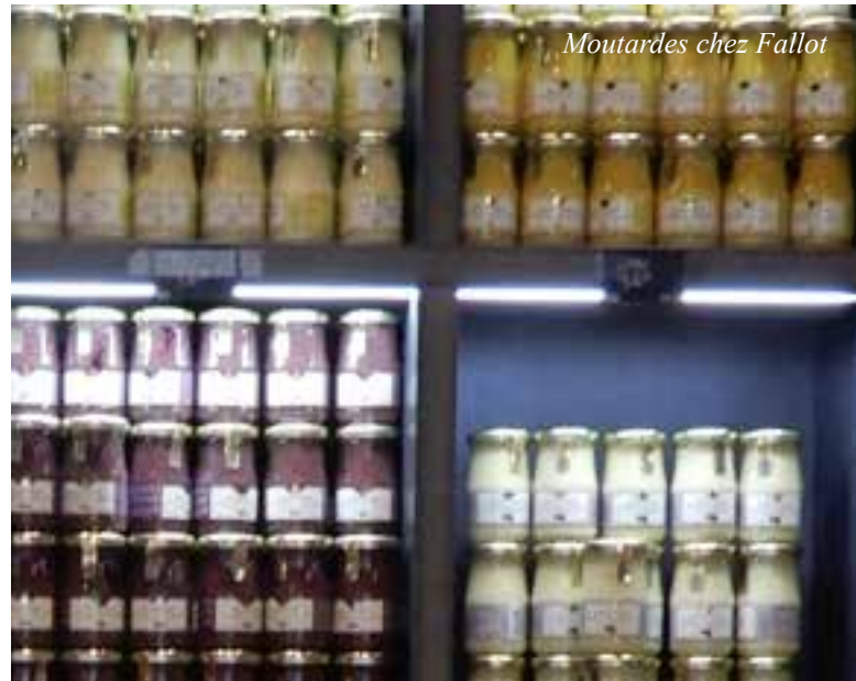
Moutardes chez Fallot

(sol, cépage, exposition, micro-climat...) et par le travail humain qui l'a façonnée et s'identifie par le vin qu'elle produit. Le site, planté de deux cépages uniques, le pinot noir et le chardonnay, avec des sols argilo-calcaires très variés, est un exemple unique de production vinicole ininterrompue depuis le haut