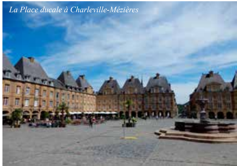
La Place ducale à Charleville-Mézières

Arthur Rimbaud est né le 20 octobre 1854 à Charleville dans une famille de cinq enfants. Il publie son premier poème à 15 ans. Ses études sont brillantes, il collectionne tous les prix et concours. Inspiré notamment par Baudelaire et Victor Hugo, il se démarque très vite des auteurs classiques pour suivre ses propres conceptions littéraires. Il écrit des poèmes en prose, estime que le poète doit tenter de décrire l'inconnu, devenir une sorte de visionnaire qui doit prendre tous les risques personnels. Viennent ensuite le Dormeur du Val , Le Bateau Ivre , Une saison en Enfer , Illuminations ,