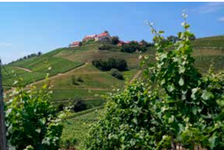
Zicht op de wijngaarden van Durbach met op de top het 11 de eeuwse kasteel

Westelijk grenzend aan het Zwarte Woud ligt de Rijnslenk met hellingen vol met wijngaarden (vergelijk met de geografische/geologische analogie van de Vogezen en de Elzas in Frankrijk). De zonnige wijnstreek Baden is de derde belangrijkste wijnproducent van Duitsland. Wij volgden een groot deel van de Badische Weinstrasse: deze autoroute loopt van Baden-Baden in het noorden tot Weil am Rhein in het zuiden (vlakbij de Rijn en de Zwitserse grens). Het bekendste wijndorp is Durbach met een adembenemend landschap in de omgeving. Nabij het kasteel van Staufenberg kan je heerlijke wijn proeven en kopen in het Markgräfllich Badisches Weinhaus .