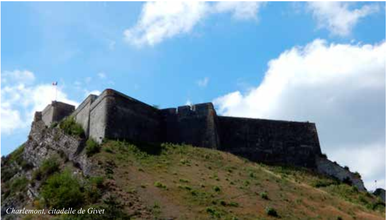
Charlemont, citadelle de Givet