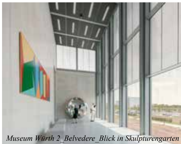
Museum Würth 2_Belvedere_Blick in Skulpturengarten