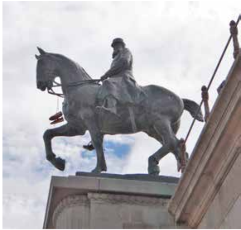
△ Leopold II met basketsloefen... ▽ Corona overal aanwezig, zelfs in de kunst...