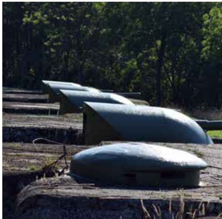
Tourelles de tir