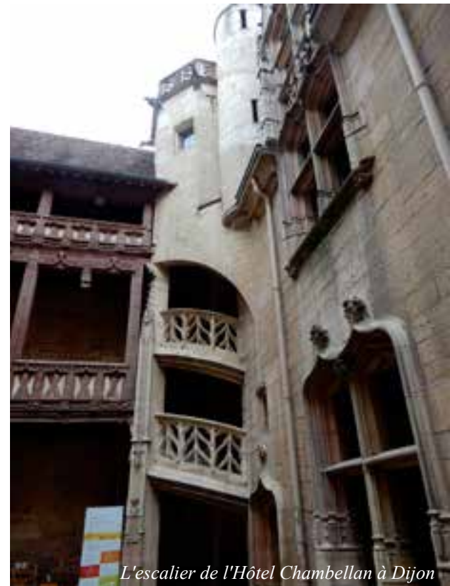
L'escalier de l'Hôtel Chambellan à Dijon

Dijon est devenue en quelques années une métropole dynamique : nouvelle gare TGV, implantation de lignes de tramway, création d'un palais des congrès et d'expositions, aménagement du centre historique en un superbe piétonnier, rénovation du remarquable Musée des Beaux-Arts... Pour une première découverte de la cité, une visite guidée dans le centre historique est à conseiller. L'attraction majeure est sans conteste le Musée des Beaux-Arts (3* au guide Michelin) dans le cadre impressionnant du Palais des Ducs et des Etats de Bourgogne. Il faut prévoir plus de deux heures pour admirer les importantes collections du musée réparties en une cinquantaine de salles. Nous avons particulièrement apprécié les salles médiévales contenant les œuvres des XV e et XVI e s. de nos provinces provenant du mécénat des ducs de Bourgogne : Vierges de Pitié, triptyques, retables et tableaux splendides de Rogier