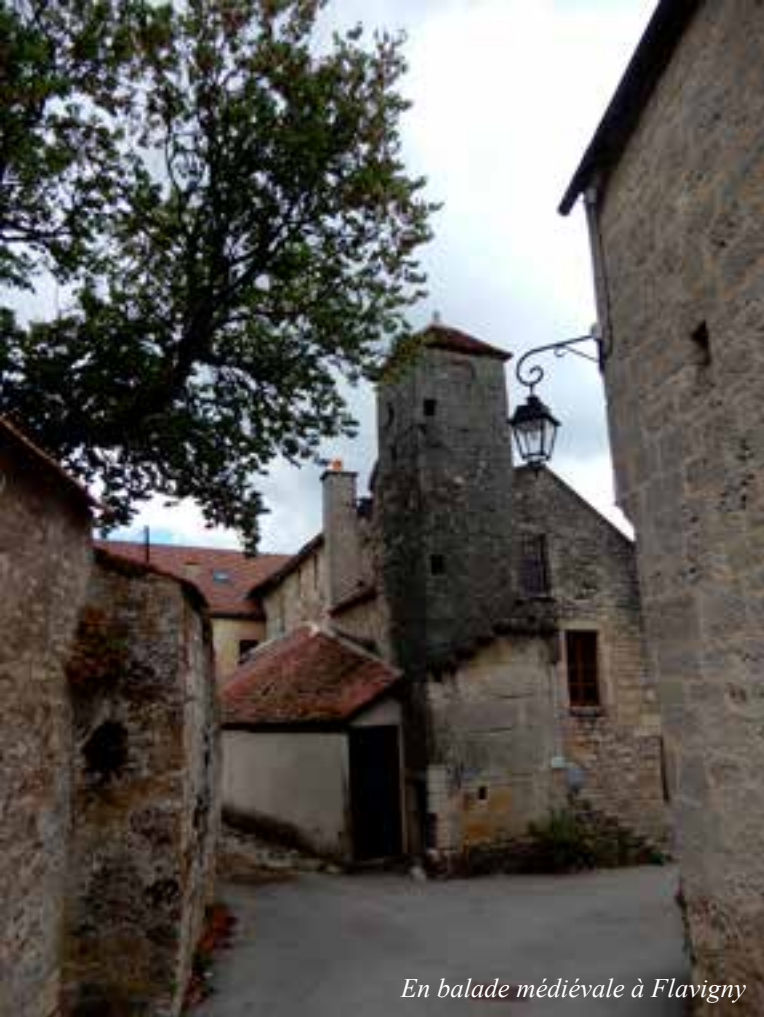
En balade médiévale à Flavigny