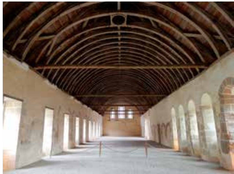
△ Fontenay: le dortoir des moines

Le merveilleux château d'Ancy-le-Franc est peut-être le plus beau château Renaissance de France. Il fut construit entre 1542 et 1550 par Sebastiano Serlio, architecte italien du roi François 1 er , pour le beau-frère de Diane de Poitiers, Antoine III de Clermont. Il se caractérise par l'importance des peintures murales des 16 e et 17 e siècles ainsi que par les superbes plafonds à caissons. Après la remarquable cour d'honneur, c'est une succession d'appartements, de salles, de cabinets et de galeries richement ornés de peintures représentant des scènes mythologiques et religieuses. On retiendra surtout la magnifique peinture murale avec la bataille de Pharsale, longue de 20 mètres, où les chevaux se comportent comme des humains, la chambre des Arts, la chambre des Fleurs, la chambre de Diane, la chapelle et le parc à l'anglaise avec une folie.