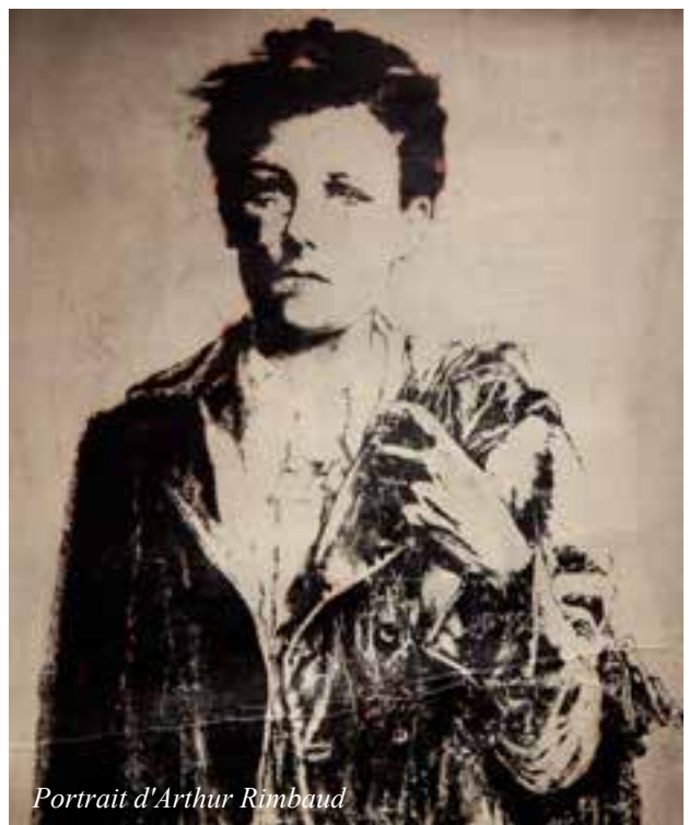
Portrait d'Arthur Rimbaud