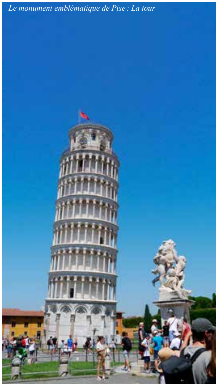
Le monument emblématique de Pise : La tour