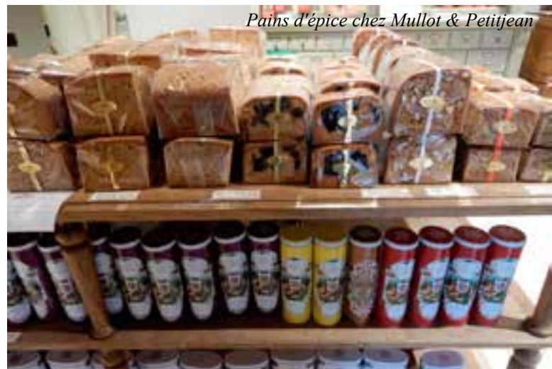
Pains d'épice chez Mullet & Petitjean