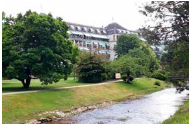
Het beroemde Brenners Park hotel langs de Lichtenberger Allee in Baden-Baden

Kunst en Techniek van de 19de eeuw (met een boeiende tentoonstelling Baden in Schönheit , over de badcultuur in het begin van de 20ste eeuw), en het interessante Stadtmuseum waar men zowat alles te weten komt van de lokale geschiedenis. Voor een betaalbare lunch kan men terecht in de brasserie van het Kurhaus (met uitnodigend terras) of in Café König (met annex een oogverblindende patisserie waar men een lekker stuk Schwarzwaldtorte kan proeven). Een ander aan te bevelen kuuroord in het zuidoosten van het Zwarte Woud is het veel kleinere Badenweiler met een Kurpark en overblijfselen van de Romeinse baden.