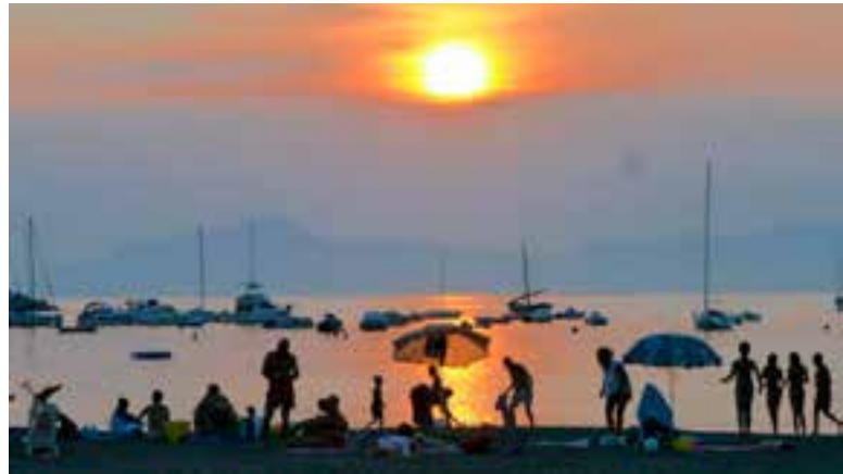
△ Coucher de soleil à Sestri Levante ▽ Portofino, un cadre idyllique

C'est au départ de Santa Margherita que vous pouvez vous rendre en bateau à Portofino. N'hésitez pas à flâner dans ce village de pêcheurs à travers un dédale de ruelles menant toutes à la Piazzetta, petite place pavée entourant le petit port où sont encreés les plus beaux yachts de la Méditerranée. Vous avez aussi la possibilité de faire une très belle promenade en direction du Château Brown , véritable forteresse du XVI e siècle, transformé en musée.