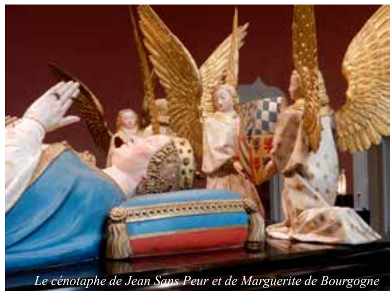
Le cenotaphe de Jean Sans Peur et de Marguerite de Bourgogne