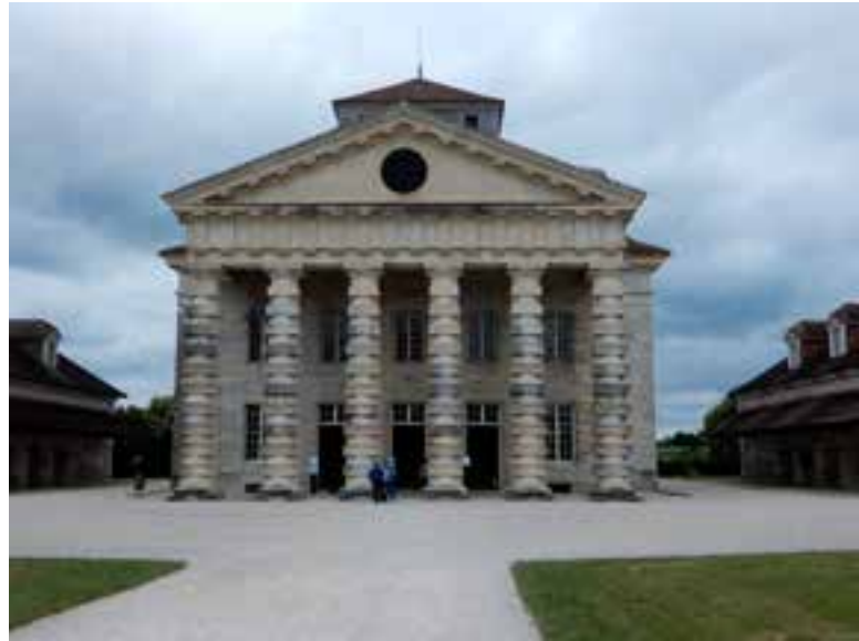
△ Saline royale à Arc-et-Senans : maison du directeur ▽ Dôle se mire dans le Doubs

Ancienne capitale du Jura, Dôle est une cité pittoresque et agréable. Dominée par la basilique Notre-Dame (xvii e s.), elle possède dans son centre historique des rues médiévales typiques, dont la petite rue Pasteur où se niche la maison natale de Louis Pasteur . Le célèbre chimiste (1822-1895) à qui nous devons le vaccin contre la rage et bien d'autres découvertes, naquit en effet dans la tannerie familiale le long de la rivière. C'est aujourd'hui un charmant musée à la gloire de la célébrité locale et mondiale. Il eut le privilège rarissime d'assister de son vivant à cette création.