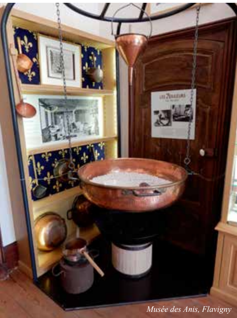
Musée des Anis, Flavigny

Alesia: vous souvenez-vous? C'est près de la localité d'Alise-Sainte-Reine que le méchant Jules César a assiégé et vaincu le vaillant Vercingétorix qui commandait les troupes gauloises unies! Le Département de la Côte d'Or a créé sur ce site un superbe centre d'interprétation imaginé par l'architecte Bernard Tschumi. L'imposant bâtiment circulaire symbolise l'encercllement des Gaulois par les Romains. L'espace muséographique, que le visiteur peut parcourir avec un audioguide, est de grande qualité. Nos souvenirs scolaires ont ainsi été rafraîchis avec bonheur. A côté du centre, une reconstitution partielle en grandeur nature d'un camp romain a été construite, longue d'une centaine de mètres avec la double ligne de fortifications. Des animations pour enfants y sont organisées en permanence.