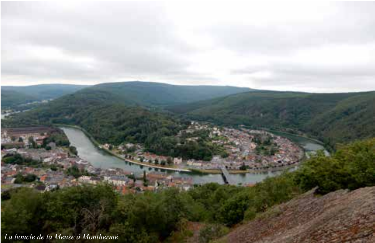
La boucle de la Meuse à Monthermé