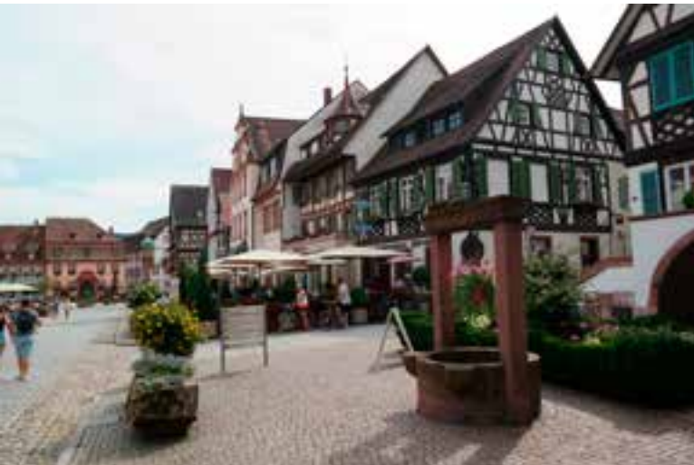
Marktplein in het schilderachtige stadje Gengenbach

Ten zuiden van Freiburg ligt het Hochschwarzwald met wintersportmogelijkheden op de Feldberg. Bezoek het stadje Staufen im Breigau, dat gedomineerd wordt door het kasteel Staufenberg, en verpoos even op het aardige marktplein met fontein en stadhuis (°1546).