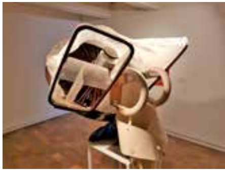
Ook Panamarenko valt te bewonderen in Mu.ZEE