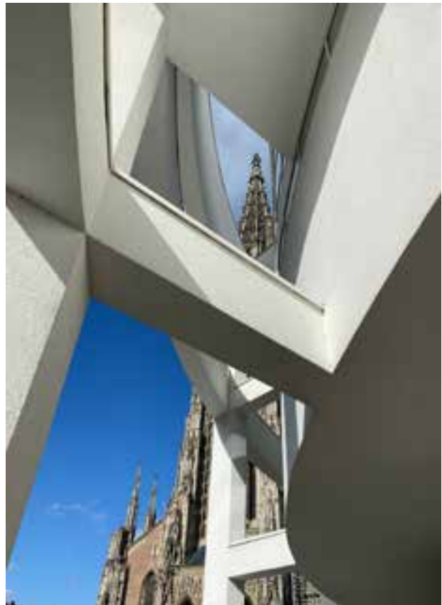
Kerk en stadhuis

toenmalige vesting gebouwd in Europa, als bescherming tegen de Beierse expansiedrang. In 1869 werd de stad Neu-Ulm gesticht, als tegenpool van de stad Ulm in de andere deelstaat. Einstein werd geboren in Ulm, Kepler stelde er zijn wetten op, en recent was er een tentoonstelling over ‘Transhuman: Von der Prothetik zum Cyborg’. Wetenschap was en is hier dus aanwezig. Afwachten wat de toekomst op dit vlak in petto heeft. Maar dat is toekomst!