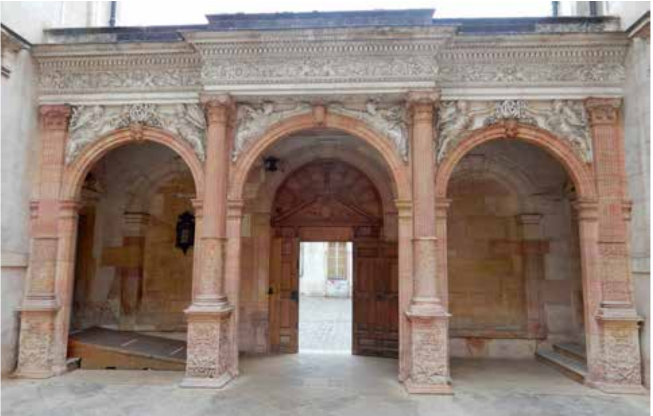
△ Dijon : porche de l'Hôtel de Vogüé ▽ Le château d'Ancy-le-Franc