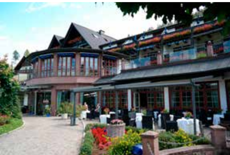
Hoofdingang van het Dollenberg Resort met het 2* restaurant Le Pavillion op de eerste verdieping.

een stuk lager dan in België, zeker wat de wijnen betreft. En de gastvrijheid en – vriendelijkheid staan hoog in het vaandel!