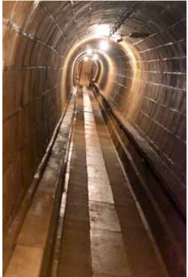
Couloir de liaison