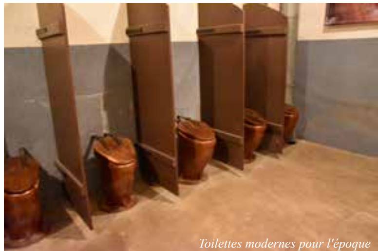
Toilettes modernes pour l'époque