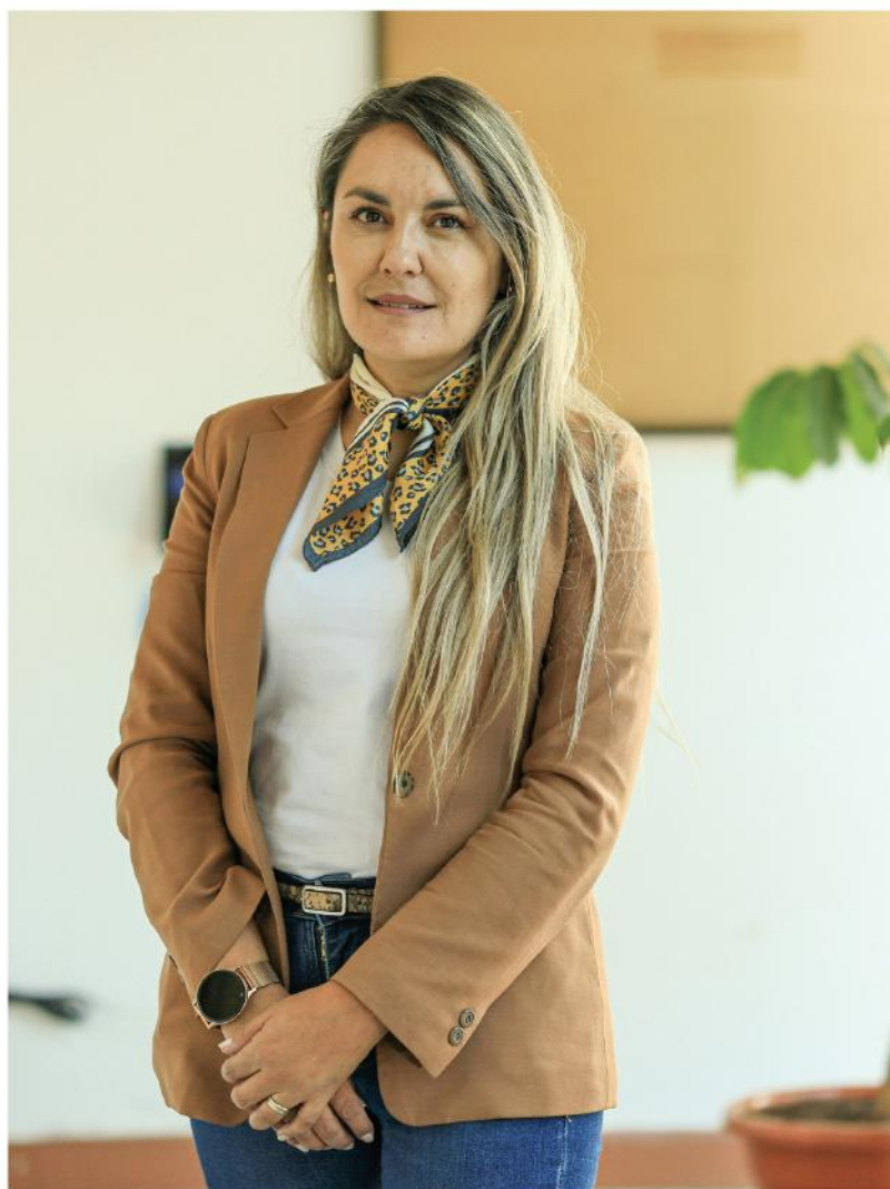
España Irala Irlanda América. Docente de la Facultad de Contaduría Pública y Ciencias Financieras

La investigación tiene el objetivo de identificar los factores que influyen sobre la deserción universitaria de los estudiantes de la Universidad Mayor, Real y Pontificia de San Francisco Xavier de Chuquisaca; la investigación es de tipo aplicada, cuantitativa, descriptiva, cuasi-experimental. Busca entender mejor la deserción estudiantil a partir del análisis de ecuaciones estructurales, apoyado en el software SmartPLS versión 3. La población de referencia para el estudio es el total de estudiantes matriculados al inicio de la gestión 2017 (46.347 estudiantes), se realizó un muestreo probabilístico aleatorio para población finita conocida al 97% de confianza y 3% de error, con un total de 2.216 estudiantes encuestados (femenino 1.079, masculino 1.137). El análisis a través de ecuaciones estructurales determinó que los factores "Económico" y "Familiar" resultan ser los que tienen la mayor influencia en el abandono estudiantil, complementariamente se identificaron otros factores, como el de "Motivación", "Salud", "Social" y "Académico". Sobre la base de los resultados, se recomienda realizar investigaciones complementarias de cada factor identificado.