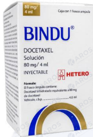
BINDU Docetaxel 80 Mg/4mL