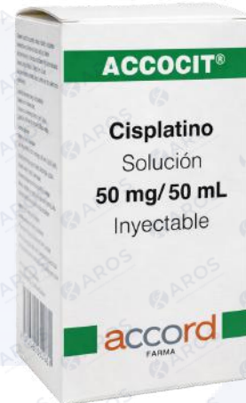
ACCOCIT Cisplatino 50mg/50mL Iny