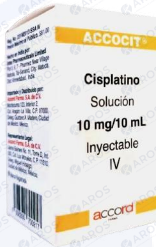
ACCOCIT Cisplatino 10mg/10mL Iny

Venta y distribución exclusiva a instituciones de salud y profesionales autorizados.