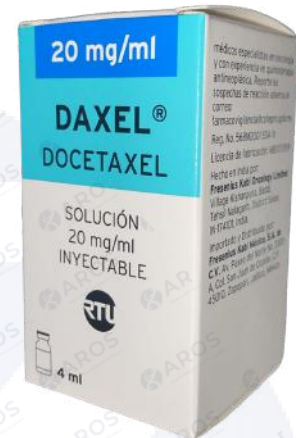
DAXEL Docetaxel 80 mg 20 Mg/4mL