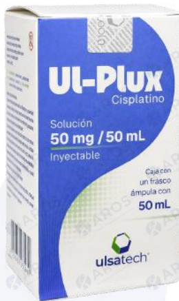
Ul-Plux Cisplatino 50mg/50mL