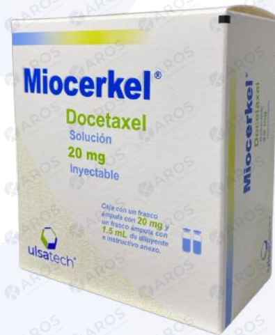
MIOCERKEL Docetaxel 20 Mg/0.5mL

Venta y distribución exclusiva a instituciones de salud y profesionales autorizados.