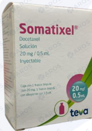
SOMATIXEL Docetaxel 20 Mg/0.5mL