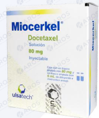
MIOCERKEL Docetaxel 80 mg/6mL

Venta y distribución exclusiva a instituciones de salud y profesionales autorizados.