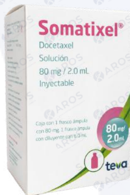
SOMATIXEL Docetaxel 80 Mg/2.0mL