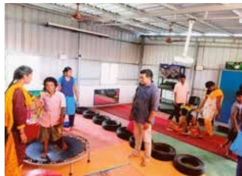
Enfants sourds et malentendants au centre Navahvani

Hulp en Hoop Aide et Espoir Hilfe und Hoffnung